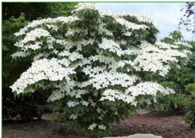
Japonski dren cvetnik cveti konec maja in na začetku junija. Za dobro rast potrebuje sveža hranilna tla. Plodovi so užitni od avgusta.

ne materiale ali žive meje iz grmovnic, če se le da iz zimzelenih grmovnic, kot so lovoriko-