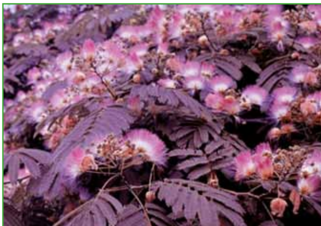
Albicija zadnje čase zelo priljubljeno drevo, privlačno za čebele. Prija ji zavetna lega.

vec, tisa ali bodika. Vrt naj bo tudi za bivanje na prostem še na vrtni terasi ali v uti.