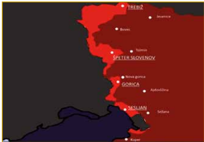
Oranžna farba nam nutpokaže, v steri krajinaj skrak granice Slovenci v Italiji živejo. Samo eno par varašov pa vesnic je nut napisani, depa, toga dosta, dosta več geste.

Slovinci skrak Slovenije eške na Madžarskom, v Austriji pa Italiji živejo. Ranč tam Slovincov največ geste, neka več kak 70 000 nji v šesti krajinaj živé.