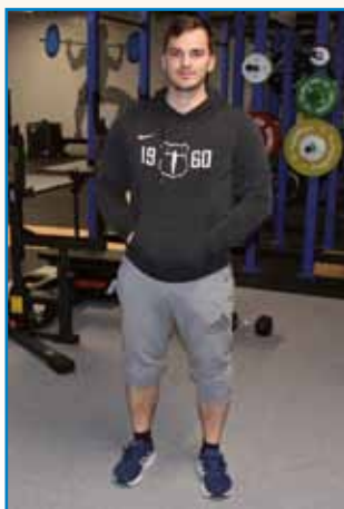
CENTER GIBANJA... stran 4