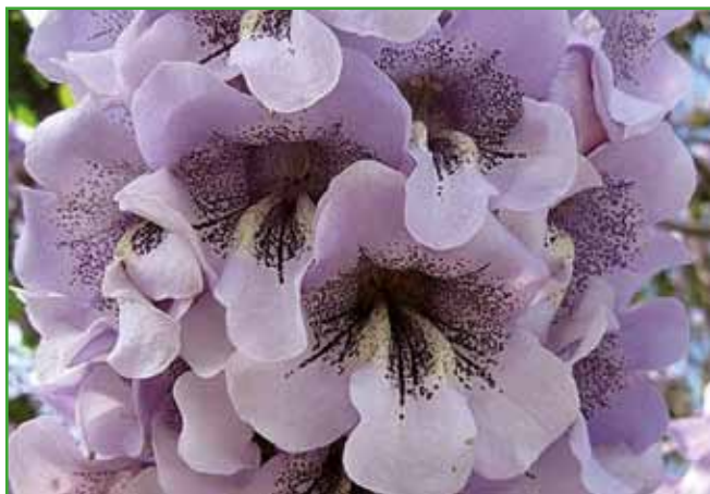
Pavlovnija cveti pred olistanjem v velikih latih in cvetovi prijetno dišijo. Če ne pomrzne, cveti vsako leto.

jih je treba upoštevati predvsem v ekstremnih razmerah (na kislih, pu- stih peščenih ali močvir-