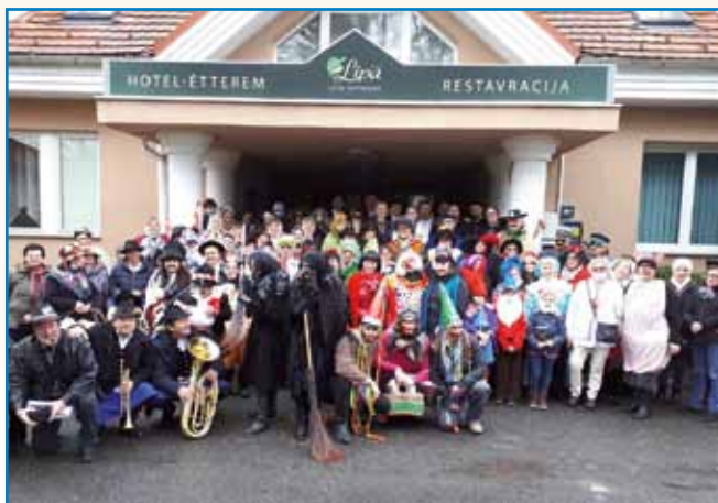
SLOVENSKA FAŠENSKA POVORKA V MONOŠTRI stran 3