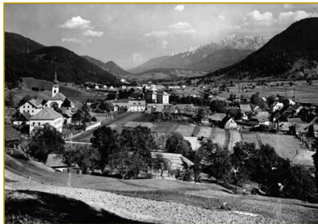
Žabnice so leta 1920 tak vögledale. Gnes je turizem svoje naredo, ves se je na velke vöminila. Apartmaj, hoteli pa vse takše je za smučarski turizem bilau napravleno. Iz Žabnice na eno pa pau vöro dugo paut raumarge na Svete Višarje ojdijo.

že se skur kak rejč trebež čüje. Pri naši stari poganski Slavaj je terbež sveto mesto bilau. Na njem so kakšnomi od svoji vnaugi bogauv dar dojdjali.