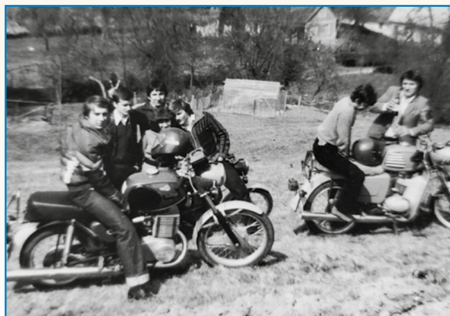
ČE NEMO MOGO V MTZ SESTI, TE JE ŽE GOTOVO stran 8