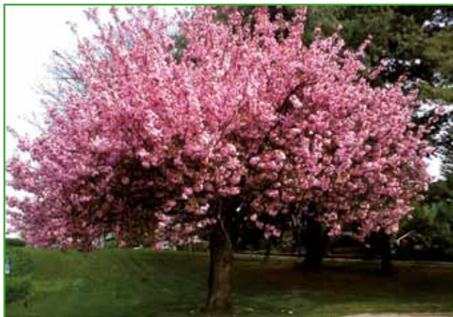
Japonska češnja zacveti v maju.

rdečelistnih dreves med preostali drevesni izbor. Sadimo jih posamezno. Vsaka vrsta ima posebne zahteve glede tal, ki