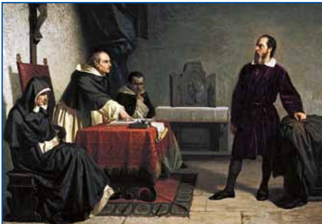
Galileo Galilej pred rimsko inkvizicijo (delo Cristiana Bantija, 1857). Po obtoževanjih s strani cerkvenih krogov naj bi ga obsodil sam papež Urban VIII., nekoč prijatelj in občudovalec italijanskega fizika.

Nekateri raziskovalci trdijo: če bi Galilej svoje raziskave objavil le kot astronomske hipoteze, ga inkvizicija ne bi obsodila. Spor naj bi namreč nastal zaradi tega, ker je učenjak kršil prepoved širjenja Kopernikovih nauk. Tekom stoletij je Cerkev postopoma prepoznala vrednost Galileje-