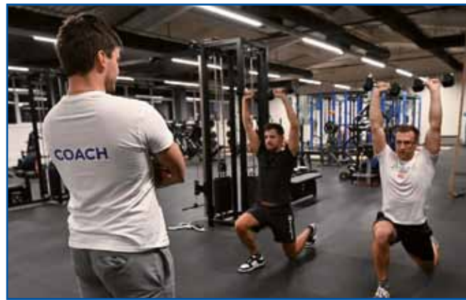
V Centri gibanja so tak individualne kak skupinske vadbe.

k nam pridejo, ka jih te mi pa spravimo v gibanje. Ne odijo pa v naš center samo takši lidge, liki tudi športniki pa takši, steri majo kakšo falingo na tejlji oziroma takši, steri škejo z gibanjom poskrbeti za svoje zdravdje,« pravi sogovornik in