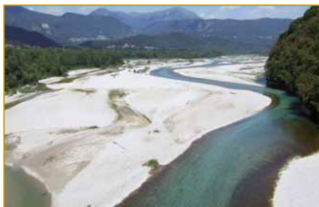
Tak reka Bela v Kanalski dolini vleti vögleda, gda bole malo vode po njoj teče. Bejli kamni so se doj z viski brgauv spoškallili. Voda ji je »dojzbrüsil«, ka lejpi okraugli so gratali.

1360 je paster svojo živino tagor na Višarje gnau. Ja, eške nej sveto ménje na redej bilau. Tam je v enom grmi kip (szobor) Marije z Jezušom najšo. K dühovniki v ves Žabnice doj v dolino ga je odneso. Dühovnik kip nut v omar zaklene. Kak paster na drugi den na isto mesto pride, Marijo z Jezušom znauva nut v grmi najde. Eške gnauk doj v ves ga nese, dühovnik gnako