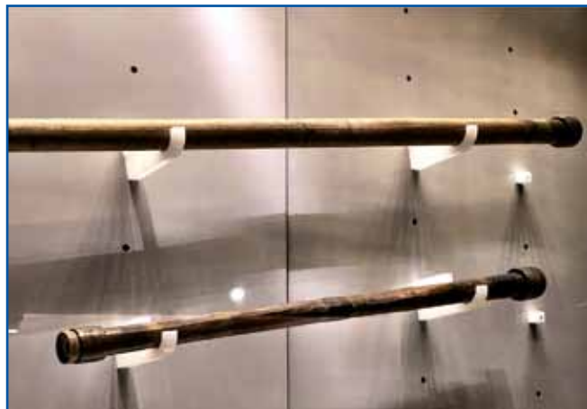
V florentinskem muzeju hranijo dva daljnogleda vsestranskega astronoma iz leta 1610. Zgornji je bil sposoben 14-kratne povečave, spodnji pa 21-kratne.

Učenjak je najprej začel opazovati Luno. S pomočjo novega orodja je ugotovil, da naš nebeški spremljevalec ni popolnoma gladek (kot je učil Aristotel), temveč je na njegovi površini na tisoče kraterjev. O temnejših površinah je napačno mislil, da gre za zemeljskim podobna »morja« – to poimenovanje pa smo ohranili vse do danes. V naši dobi le redkokdo lahko jasno vidi Rimsko cesto na nebu, pred štirimi stoletji pa je bilo