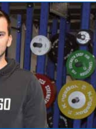
Nauva telovadnica je v zidini nekdešnje fabrike Mura.

je vküper küpilo pet različnih firm, tak ka je vse delo ške nej zgotovljeno: »Fasado de ške trbelo napraviti pa tudi malo bole vrejdvzeti okolico, tak ka tau ške pride na red. Brodim, ka je dobro gé ka so se skor vse Murine zidine odale in se v nji