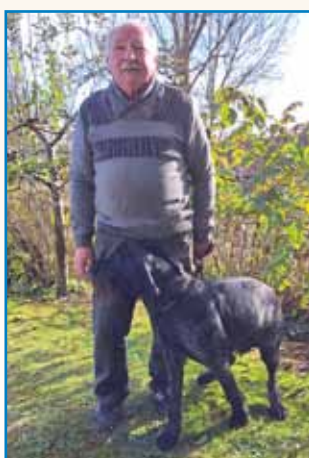
GRONSKA STREJLA PA TA BRZINA stran 6