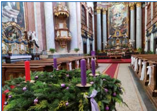
Adventni vejnec v varaškoj cerkvi.

Se pripravlamo na velki sve-tek, na rojstvo Jezuša. Advent drži od nedele, stera je bliže dneva sv. Andraža pa vse do Božiča. Adventus Domini zna-menüje prihod gospoda. Letos se od 3. decembra začne, drži do 24. Na tau se pripravlamo v tejli in düši. Redimo doma adventne vence ali ji küpi-mo, okinčamo ram, balkon. Adventni venec je gé simbol čakanja Božiča, štiri svejče pa znamenüjejo štiri kedne adventa. Vence so najprva v Nemčiji redili v 19. stoletji iz zelene barojce, bukspan sim-bolizira vüpanje. Kesneje so svejče tö gordjali. Najprva 24 sveč pa so vsakši den eno vuž-gali, te so pa spremenili na 4 svejče pa so vsikšo adventno nedelo eno vužgali. Najprva so evangeličani meli tau šego, po prvoj svetovnoj bojni so ka-toličani tau prejkvzeli. Te štiri svejče znamenüjejo štiri kedne adventa. Prva je vera, drüga je vüpanje, tretje je veselje in štr-ta je lübezen. Pri katoličanaj so tri svejče lila gé in ena rau-za. Tau vužgejo na tretjo nede-lo. Pri nas v Porabji je tradicija gé velki venec rediti pred cerk-vijo. Zdaj že v vsakšoj varaši, vesi gestejo. Na prvo adventno