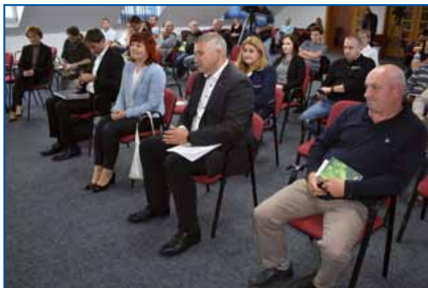
Del prisotnih podjetnikov na informativnem dogodku ob predstavitvi Programa spodbujanja gospodarske osnove avtohtone slovenske narodne skupnosti na Madžarskem 2021–2024 (25. oktober 2022, Slovenski kulturni in informacijski center)

uspešnih 8 prijaviteljev, to so bili občine, s. p.-ji, predelovalci. Dodeljeno je bilo 302.500 evrov. Projekte so začeli izvajati že letos, končajo se naslednje leto, prispevali pa bodo k temu, da dobimo v Porabju nove oziroma obnovimo obstoječe turistične