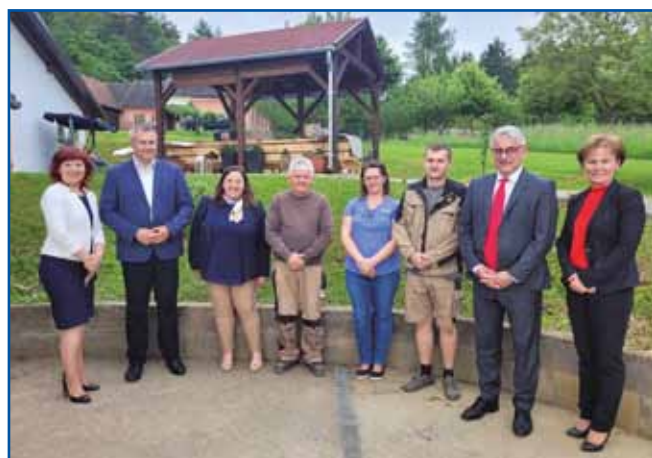
Obisk slovenske delagacije pod vodstvom ministra za gospodarstvo, turizem in šport Matjaža Hana pri podjetniku - Porabski mizar (Gornji Senik, 23. maj 2023)

ves, omogoča pridobitev finančne podpore za razvoj v okviru treh ukrepov. Uspešni prijavitelji so za izvedbo svojih projektov pridobili nepovratna sredstva med 3000 in 50.000 evri. Sofinanciranje Slovenije je