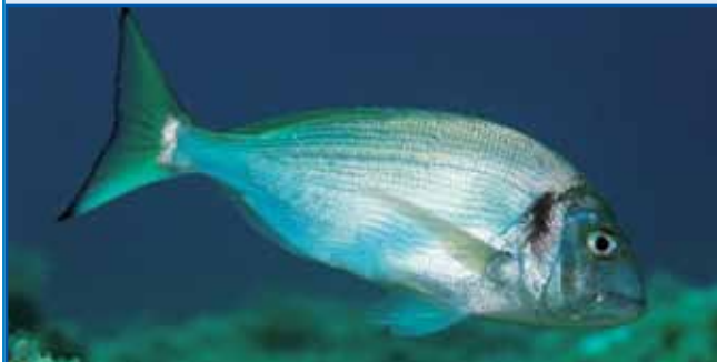
Orada leko več kak pau mejtera duga zraste pa ta do 10 kil žmeče dobi. Lidge zveškoga na talejr takše od 20 do 30 dek žmetne dobjijo, stere se pauvajo. Dosta je iz takši farm vövujde, venej se na velke plodijo.

... je nauvi rekord biu gorpostavljeni. Depa, tau nej kakši takši rekord, ka bi ga stoj v športi gorpostavo. Té rekord nam žalostno pripovejst pripovejda, ka smo s svejtom kaulak nas, z našo matero Zemlo naprajli. Depa, prva rekord poglednemo, v zadnji 40 lejt nut moramo pokukati. V tom časi so katastrofe, stere je segrejanje atmosfere naprajlo, za 650 milijard evronov kvara v EU-ni prinesle. Analize so naprej prinesle, ka v tejm je ranč Slovenija na prvo mesto prišla. 3452 evrona je ta numera, stera je té rekord »gorpostavila«. Gda cejli kvar se zmejs med lidi raztala, telko na človeka pride. Ne gučijmo od cejlga kvara v EU-ni, od tistoga, ka se je pod Srebrnim brejgom naredo. So ga povaudni, süjšava naredle, zmejs se je zemla trausila pa doj plazila,