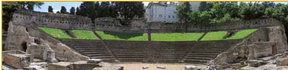
Staro rimsko gledališče so kaulak leta 100 gorpostavili. Tau nam ranč od toga pripovejda, ka Trst ali po indašnjom Tergeste je vse bole raslo, vse več lidi je v njega prišlo živet. Vnaugi patriciji so si v njem svoj daum najšli.

Reka v maurdje v vesi Milje pride. Tau je prva ves, v stero skrak maurdja iz Slovenije v Italijo pridemo. Indasvejta je tau vcejlak slovenska ves bila,