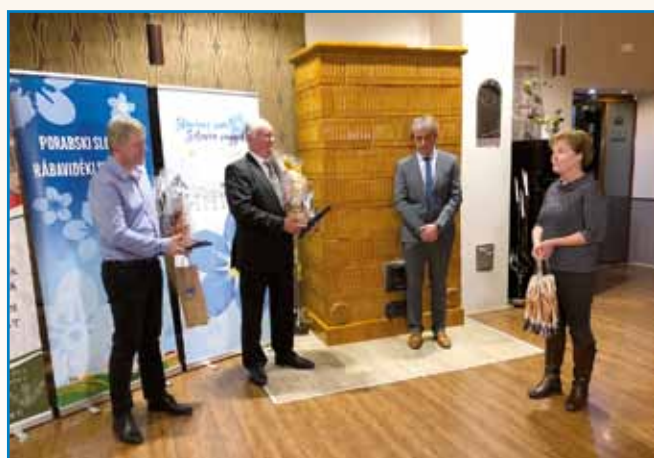
NAGRADI ZA SLOVENCE NA MADŽARSKOM GÉZI DOMI IN JOŽEFI ILLÉSI stran 4

»TUKAJ SMO SE ZBRALI, DA BI TE ČAKALI...«