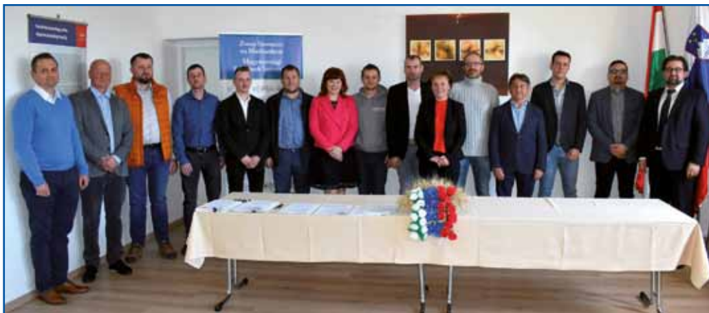
Slavnosti podpis pogodb o financiranju z upravičenci, ki so bili uspešni na 1. javnem razpisu programa spodbujanja gospodarske osnove avtohtone slovenske narodne skupnosti na madžarskem 2021–2021, 1. Ukrep - spodbujanja gospodarskih naložb mikro, malih in srednje velikih podjetij (msp), 21. Marca 2023

imamo vse več podjetnikov, večina jih dela kot samostojni podjetnik, imamo pa tudi kar nekaj podjetij, ki širijo proizvodnjo in zaposlujejo ljudi v Porabju. Postajajo vse bolj uspešni in prodorni.