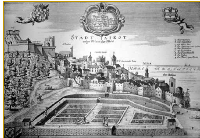
Tak je Trst velki Janez Vajkard Valvazor kaulak leta 1630 vido. V tom časi ga že Habsburška monarhija pod sebe dobila. Najviše na brgej svetoga Justa so grad napravili, v sterom so kapetani skrb za njega meli. Trst je stau pa stau lejt skur gnaki ostanu, prva ga je Valvazor namalo. Če malo ovak povejmo, Trst je več nej tak naprej valaun biu, nej se je dosta vōminiu.

Od toga smo že pisali, gda smo od Kopra pripovejdali. Po leti 1200 je Koper najbolje prejgen skrak gnešnjoga slovenskoga Primorja grato. S tejm je Trst svoj indašnji primat zgŕbo. Eške prva pa se neka drugo zgodilo. Evropo so na velke stari poganski Slavi naselili. Tak so po leti 580 tō doj do maurdja prišli. Nejsu nut v varaše mogli priti pa tak v Trst tō nej. Kaulak po krajini so si svoje vesnice napravili, v nji ostanoli. Vcejlak skrak Trsta ves Dolina stodji. Njeno mēnje nam vse povej. Vcejlak skrak eške ves Boljunec najdemo. Domanji lidge svojoj vesi v njivoj rejči Bolunc pravijo. Tō tau mēnje nam od tisti stari časaj, prvi Slavov v krajini pripovejda. V drugom tali rejči -unec srečamo. Tak so indasvejta vretini prajli. Leko, ka so »bolji« ali baukši unec, vretino najšli. Če