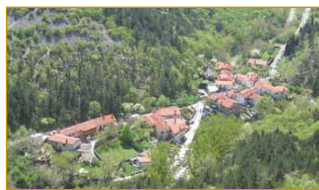
Po toj dugoj dolini Dolnje Glinščice ena skrak druge vesi Dolina pa Boljunec živeta. Za Muhovim gradom, steri je više doline stau, samo eške kŕp kamenja je ostanolo.

zozidati. Gvŕšno pa je skrb za lidi emo pa ka stoj doj po dolini ne bi nut v Trst vdaro. Kaulak te doline v sterov vesnici Dolina pa Boljunec stodjita eške vnauge druge stodjijo, stero nam od stari časov pripovejajo pa tō od toga, ka naši stari so njim mēnje dali: Log, Zabrežec, Kroglje, Brce, vesi Brdo pa Preserje pa več ne živeta. Kak bi prajli, skauzi čas sta preminauli.