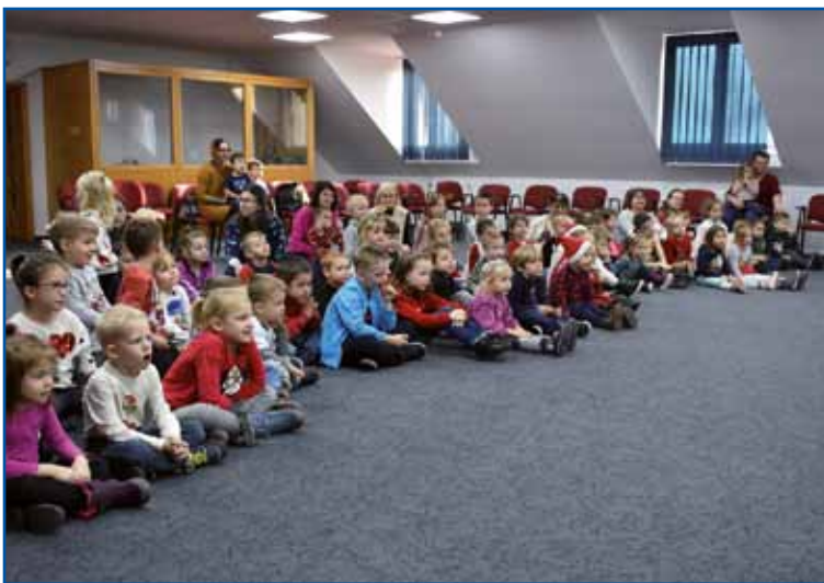
V konferenčni dvorani Slovenskega doma se je zbralo nekaj manj kot 50 otrok iz porabskih vrtcev.

je veliko glasbe, tako da lahko tudi tisti otroci, ki malo manj razumejo slovenski jezik, razumejo sam potek zgodbe