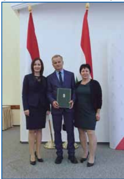
Od svojoga delovnega mesta (Gozdno gospodarstvo Železne županije) je daubo priznanje za svoje delo. Na kejpi z ženo in s hčerko.

»Zbojo sem se nej, depa tašo bilau, ka je cejli tovornjak tak našman stau, ka človek z rokav bi ga leko goraobrno, spoj malo falilo, ka bi se goraobrno. Gnauk je tašo tö bilau, ka vleti na prašnato paut je dež prišo, gda sem se pelo dola po brdjej, tak sem se čujsko kak če bi s sanami üšo. V gauš-