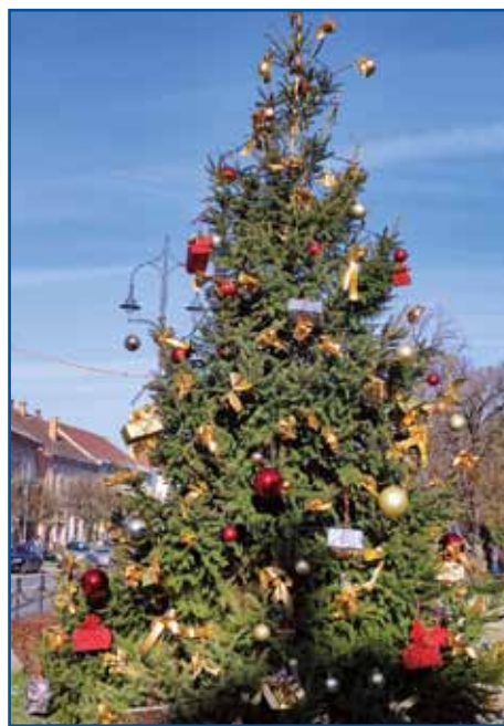
Na srejdi varaša stodji velki krispan.

Na advent, na Božič se v düši tö moramo pripraviti. Te je gé