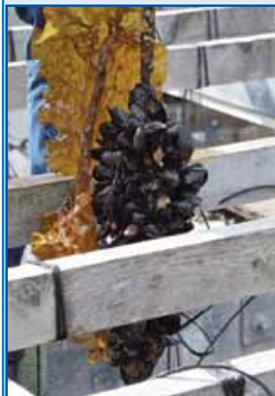
Dagnje ali klapavice tau leto iz slovenskoga maurdja lidam nikšnoga slüža nedo prinesle, orade so si z njimi črvau napunile. Investicije za njivo pauvanje pa so nej ranč male. Pa državi eške koncesije plačati trbej.

Gvüšno ka za najbole zapleteni sistem maurdje vala. Gda se maurd- je do kraja dojsvadi, žmetno de Zemla gnaka ostanola. Nauvi alarm je slovensko maurdje gorvužgalo. Zaprav, maurdje je od vsej lidi na svejti. Vö je prišlo, ka ribe v njem so vcejlak naure gratale. Kakšniva dva mejseca nazaj smo že od rib pisali, ka so iz toploga maurdja v Ja- dransko prišle. Ribe, stere v njem spoj nej bi smeje živeti. Na nauvo so maurdje pri dneje merili, temper- ature so zmerili. Tam nin na 25 mejterov bi kaulak 20 stopinj Cel- zija moglo biti. Tau leto so prej 24 stopinje vözmerili. Znauva alarmi na velke se vužigajo. Toga pa ribe ne čüjejo. Ena od nji je trno vese- la, ka takše se godi. Orada je riba, steri že dugo telko nej v maurdji bilau, kak v zadnji časaj se leko sreča, vözgrabi.