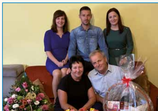
ČE MAM ZDRAVDJE, TE MAM VSE stran 8