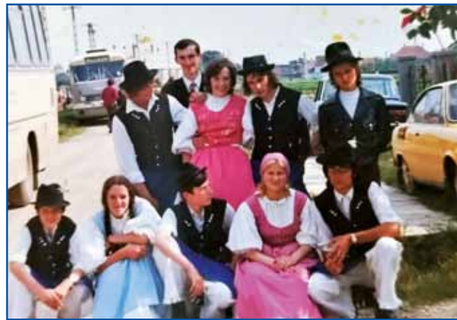
Laci (v zadnji vrsti prvi s prave) je duga lejta pleso v sakalovski folklori. Na kejpi sakalovski podje z beltinškimi deklinami.

»Vejš, ka cejla ves bi mala bila, če vse drva bi se dolasklala, ka sem dja vözvozo. Mi smo trdje bili, dja sem vozo, eden je z mašinom naklajo v gauštji, drügi pa prazno, eden den smo dvejstau kubikov vözvozili.«