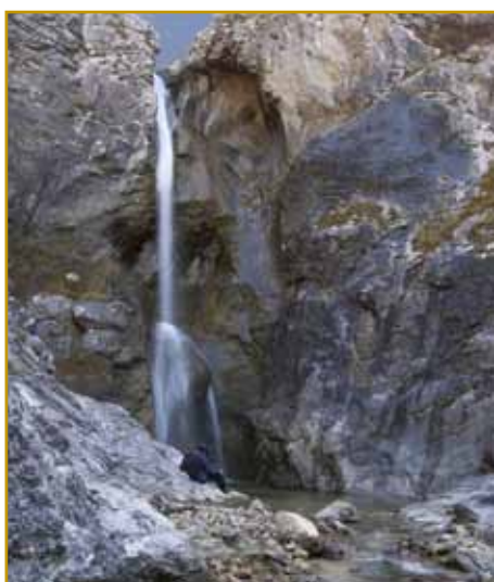
Glinščica slovenske vesi Dolina pa Boljunec napaja. Na tom mesti, kak se slap naredi, ranč iz Slovenije v Italijo priteče. Tevi dve vesi ste eni od vnaugi, stere so na talanskom kraji granice ostanole.

s časom pa se je tau vōminilo. Od toga nam tali ali becerki toga varaša pripovejajo: Korošci, Žavlje, Beloglav pa eške bi se kakšo mēnje najšlo. Gnes so se Milje že s Trstom »fkŕper zgrabile«, granice zmejs med enim pa drugim skur več nej