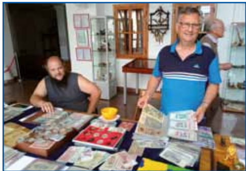
V Lendavi vsako leto večkrat organizirajo srečanja zbirateljev.

V Društvu zbirateljev Pomurja Lindva so člani zbiralci starin iz Prekmurja in Prlekije, nekaj pa jih je tudi iz sosednjih pokrajin Hrvaške in Madžarske. Društvo so ustanovili ljubitelji starih predmetov, ki so se družili na različnih mednarodnih srečanjih zbirateljev drugod po Sloveniji in v sosednjih državah. Kmalu po