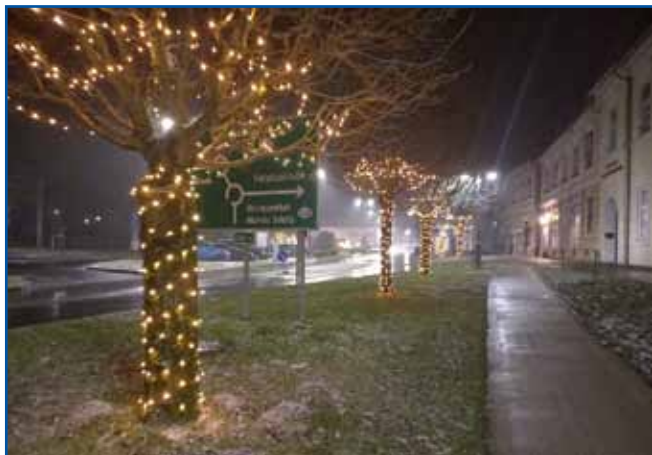
Monošter je v adventnom cajti lepau vöosvejtleni.

krispan prinesé Jezuš in kaši dar dobim na sveto nauč. Eške zdaj ne vem, kak so leko moji stariške krispan tak nut nesli v sobo, ka sem tau nigdar nej mogla videti, sem nej mogla nji zgrabiti. Oh, pa kak se tau čakala vsakšo leto, dapa se mi