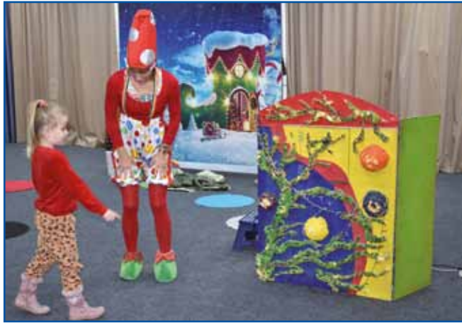
Predstava je bila interaktivna, v njo so vključili tudi nekaj izmed zbranih otrok.

Na koncu igre sta Malina skupaj z otroki glasno priklicala Miklavža, ki so mu nato malčki iz posameznih vrtcev zapeli in recitali pesmice, potem pa