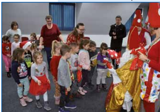
Miklavž je po praznični predstavi razdelil darila med otroke.