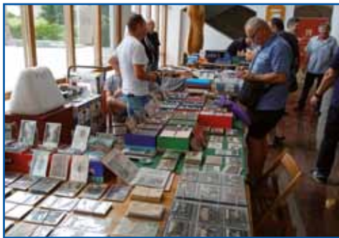
Člani imajo bogate in raznolike zbirke starih predmetov.

Veseli jih, da se vse več ljudi zaveda vrednosti teh zgodovinskih predmetov, dodaja Koren. Mnoge so pobrali z zaprašenih podstrešij in iz kleti, žal pa so jih ljudje v preteklosti ob selitvi v nove hiše zmetali stran. Zbirateljstvo v Pomurju je bilo v preteklosti v primerjavi z drugimi državami slabo razvito, zato so lastniki veliko starih