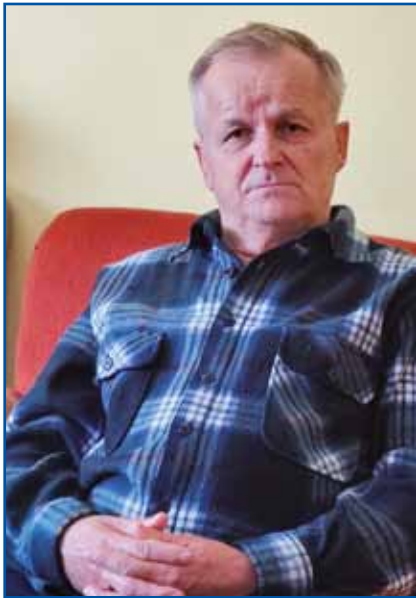
Paltjini Laci iz Sakalauvec

nej sem mogo tadale spati. Tašoga reda mi je večkrat na misli prišlo, gda sem vezno pa kaj tašo, ka je te bilau, gda sem delo. Zdaj že samo bola narejtja, zato ka nejmam časa