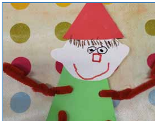
Škrat, ustvarjali otroci iz vrtca Sakalovci