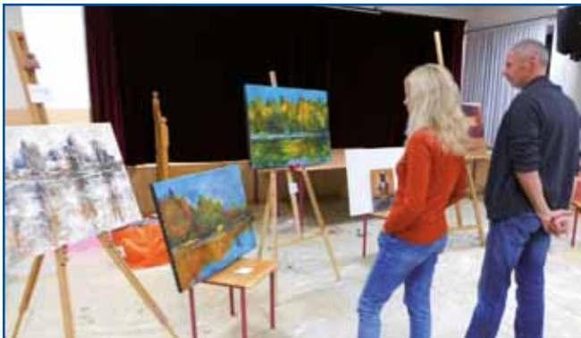
Ob koncu likovne kolonije so pripravili priložnostno razstavo