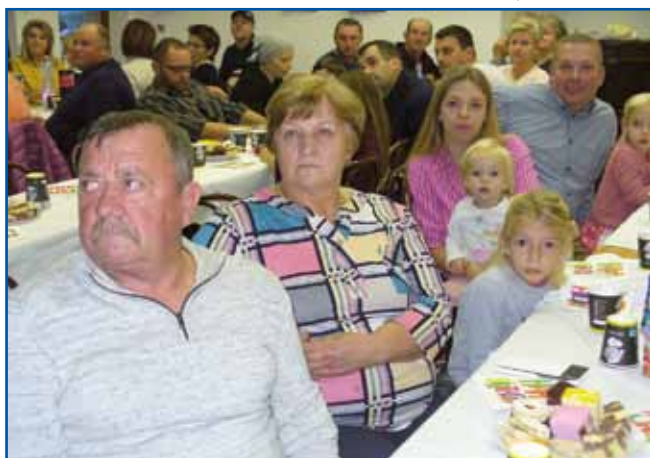
Del števanovska publike ob praznovanju 25. obletnice ustanovitve društva

civilne organizacije so prosvoljnost, družbena odgovornost in skrb za skupnost. Društvo ne more delovati brez aktivnih članov. Potrebno je, da za vsako pobudo stojita skupna želja in volja. Števanovci so bili pri tem