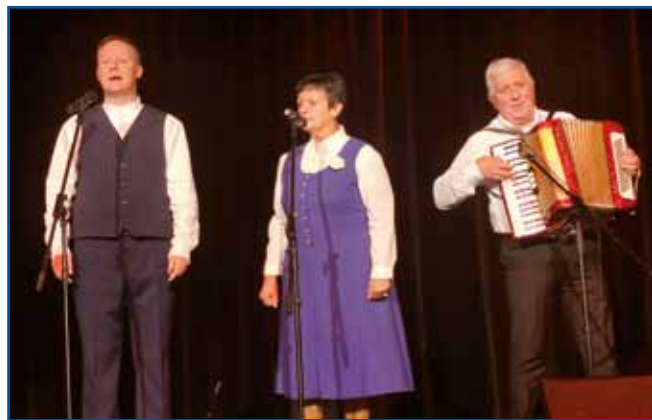
Na prireditvi je slovensko narodno skupnost zastopala skupina ZSM Porabski trio.