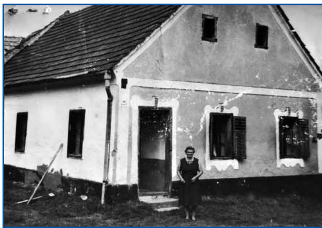
Anina mati pred starim ramom

»Kak praviš, depa mi smo se njim veselili, zato ka smo leko malo pripovejdali. Vejš, te je še tak bilau, ka