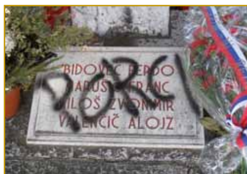
Na mesti smrti štiri junakov spomenik stodji. Depa, fašizem v Italiji eške itak živé. Nej samo gnauk so se na spomenik spravili, ga raznok zmlatili, po njem lagvo pisali. Na enoga so po talanski »porci« napisali, tau svinje znamenüje. Takše se je že 10-krat zgodilo.

je maurdje s cesarko metropolo vküperzvezala. Zavolo toga je ves bogata gratala, v krčmaj so foringaši geli, pili pa spali, za paut po poštiji so plačati mogli. Domanjim lidam pa nej trbelo daleč svoj pauv pelati, ka je po tejm na kaulaj »tadale šau«. Zvün vsega toga maurdje je tō nej daleč, vse njim je na rokau šlau. Gda pa eške bole nazaj poglednemo, se skrak enoga grma že skur drejve stavimo. Po slovenski se njemi bezeg pravi, bole po damanje ga kak beze-