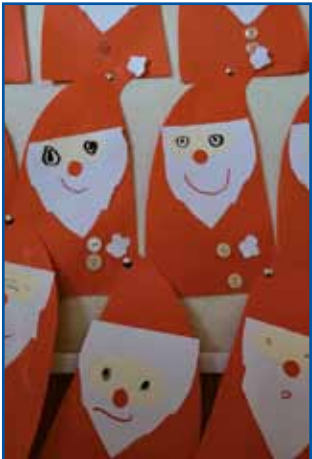
Miklavž, ustvarjali otroci iz vrtca Sakalovci