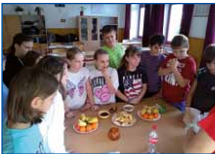
Sestavljali smo zdrave krožnike iz sadja, ki bi si ga morali privoščiti vsak dan.

Najprej so nam reševalci pokazali, kako moramo pomagati človeku, ki ne diha. Vadili smo oživiljanje, obvezovanje rok.