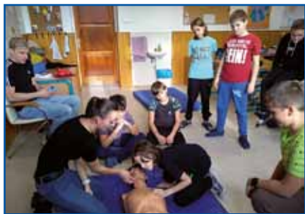
Vadili smo temeljne postopke oživaljanja.

Prvo uro so nam učitelji prinesli test in