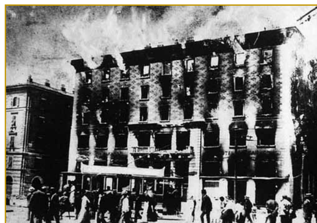
Po 16. lejtaj dela je Narodni dom v Trsti dojzgoro. Na té žalosten den 13. julija 1920 se je do konca pokazalo, ka se s toga narodi. Talanski fašisti so ga gorvužgali.

so eške bole mlajši od junakov iz Bazovice bili. Ji je pa ranč smrt štiri junakov vküper napelala, ka so začnili prauti fašistom delati. Pet mladi šaularov je svojo organizaciji tau ménje