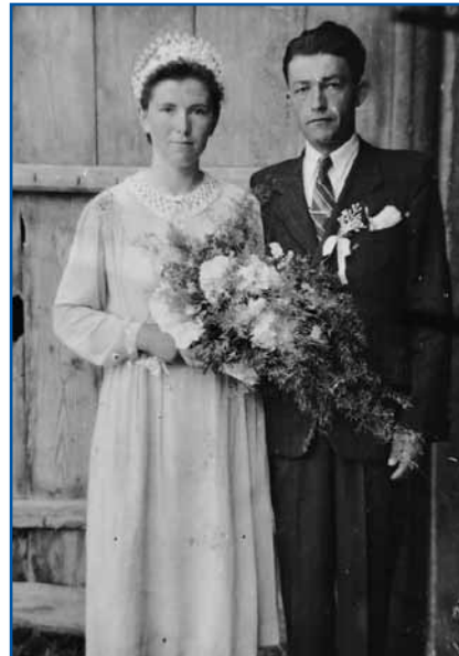
Zdavanjski kejp starišov

»Tašoga reda so mati mesau vö iz paca vzeli pa tejesto so nam stjøjali. Tau je