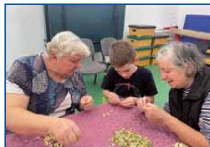
Mlajšom se je tau delo trno vidlo.

leko kaušto, mlajše smo tü ponidili. Pauradno goštjic je štje ostalo, tak ka na drugi den so penzionisti pa mogli vküper priditi in tadale löjpati v Monoštri v Lipi. Do večera so komar zgotovili. Mlajši so v Varašnej prišli, dapa njali smo jim pau lade goštjic v šauli, ka so na drugi den vöölöjpalj. Ta delavnica ostane v našom lejpom spomini in mislim, ka v mlajšinom spomini