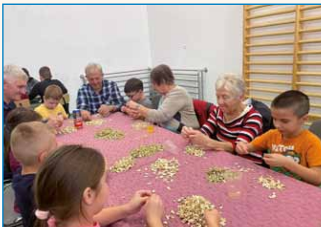
LŖJPANJE TIKVINI GOŠTJIC stran 6