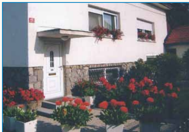
MEDENI ZAJTRK NA MONOŠTRSKI GIMNAZIJI stran 4