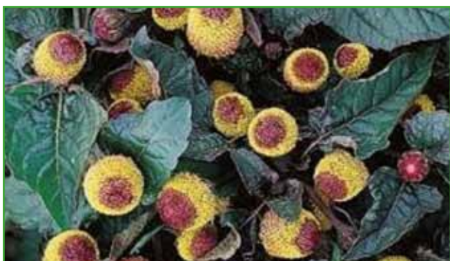
Spilantes (zobobolka) je prva pomoč pri zobobolu.

uporabo. Tudi vonj je tisti, ki lahko »obnavlja« spomin.