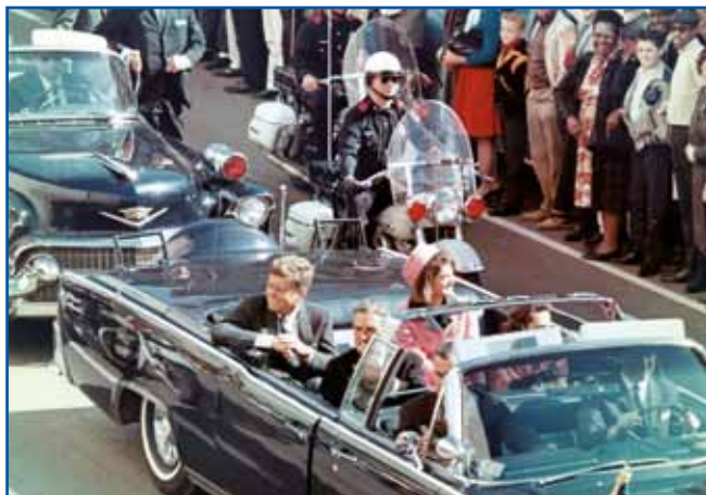
Merkanarski predsednik John Fitzgerald Kennedy se je z ženov Jacqueline 22. novembra 1963 v Dallasi vozo v oprejt limuzini, tak je grato léka tarča – za koga že...?

stalo sedemdeset policajov. Gostilničar je povödo, ka je tau napravo zavolo svoji simpatij do Kennedyna, včasik pa so začnile krauziti teorije zarote