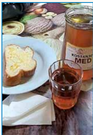
TRADICIONALNI SLOVENSKI ZAJTEK stran 3