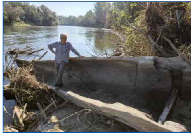
Čonakli iz 16. stoletja, steroga je najšo v Muri.

tudi ob nočnih dežurstvih po interneti isko, kak naj se k tomi deli spravi. »Tistoga cajta je nej ške bilau Youtuba, niti dosta kejpov nej, dosta je vse bilau napisano v angleškom pa nemškom geziki, tak ka sam se ške teva dva gezika te včiu. Tak eno dve leti je trpelo, ka sam si prave škeri kūpo in