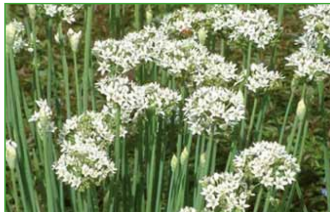
Čebula-drobnjak: vsi deli so užiteni, zato cvetove velikokrat uporabljamo za okrasitev jedi na krožniku.

velika doza nam lahko naredi več škode kot koristi. Je pa res,