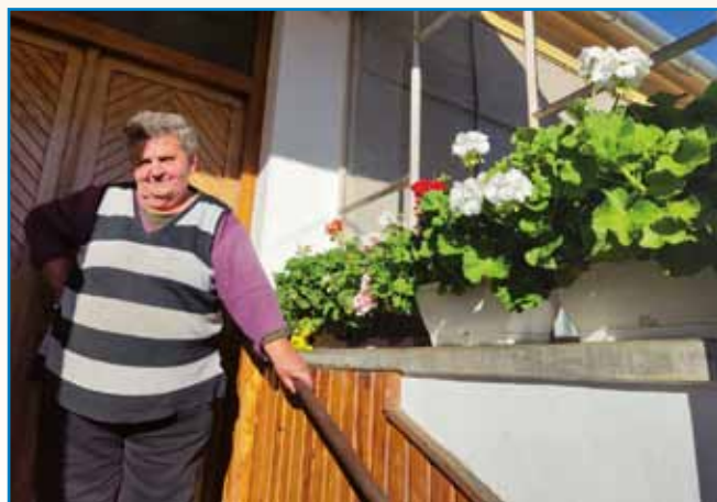
TE SO TAŠI ČASI BILI stran 8