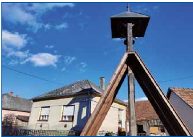
Pred njeno ižo v Máriaújfaluni stodji leseni zvonik.

cutjar, saloncutjar dobili, depa tau je nam sploj veliko bilau. Mi smo dougo časa vördjali v tejm, ka Jezuš nosi krispan. Gnauk je vrkar na brgej ranč kak je sveta nauč bila, edna