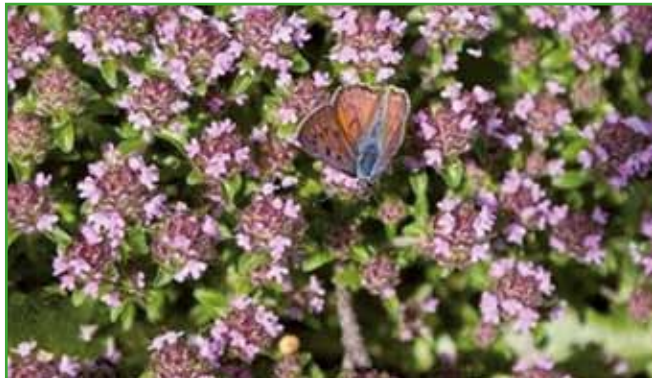
Materino dušico ali timijan srečamo tudi v skalnjakih in je primerna za okras suhega zidu.

pripeki rožmarin odcveti. Iz njega delajo eterična olja, pomaga pri bolečinah mišic in sklepov. Rožmarin nas s svoji-