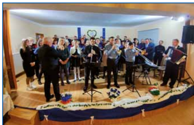
Program se je zaključō s skupno pesmijo. Vsi nastopajoči so zaspejvali porabsko varianto pesmi Preozke so stezice.