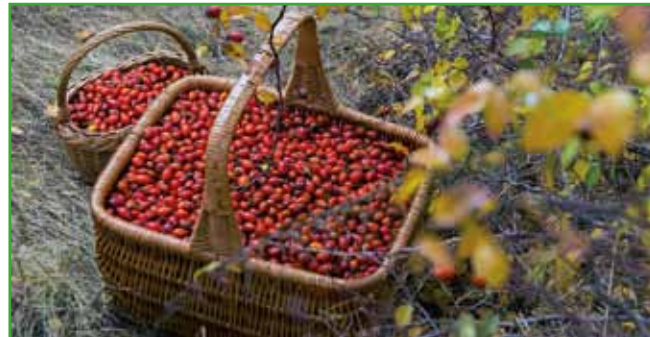
Šipek ali pasja gartroža pospešuje odvajanje vode. Vemo, da mora pasti prva slana in ga takrat pobiramo za sušenje, za čaj, ki pomaga pri vnetnih procesih ledvic, je pa odlična osvežitev pri vročinskih obolenjih.

z zdravnikom ali farmacevtom, kajti nepravilna in pre-