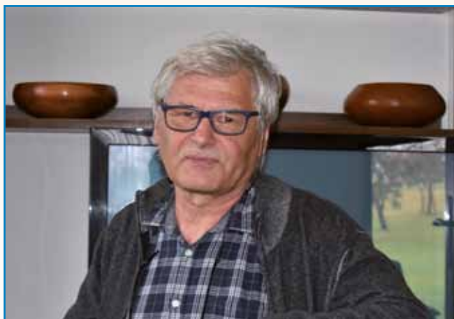
IZ ENOGA FALATA LESA REDI LEPE STVARI stran 4