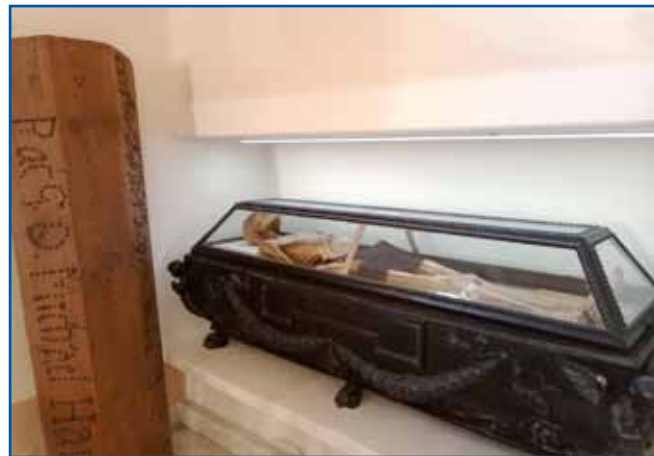
Mumificirano truplo Mihaela Hadika so odkrili v kriпти cerkve.