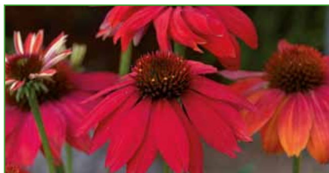
Ameriški slannik: Ime izhaja iz grške besede ecbinos, kar pomeni jež, na njegove bodice spominja osrednji stožec. Posušena socvetja so lep zimski okras.

da so naše babice že vedele, iz katerih rastlin se dajo narediti čaji, razni sirupi in likerji na preprost način.