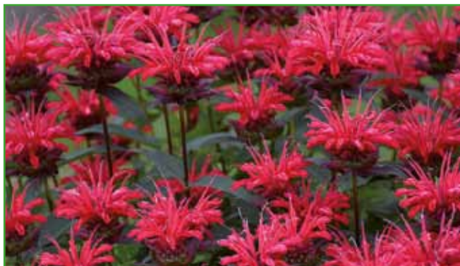
Monarda se odlikuje po dišečih cvetovih, živahnih barvah in aromatičnih listih. Privablja čebele in metulje. Aromatični listi so odlični za čaj.

mi dišavami vsakokrat, ko gremo mimo, spomni na njegovo