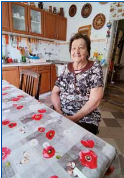
Tetica Margit so rade vaule pripovedjali o dugi djesenski pa zimski večerov.

pokojni ati je doma vsikdar emo dobro palinko. Bila je edna djablan, stera je takše djaboke mejla, ka so nej bile za djesti, depa takšo palinko so dale, ka v krajini nej bilau tak dobre. Tista djablan