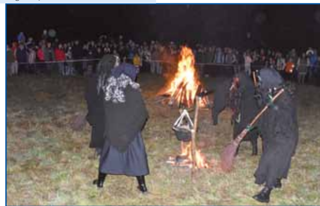
Inda svejta je porabsko lūstvo fejst vōrvalo v čaralice. Naši starci so gvūšni bili, ka comprnice na srejdj gaušče djilejše držijo, na šteraj čonte pa vsefelé grdstije kūjajo.

Letos smo sploj veliko srečo meli z vrejmenom, narava je idealna bila: megla, pun mesec, kak če bi naštolano meli – baukšo dekoracijo bi si ranč nej mogli vōzmisliti. Čaralice, vragauvge, smrt, skušnjava pod punim mesecom, više nje megla, od ozajek pa tisti strašen glas, od steroga smo dostakrat vse piškevi grata-