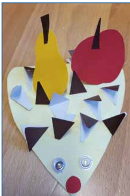
Ježek teka teka.