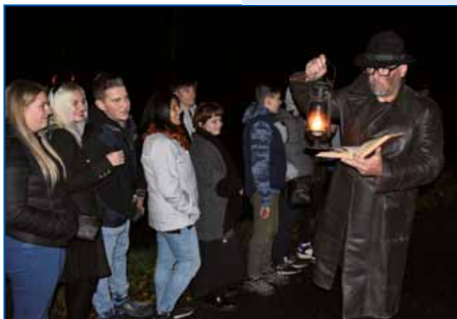
Črne šaule dijak se je telko v knjige zakopo, ka je svojo zdravo pamet zgūbo. Trbōlo ma je dati posanco mlejka, ovak bi na pauv točo prineso.

vnoči na tradicionalnoj Vrajžōj nauči v Andovcaj ojdli. Človek gnesden že samo malo