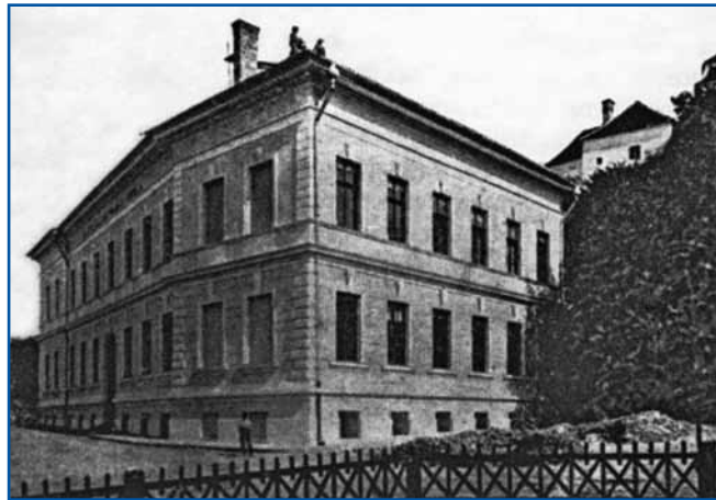
Zgradbo Meščanske šole so zgradili leta 1896 v starem mestnem jedru.