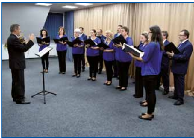
Mešani pevski zbor Avgust Pavel je bil ustanovljen leta 1938 na Gornjem Seniku. Najstarejša domača kulturna skupina poje priredbe porabskih ljudskih pesmi, zborovska dela slovenskih skladateljev in cerkveno liturgijo.

Monoštra, skoraj od ustanovitve pa jim pomagajo pevke in pevci iz Slovenije. »Zelo težko se dobi pevec v Porabju, še posebno mlad pevec.