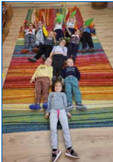
Oblikovali smo drevo.

Čas hitro beži in dodobra smo že zakorakali v novo šolsko leto. Slovensko skupino Zvezdice v Monoštru obiskuje 16 otrok, vrtec Sakalovci pa 23 otrok. Otroci v skupinah so stari od tri do šest let.