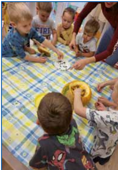
Izdelali smo bučo.

Telovadili smo tudi z jesenskimi listi in spoznavali jesenske barve: rumeno, oranžno, zeleno, rdečo in rjavo. Peli smo pes-