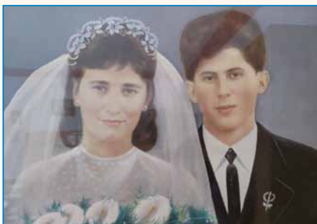
ČE LEKO PLEŠEM stran 8