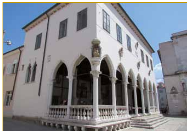
Na mesti te lože je stara loža že prva stala pa delala tó. Leta 1462 so začnili tau ložo delati, stero na fotografiji vidimo. Depa nej cejlo, samo spaudjen tal z arkadami so napravli. Tau je dojšlo. Čas pa s časom svoje prinesé. Leta 1698 so ložo za eno etažo zdignili, takšo go leko gnes vidimo.

(Kej na 1. strani: Pretorska palača zvekušoga od leta 1447 tak vögleda. Na tom mesti sta