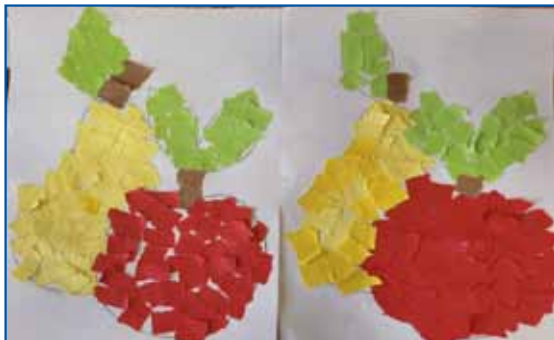
Jabolko in hruška, lepljenka.