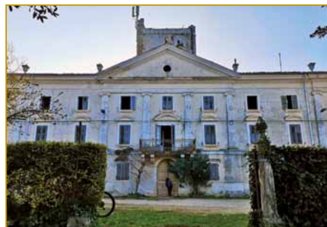
Držinska palača Grisoni v Kopri je sirotišnica gratala. V njej so daum siraute daubile. Tak je v svojom teštamenti grof zapovödo. Po drugoj veukoj bojni je v njej šaula bila, zdaj je restauréрана. V njej je gnes daum za prejk 65 lejt stare.

tiste najbolje naprej valon varaške velikaše. Uni so v loži »modrúvali«, prejdnji glavaške pa so njino volau mogli poslušati.