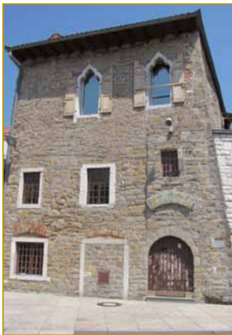
Perkausova iža za edno najbolje staro v Kopri valá. Pa nej samo te, zvekušoga se skauzi čas nej dosta vöminila. Se je pa menje vöminilo. Inda svejta so njej »Tribunal vecchio« prajli. Tumačimo ga leko kak staro sodišče, stara biroviija.

ra Grčija naprejprinesla pa go gnes poznamo. Demokracija v loži je za odebrane lúdi bila, za