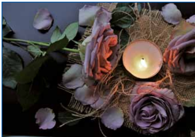
Vsisvecovo je svetek žaliivanja in spominanja. Zové pa nas na tau tö, ka malo poglednemo prejk svojoga končnoga zemelskoga življenja. Pomislimo na tau, ka nas pokojni najdražji čakajo na ednom dalečnjom, dobrom mesti, gde mo je srečali in bili vküper ž njimi na vöke.