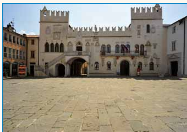
PRIPOVEJSTI O SLOVENSKI KRAJINAJ stran 9