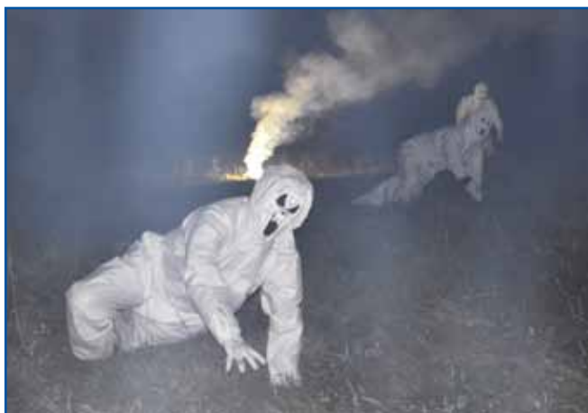
Skušnjave vnoči med spanjom davijo lūdi, sedejo se jim na prsi. V ižo pridejo prej klūčine lūknje, zatok je baukše, če je nutzateknemo.

ralice, smrt pa vsi drūgi njini padaške, steri lūstvo mantrajo.