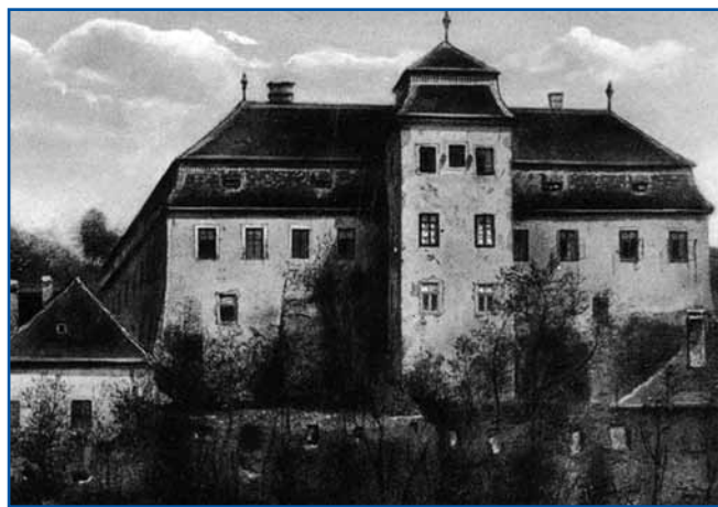
V 19. in 20. stoletju je bilo šolsko izobraževanje tudi na lendavskem gradu.

Dolnji Lendavi delovale rimskokatoliška, kasneje, od leta 1845, judovska in od leta 1908 še evangeličanska ljudska osnovna šola. Slednji sta delovali do leta 1919.«