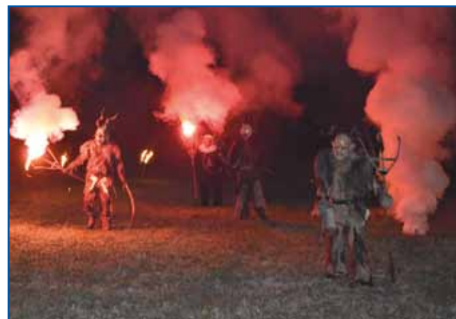
Letošnja Vrajžō nauč si je pá zaslužila ime - kauli 450 naučni pohodnikov so postrašivali vragauvge, žerdjavci, smrt in njini padaške.

nagnauk so se spucali, zato ka oni te že moči nejmajō, morajo se skriti. Če se vam prvim ne