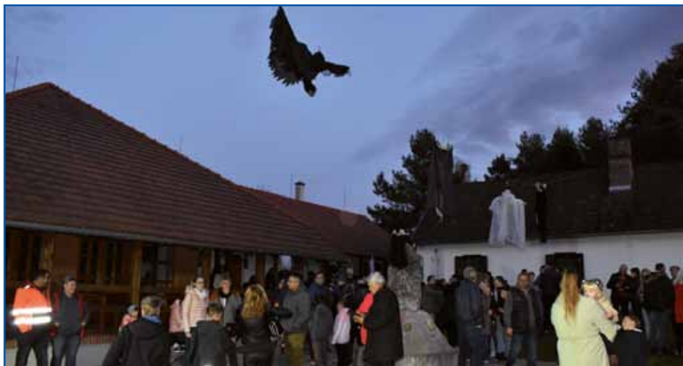
Lūstvo se je kauli Maloga Triglava zbéralo že od pēte vōre dale. Te so še nej mogli znati, ka je čaka v kmični andovski goščaj.

Leko, ka bi se še zdaj tam vrтели, depa kak so zaglednili, ka začne sveklau gratati, tak