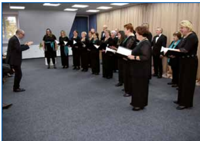
Mešani pevski zbor je v Divači začel delovati, ko so v tamkajšnji cerkvi leta 1894 postavili nove orgle. Skupina bogati kulturno dogajanje v domačem kraju in okolici, poje vse, kar je ušesu in srcu prijetnega.

Gornjeseniški mešani pevski zbor se intenzivno pripravlja na 85-letnico delovanja, ki jo bo zaznamoval v sredini novembra. Kot je poudaril zborovodja, bo zimski čas tisti pravi za pevce, ko bodo lahko spet vadili ves svoj re-