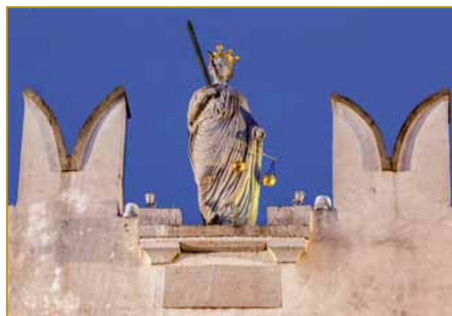
Pravica aj bi skrb mejla, ka se vse po pravici dela, nika se ne nori, se istina vö ne obrača. Takše se ne vidi samo v Kopri. Pravica je trnok poznana. Je pa istina, ka bi vekčrat s tistov sablov leko vsekla, gda ji tau vaga pokaže.

dvej menjšivi palači stali, kauli leta 1250 sta zozidani vi bili. Zgodovina Pretorske palače pa je dosta toga do-