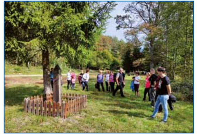
Poglednili smo si nekdešnji spomenik za najbolj zahodno točko Vogrske. Tau je valalo v tisti časaj, gda so turisti eške nej mogli titi na Gorenji Senik, ka je Senik biu v ozkom mejnom pasi.

Gda smo se proto vesi napautili, nej zaman, ka s planin veter fudo ranč prauto nas, že na okrajmi vesi je denilo kak se mesau peklo pri Etični hiši,