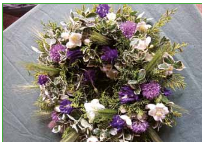
Beseda venec predstavlja zaokroženo celoto, predstavlja nam dekoracijo cvetja v življenjskem obdobju, ki se strne in zapre z odhodom.

tišine in nas prisili v premišljevanje o minljivosti. Rada se ustavim in preberem različna sporočila, namenjena umrlim, pa tudi nam. Še posebno ob