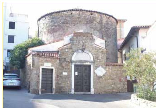
Rotunda je gnes med nauve rame nutstisnjena. Vidi se tau tó, ka k okrauglim stejnam so eške prezbitერიj z dverami kcuž zozidali. Tau so leta 1694 napravili. Tista stara rotunda pa je dosta, dosta starejša.

Že njeno ménje nam pripovejda, ka je okraugla. V njeni zidinaj je rejsan interesantna cerkvena zgodovina napisana, kak so se