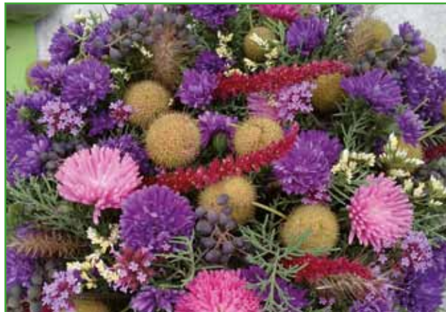
Sveži aranžma. Če le ne bo slane, si natrgajmo enoletne modre astre, malo kleka ali sive cedre, jesenske astre v roza in lila barvi ter malo plodov platane.