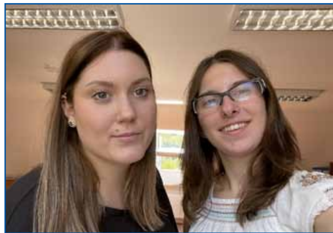
Skupaj se veseliva izzivov, ki nama jih bo prineslo delo z vašimi malčki v vrtcih. Meniva in upava, da lahko veliko prispevava vaši porabski skupnosti.

Moja izobraževalna pot se je začela na Osnovni šoli Kuzma. Že kot osnovnošolka sem rada obiskovala vrtec in se spoznavala z delom vzgojiteljev. Tako sem vzljubila poučevanje in nasmejane obraze otrok, ki hrepenijo po novih znanju, raziskovanju, odkrivanju in razigranosti. Odločila sem se nadaljevati šolanje v