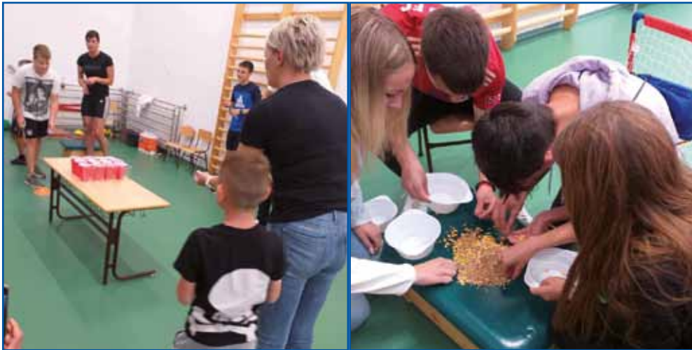
Udeleženci športnega dneva so se morali izkazati v raznih spretnostnih igrah.

Hvala vsem, ki so bili z nami na ta deževni dan. Hvala tudi za organizacijo vsem članom