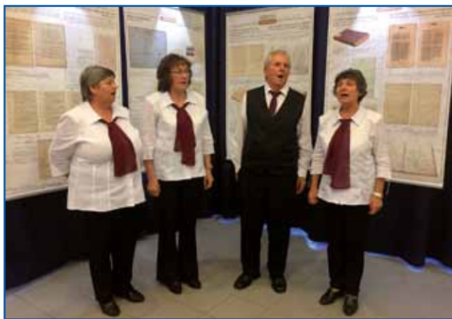
Štirje porabski ljudski pevci Veselega kvinteta so na odprtju razstave zapeli pred posterji z najdragocenejšimi zakladi slovenskih arhivov.

Dogodka sta se udeležila tudi voditelja osrednjih arhivskih