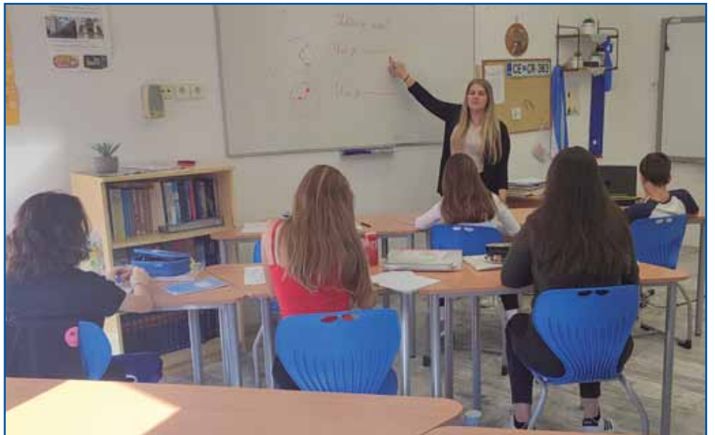
Pouk slovenskega jezika v 7. razredu

Kmalu boste torej končali šolanje na Pedagoški