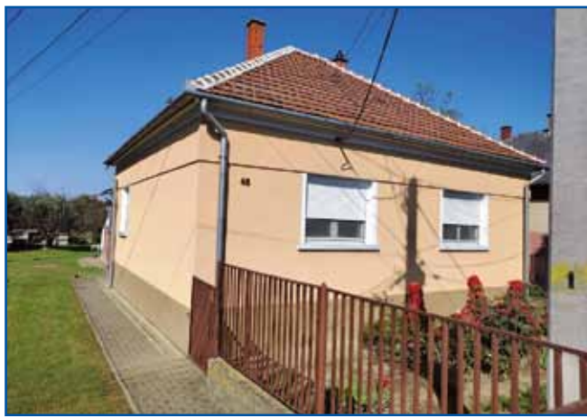
Iluška pa njeni mauž velki red mata kauli rama.

»Tau je bole takšo malo, rajo perdje bilau, velko nej, zato ka tisto bi pikalo v vanki-