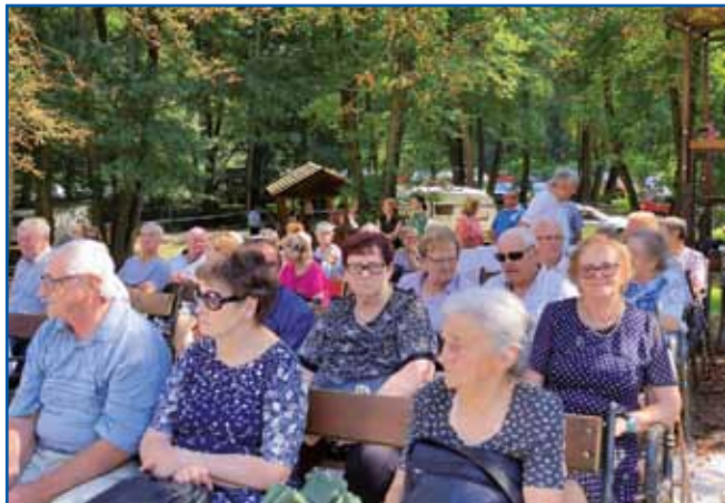
Slovenski penzionisti med vörniki

procesija, pri kateri je slovenski spejvo števanovski pevski zbor. Če rejsan je velka meša 15. augustuša, so te svetek svetili 20. augustuša, gda je