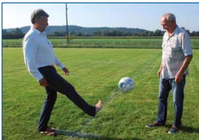
Župana sta pokazala, ka znata žonglerati z labdo.

žalost je letos mrau), po tiston, ka je Čiko fejst dobro pokrivo njegve napadalce. Jubilejna fotbalska tekma med šalovskimi in slovenskoveškimi fotbaleri naj bi bila drugo