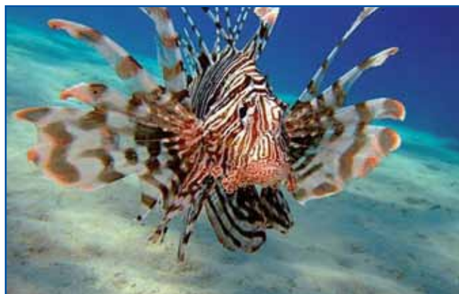
Plamenka (Pterios miles) v tropski maurdjaj žive. Kak povejdano, že se je v Jadransko maurdje preselila. Ta riba v svoji iglaj trno vražji čemer nosi. Njeni čemer vej živce vcejlak na nikoj djasti, človeki se zatoga volo srce dojtavi ali pa več ne more zdijavati.

Eno drugo nevalo je Jadransko maurdje naprej prineslo. Tam