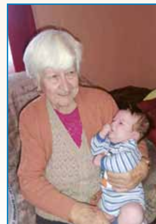
GDA JE ŽE DRŪGO NEJ POMAGALO stran 8