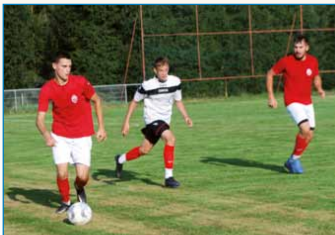
DOMANJA EKIPA JE GVINILA S 4:2 stran 4