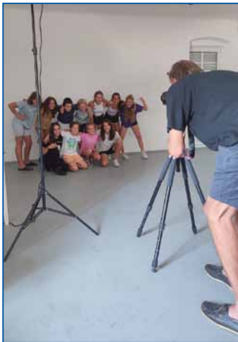
Otroci so uživali na fotografski delavnici.

Predzadnji dan smo imeli posebno delavnico, in sicer modni dizajn, kjer smo obarvali blago z japonsko tehniko. Po barvanju bla-