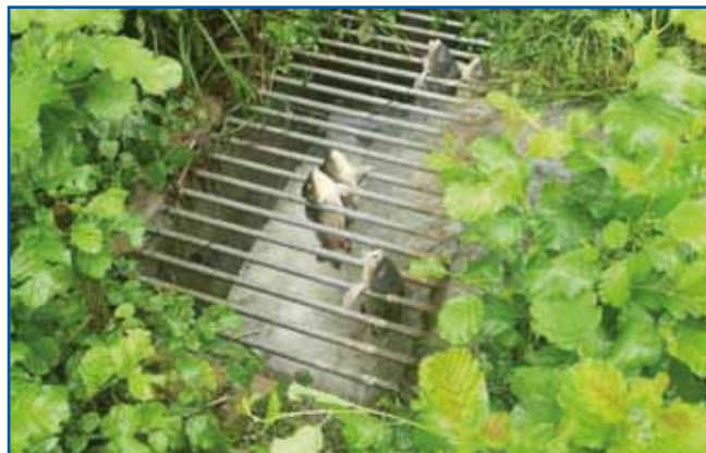
Takši fotografij z mrtvimi ribami je na gezero bilau napravljeni.

... so skrak vsej nevol po katastrofi z visko vodau eške ribe naprej prišle. Divdja voda, po sterij je velka povauden prišla, je ribe na velke voodnesla. Lidge iz ribiški držin so ji s košarami pa mrežami vsepovsedi - eške v garažaj - lovili, ka so je po tejm nazaj v vodau spūstili. Depa, kvar je nebesko velki. Pravijo, ka potokom pa rekam de od 5-10 lejt trbelo, ka cejli ribji fond nazaj normalen