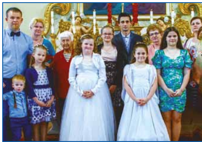
S svojov velkov držinov v senički cerkvi, gda sta dve pravnukejni meli prvo spauved.