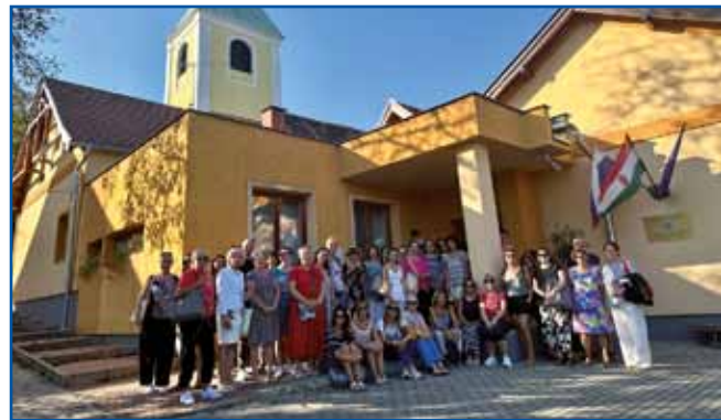
Udeleženci seminarja pred Dvojezično osnovno šolo Števanovci

Minuli teden je v Murski Soboti potekal poletni seminar, udeležilo se ga je 37 vzgojiteljev, učiteljev in profesorjev slovenskih šol v Italiji, ki so večinoma pripotovali s tržaškega območja, nekateri pa z goriškega in tudi iz Špetra v Benečiji. Zavod za šolstvo in ministrstvo za vzgojo in izobraževanje sta za udeležence seminarja v pokrajini med Muro in Rabo pripravila strokovno bogat program.