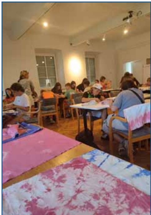
Udeleženci tabora so spoznali tudi tehniko batik.

V prvih dveh dneh so bili učenci razporejeni v štiri skupine in spoznali so digitalno grafiko in digitalno fotografijo. Naprej so se naučili, kako morajo fotografirati in na kaj morajo paziti pri fotografiranju. Dobili so nalogo, da v naravi poiščejo različne motive ter naredijo 10 fotografij, ki smo si jih ogledali po kosilu. Ob treh smo šli se kopat v jezero, kjer so se otroci zelo dobro zabavali. Po večerji smo imeli še možnost za šport, igrali smo odbojko, tenis, badminton in nogomet. Drugi dan so nadaljevali fotografiranje in