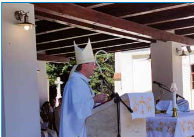
ROMANJE NA PUSZTACSATÁR stran 5