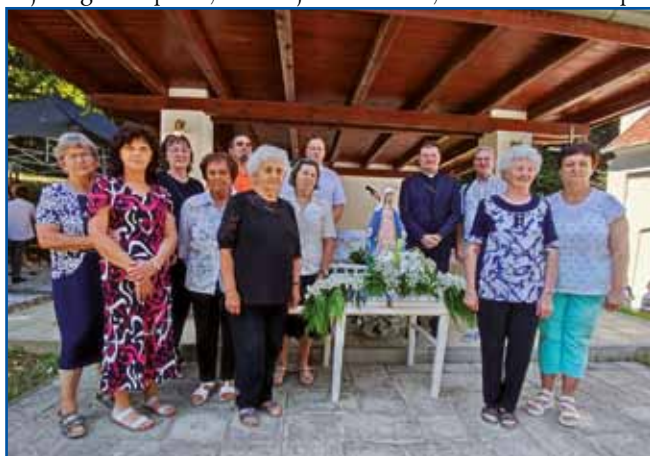
Pri meši je spejvo števanovski cerkveni pevski zbor tó.

bili, te se pa šika pejški titi do cerkve, če ranč tak dosta nej, kak naši starci. Gda smo táprišli k cerkvi v Puztacsatár, je že dosta romarov bilau tam. Letos so dosta stolic vösklali, vsakši leko dojsédo, nej trbelo na zemli sedeti. Na žalost smo nej mogli vküp biti, vsakši je