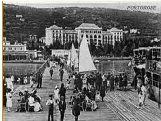
Palace hotel je prvim turistom leta 1911 dveri gor aupro. Té najveksi hotel daleč kaulakvrat v tistom časi je ranč tak zdravdje v solenom blatü reklamejro. Depa, ta hotel je za daleč najbolje bogate lidi valau. Gnes za tak malo romantičnoga vala, depa, pod seuw je vilo San Lorenzo pokopo, stera pa je tisto kapejlico na nikoj djala, po steroj je Portorož menje daubo.

Ovak pa na vreki turistične sezone vej po hotelaj pa drugi sobaj nagnauk do 100 000 turistov biti. Ve se, ka zavole