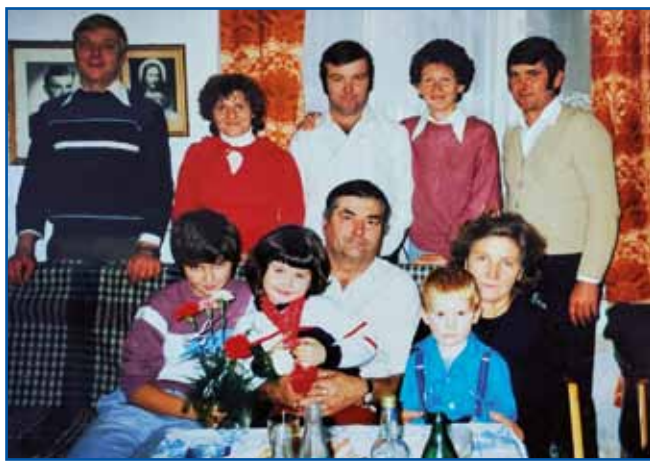
Mariška pa njeni mauž z mlajši pa vnūki

»Vsigdar smo domau prišli, zato ka skrak smo meli grünt, drugo pa tau bilau,