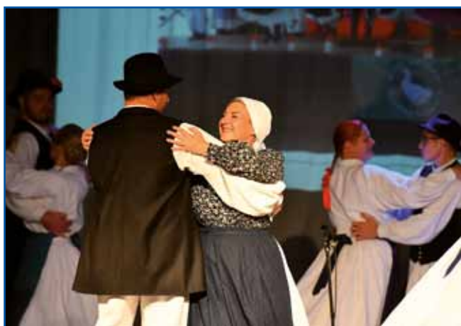
Gda je prišla nazaj v Böltince, je pa začnila plesati v folklorni skupini.

samo flajnsni šaularge, vej pa so par mejscov dosta falili pri pouki in so tau mejseca junijuša mogli notriprinesti. Tau so bili dijaki z vsej srednjih šaul iz soboške občine. Zanimivo je, ka je med njimi biu tüdi erični slovenski plesalec, koreograf in režiser Matjaž Farič,