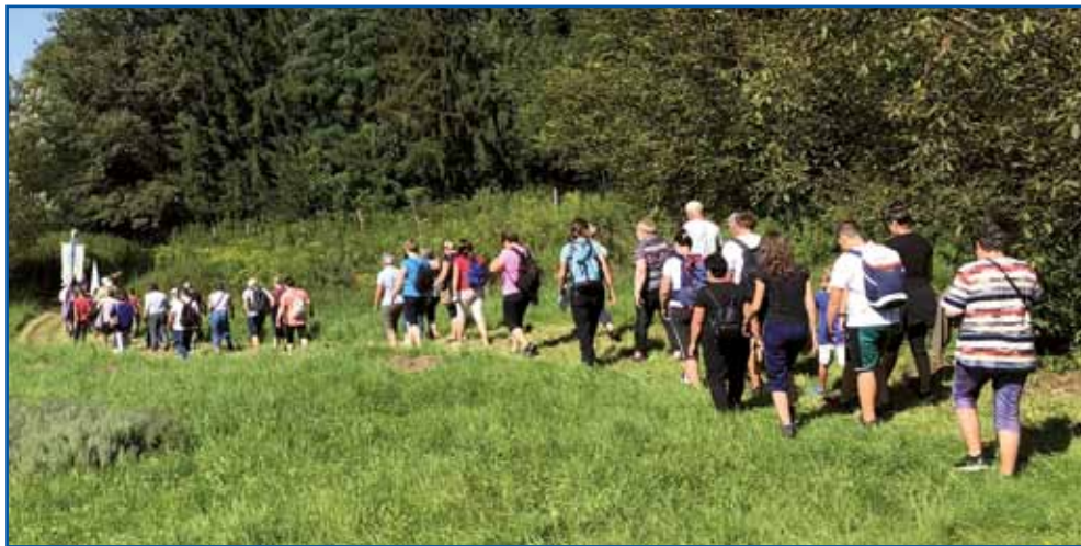
Duga kača božepautnikov se je dostakrat vlejkla po mezevaj pa lesaj, so pa po asfalti tō ojdli.