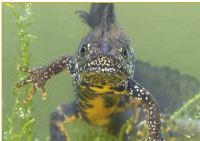
Ka povejete? Leko bi mladi zmaj biu ali pa nej? Samo eške ogenj aj začne plüvati pa bi leko biu.

Bekači vejo v redaj stati, s tejm krajina na eni mestaj vcejlak ovak vögleđa, kak bi vnoči de-