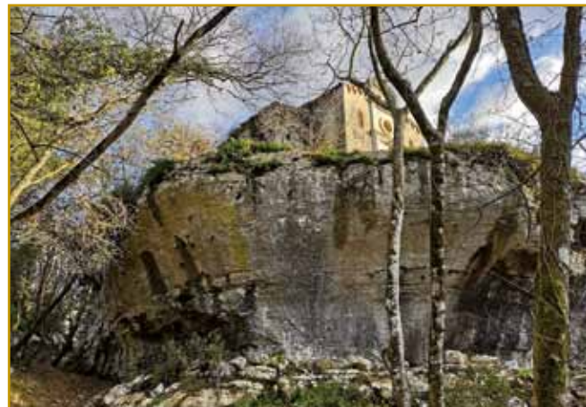
Mala cerkev sv. Petra že vcejlak na robej stodji. Brejg se pomalek vkiüperseda, sto vej, kak dugo eške cerkev na taum mesti ostane. Takše se usepovsedi v krajini leko vidi.

malo fotografiji poglednemo, neka povedali. Voda, stera skale pa kamne v zemlej dojpere, tau naredi, ka zemlina skaurdja se nut v sebe pogrozne. Takši procesi krajino rejsan za vcejlak ovakšo delajo. Najbau-