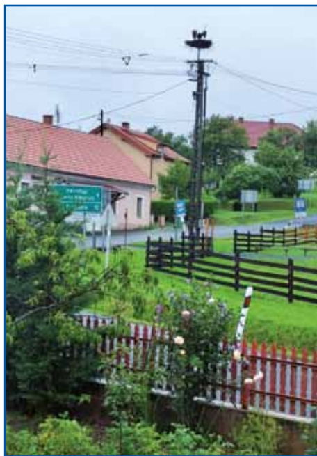
V gnezdi nejdaleč od Rōfcinoga rama sedijo tri male štoklje.

»Zvonili so pa tau je nika valalo, tašoga reda so zvaun vkriž mlatili pa največkrat se