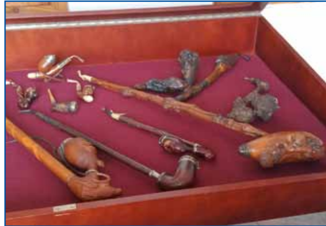
Razstavljene pipe so bile izdelane v prejšnjih stoletjih.

Pipe so se po zgodovinskih virih pojavile na območju današnje Slovenije v 17. stoletju, dodaja Koren, njihovo kajenje pa se je bolj razširilo v 18. stoletju, ko so jih v te kraje prina-