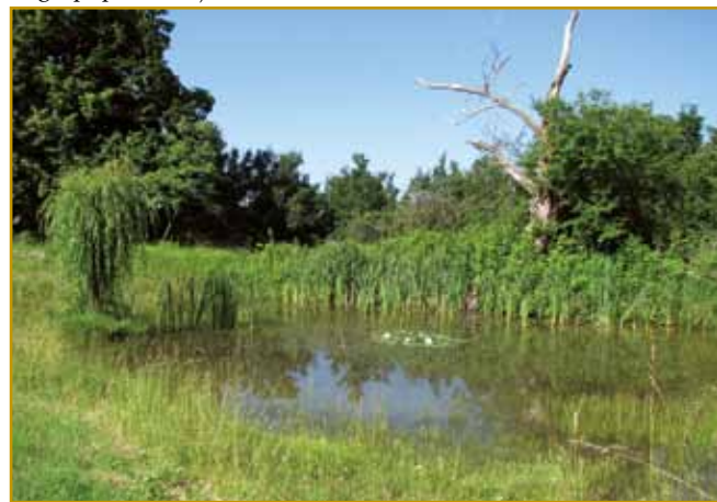
Kal ali puč, sterga na fotografiji vidimo, že dugo nej človekove roke vido, ka bi ga vredvzela. Tau se po tejm vidi, kelko bildja v njem raste. Kal je leko vcejlak sam od sebe grato, zvekšoga pa so ga lidge napravljali. Na dneje je prejk kamna ilovica mogla nut biti, ka je voda nej v zemlau odišla.

moni po robej travnikov plesali. Gnes iz pantovca v Istri košare skur več ne pletejo. Depa, lidge na vesi eške itak skrb za svoje bekače majo. Vsikšo leto