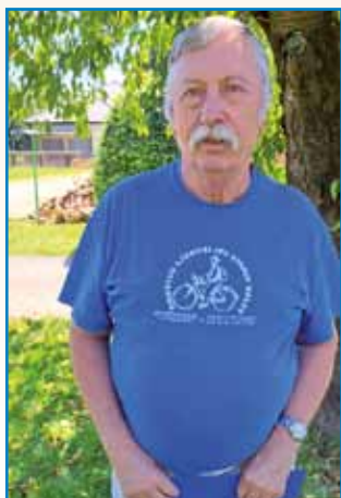
PO RITI JE DOSTAKRAT TUDI DAUBO stran 3