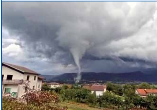
Tak se je tornado višje Ilirske Bistrice začno. Po tejm se je doj na zemlau spüsto pa s svojim lagvim delom začno. Po zraki je letelo vse, ka njemi je na pauit prišlo, v pau minuti je 15 nauvi ramov vcejlak na nikoj djau.

...se v Soboti vse vküper sinjava. Zaprav, nogometni klub Mura je nebesko lagvo v nauvi sezoni štarto. V prvom koli so doma že 2:0 baukši bili, depa, bič na konci pauči. Na tistom konci je 2:3 Mura zgibila. V drugom koli so v Celje odišli brsat se. Tam štirge indašnji podje od Mure si zdaj z brsanjom pejneze služijo. Štirge, steri so v najbalkšoj sezoni eške pri Muri brsali, gda je prva bila. V Celji je do katastrofe prišlo. Zbili, rejsan, 5:0 so je zbili. V Soboti