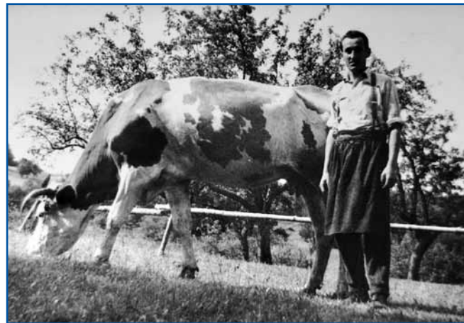
Na starom kejpi Arankin mauž, Rōfcin Jenek, gda so doma eške gazdūvali.

oni so tašoga reda devetkrat molili Zdrava bojdi Marijo. Vnoči smo vsigdar gorastanili, gora smo se naravnali pa te tak smo Boga molili dočas, ka oblak nej odišo. Tau je zato bilau, ka če je kakšna nevola, te aj leko letimo vō iz rama. Dja zdaj, ka sem sama, gda vnoči grmi, se