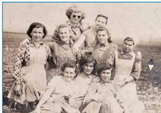
ČE BI ELIAŠ ZNAU ZA SVOJ DEN stran 8