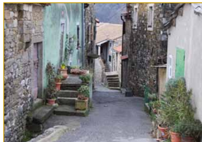
V Krkavčaj mrtvi rami skrak živi stojijo. Tau se po tejm tō leko vidi, ka so fasade gor na kamen napravli. S tejm veliko škodo stari arhitekturi delajo. V Istri so kamen nigdar nej v kakšo farbo nutzravnali.

je nej vüpo dati dojpodrejtj. Stra je velki majster, se eške gnesden tomi pravi. Lidge radi na tau mesto puno mis-