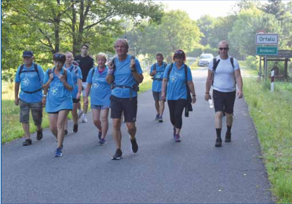
Začetek pauti pri Andovcaj

tistom ške dva dni kelko telko dobro vreme bilau. Preminauči torek pa je tak lagvo vreme bilau v Sloveniji, ka so si romari rajši doma v Porabji cejlili rane (sploj Valika Časar je velke žüle dobile) in počivali. V sredo zranksoma jih je okauli Cel-