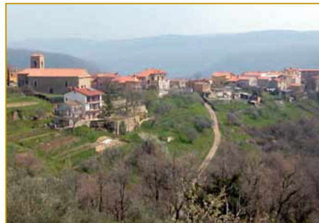
Tak Koštabona gnes vögleda, gda so že vküpersünjene rame lidge iz »kontinenta« dojküpili. Tau se po tejm tō leko vidi, ka ciglene (črepnje) streje majo. Starim ramom v Istri pa v Koštaboni ranč tak so streje s ploščami iz kamna pokrivali. Na pravom kraji se lepau leko vidi, kak če bi se skrak vesi zemla dojttrgnola. Tam spodkar skrak reke Dragonje so lidge indasvejta svoje njive pa paula meli. Tisti tradicionalni pavrov gnesden več skurok nega.

tau pogansko mauč dojsta-vo. Vejmo, arhangel Mihael za najbolje prejgnjoga bože sodačije vala. Cerkev je melhir za vrajži kamen dala vözglasiti. Depa, niške ga