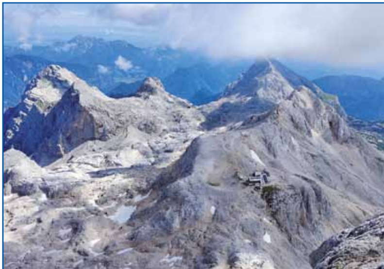
Pogled z vreaka na Triglavski dom na Kredarici

oni so tö nej zdaj začnili, cejlo Slovenijo so že zopodli, od Novega mesta do Kranja, vse. Gde mo spali med potjauw, so pitali. V hosteli, v apartmajy,