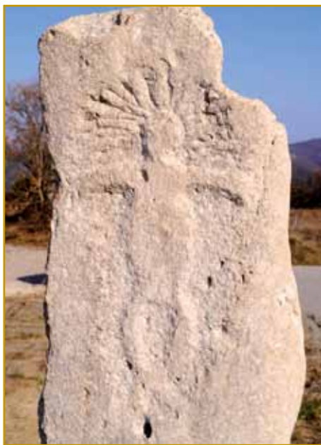
Domanji tomi melhirji bejli kamen pravijo. Dva pa pau mejtra visiko sega, eden mejter v zemlau je zakopani. Na obej krajaj je relief nutusejkani.