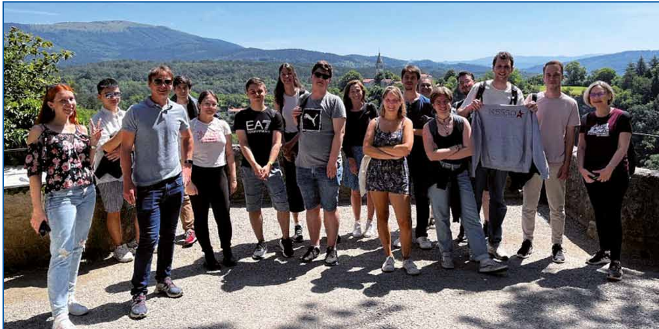
Na izletu s skupino seminaristov