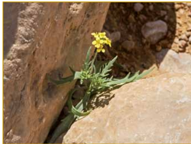
Divdja rukola kak kakšo pleve na takši mestaj tö raste. Gda cvete, se najbole leko vidi, stera je tista najbalkška. Pauvana rukola bejle cvejte ma. Kak šalata na olivnom olji, kcuj pa eške küjano djajce nam nauvo mauč za vandranje po Istri da.

vi pa nauvi recepti vöpridejo. Pri šparogaj nikak ovak se ne godi. Depa, v Istri de vsikši vedo povedati, ka balkškoga gestija kak fritaje ali tö frtalje nega pa je nede. Vcejlak praus- no gesti, za steroga samo djajca, šparoge, sau pa eške