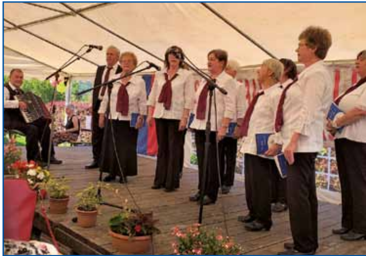
V Števanovcih je nastopil tudi Pevski zbor Rozmarin Društva porabskih slovenskih upokojencev.

V nedeljo, 16. julija, je bil vroč poletni dan, v Porabju pa sta potekala kar dva vaška dneva. V Števanovcih in tudi v Sakalovcih tradicionalno organizirajo vaški dan v sredini julija. To je dobra priložnost, da se vaščani zberejo in skupaj preživijo prijeten dan, ki jim omogoča duhovno in telesno sprostitve, zabavo, igre in še mar-