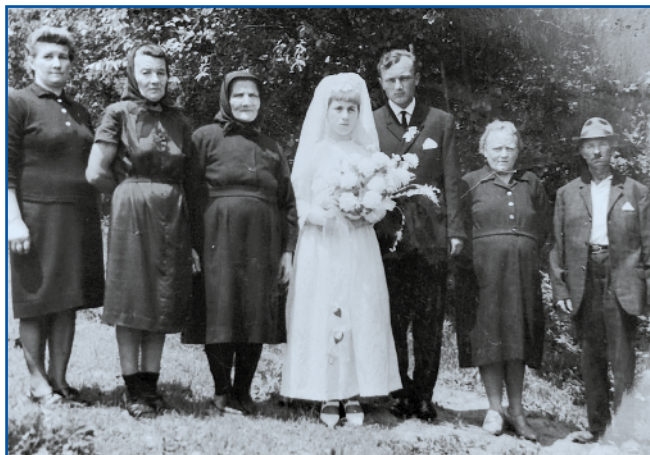
Njeni zdavanjski kejp z Gorenjoga Senika

»Zato ka moja mama je mlado mrla pa name je sta-