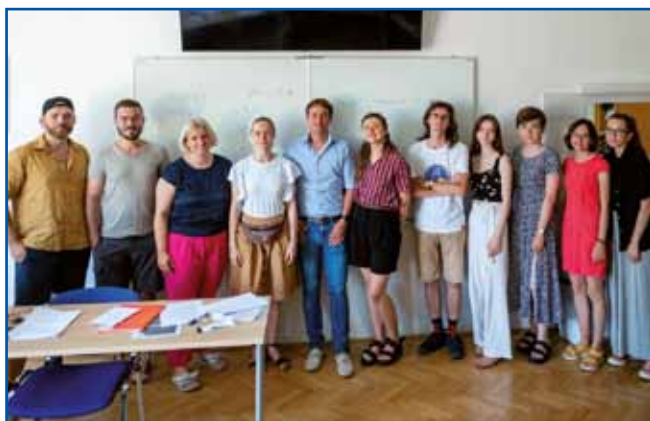
V izpopolnjevalni skupini nas je bilo deset iz različnih držav. Profesorica je tretja z leve.

tolog zgodovinar in novinar, ki nas je seznanil o aktualnih političnih in gospodarskih