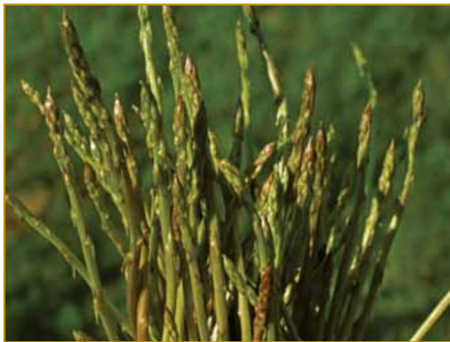
Divdje šparoge v mejseci aprili pa skur do konca mejseca maja rastejo. Gvüšno, ka nej na gredaj ali paulaj. V Istri je že od inda na robej gaušk berejo. Balkše, ka ji ne pitate, steri so balkški. So balkški divdji ali pripauvani, se ne spitava, ovak se leko steri brž graubo dojsvadi.

Istri dva sada rasteta, steriva cejli svejt pozna. Oba so prva samo za domanje pisker gor- brali pa vökopali, gnes, zvün toga, eške za nej ranč male pejnze tau odavajo.