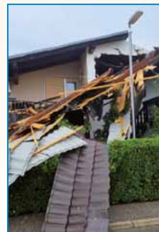
SAUDNI DEN V MURSKI SOBOTI stran 10