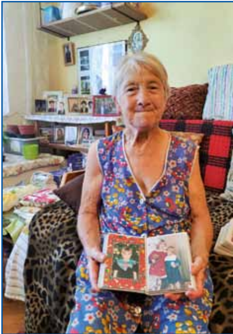
Vnüčkina Ančika se je narodila na Gorenjom Seniki, zdaj žive v Varaši.

Tašoga reda, gda je fejest vraučé kak zdaj, lüstvo se dosta mantra, najbola tisti, steri vanej na sonci morajo delati. Prvin so ranč tak na sonci delali, vejn še več kak gnesden, depa kak pravi-jo, tisto sonce je drügo bilau kak tau, tau dosta bola peče. Gda je vraučé, vsikši se tak hladi pa si pomaga kak more, kak nje-ma paša. Tau je gnesden dosta bola naletja, zato ka mamó hla-dilnik, s klimov si pa leko daum hladimo. Kak so leko brezi tauga prvin delali pa