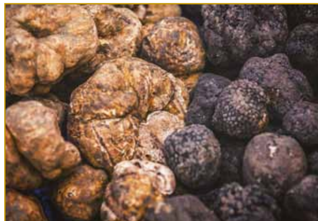
Na fotografiji leko bejle pa črne tartufe vidimo. Kak pri grbanjaj se gnako godi, mali kak orej ali pa skur kak menjša tikev zrastejo. Po gramaj se vagajo, tak se tö vözračuna, za kelko ga stoj leko oda. Depa, tau je nauvi čas prineso, inda so ga lidge v Istri za sebe nabejrali, ka njim je prausno gesti bole žmano bilau. Gnes ga zveškoga na Talansko prejkpelajo, tam lejpe pejnze leko prislüžijo.

poznajo, najbolje zavolo pice, na stero jo gor dejvajo. Depa, tau je že tista rukola, stero pauvajo. V Istri po travnikaj, skrak stari potaj pa na robej zidin divdja rukola raste. Eške