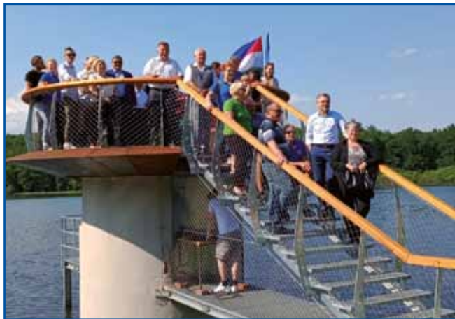
Razgledni stolp bo popestril turistično ponudbo ob jezeru.

Razgledno opazovalno ploščad, s katere je lep razgled po jezeru in okolici, so postavili na strehi vodnega stolpa. Na občini so prepričani, da bo stolp še popestril turistično ponudbo na eni najbolj obiskanih turističnih točk v pokrajini ob Muri. Na njem načrtujejo