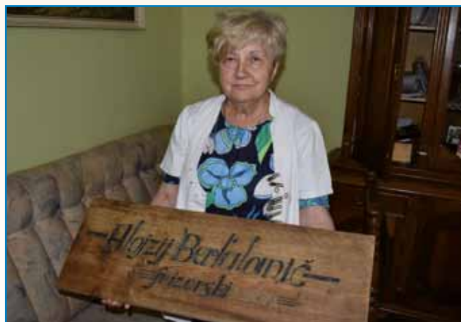
NAJSTAREJŠA OBRTNICA V SLOVENIJI stran 3