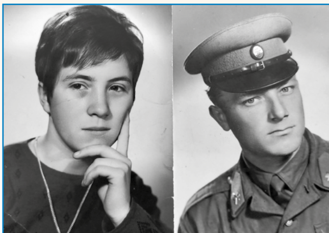
VRETINSKA VODA stran 8