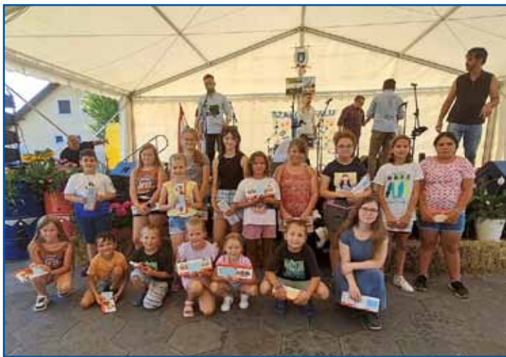
Sakalovska občina je v okviru programa vaškega dneva obdarila odličnjake za uspešno spričevalo.

pa je izvedla tamburaška skupina Kopri-ve iz Petrovega Sela, to je hrvaška vas na