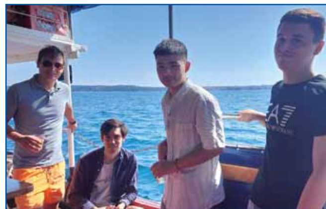
Tudi na Jadranu smo se imeli lepo.

njene kulture. Lektorske vaje so bila od 9.00 do 12.30, od 14.00 do 15.30 so sledila predavanja. Seminar je odlikoval bogat spremljevalni program. Potekali so glasbeni dogodki, vodeni ogledi Ljubljane in razstave v Cukrarni, ogled slovenskega filma, udeležili smo se celodnevne ekskurzije v Škocjanske jame, Portorož in Izolo, obiskali pa smo tudi Celje. Na prvem dnevu seminarja smo po pozdravnih nagovorih začeli delati. Bil sem v izpo-