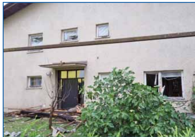
Sausedna streja se je znajšla na dvauri.

Gda smo si poglednoli škodo pa prišli vö iz prvoga šoka, smo začnili pucati okauli kuč. Sausedje smo vküper staupili pa šli od kuče do kuče pomagat. Največ vsega pa je bilau gli na