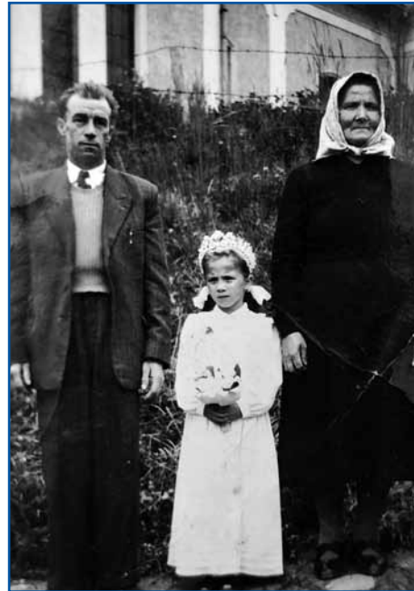
Ančiko sta gorazranila baba pa dejdek, na kejpi pri prvoj spauvedu.

- Gda je vraučé bilau pa ste kama delat šli, te ste z dau-ma nejsli za pit vodau?