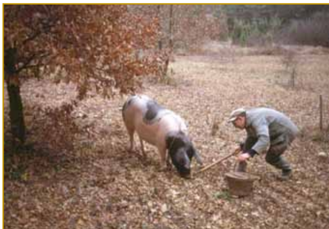
Indasvejta je samo ta stvar tartufe človeki leko najšla. Nisterni eške gnesden se te tradicije držijo, zveškoga dobro trenejrani pes je že nin na 100 mejterov prdene. Gvüšno je tau tö, ka dosta tartufov divdje svinje vöskopajo pa pogejo. Tartufi so najprva gesti za prausne lidi bili, že prej 200 lejt pa za delikateso valajo. Steri je najde, dosta pejnze leko prislüži.

Kak že povejdano, več je samo za sebe ne berejo. Na velke je v tiste krajine odavajo, v steri ne rastejo. Kak pri gobaj šega gé, tö šparogari svoja mesta majo. Vejmo, ka vsikši den nau-