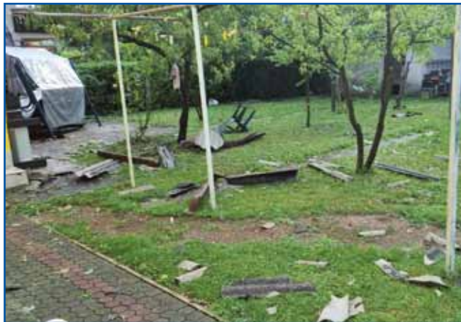
Víher je napravo dosti škode.

ni sobi pa mlako vode srejši nje, za štero šče gnesden ne vem, od kec se je vzela. Gda sam vidla, ka vekše škode nega, sam odišla nazaj doj k našim. Te pa samo naidnauk pride oča od vöni pa pravi cejli blejši: