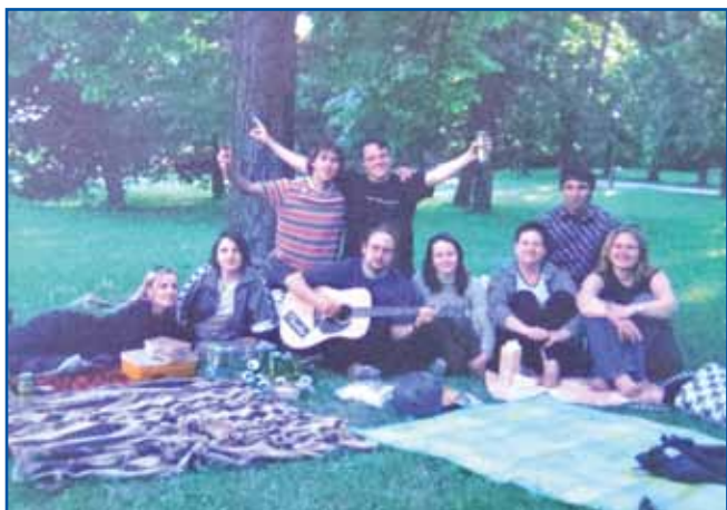
S prijatelji v času študija v ljubljanskem Tivoliju

nadgradnjo naše spletne strani, tako da bi na njej objavljali tudi aktualne vsebine. Najbrž bi bilo treba kakšno stran nare-