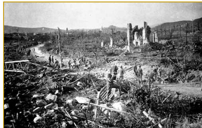
Tak je eden tau Tolmina po konci bitja vögledo. Zaprav, sploj je nika nej vögledo. Prejk dvajsti lejt je trbelo, ka so Tolmin nazaj gorpostavili

vörvanji škeli pokloniti. Zato ga volo je iz sausadnoga varaša Čedad sodačija nutvdarila, njive stare simbole pa sveta mesta so njim vničili. Leko povejmo, ka za cejlo velko ink-