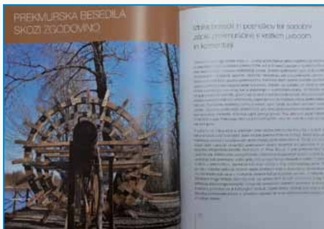
Pomagati prekmurščini, da bi postala še bolj aktivno govoreča stran 6