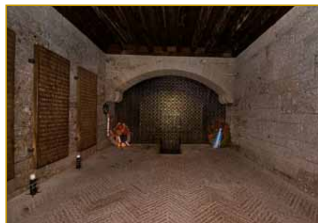
Na Javorci skrak Tolmina nemška kostnica stodji (kost-čunta). V njoj čunte 956 nemški sodakov počivajo. Gnes takši spomin skrak Soče na velke živé, aj se takše več nigdar ne zgodi. Po nesterni računaj se za 300 gezero spadnjeni sodakov na fronti na Soči sploj ne vej, na sterom mesti se je njiva paut končala

Tolmin je stari varaš, un tö skrak Soče stodji. Depa, fronta na njoj ga je skur cejloga vničila. Od prve velke bojne na Soči