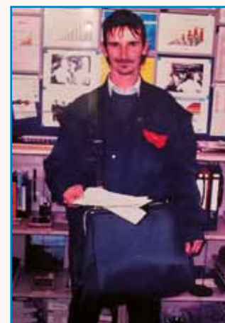
Drūdji den sem gorapravo stran 8