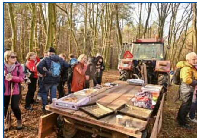
K bündinski karavli so organizatorge pripelali pokaraj na traktori

Ešče dobre pau vöre, najprva v porabskoj ridjajci po precej blatnom nekdešnjom mejnom pasi, potejm