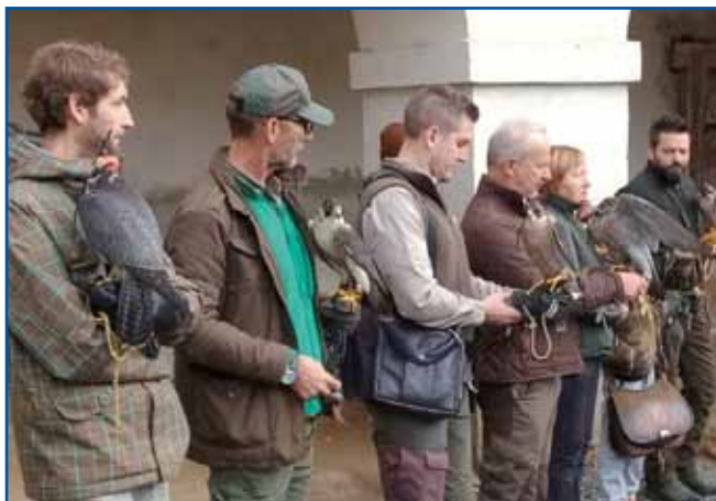
V Beltincih vsako leto organizirajo mednarodno srečanje sokolarjev

Društvo sokolarjev Pomurja povezuje lastnike in ljubitelje sokolov ter drugih ptic ujed s goj pa je ljubezen do ptic in sploh do narave,« pravi predsednik Društva sokolarjev