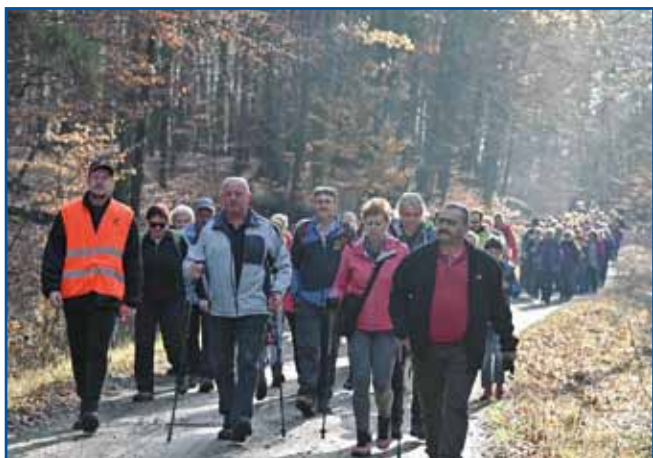
Kak duga kača se je vlejkla vrsta pohodnikov v bündinski gauški

se v tom leti ešče nej srečali, so si vauščili srečno nauvo leto, drugi so se pogučavali ali posladkali s pokarajom, steroga so spekle flajsne bündinske ženske. Pohodnike so čakali z vraučim čajom, sto je želo, si ga je leko malo razlado z domanjo palinko. Dapa ženske smo bole segale po domanji likeraj, steri so se ponüjali nejdaleč od nauve maskote, stera je pohodnike pozdravila ob prihodi. Gostoljubnost domanji organizatorov – Kulturno-umetniškoga društva Büdinci – so lejta, gda zaradi kovida pohoda nej bilau, nika nej pokvarila.