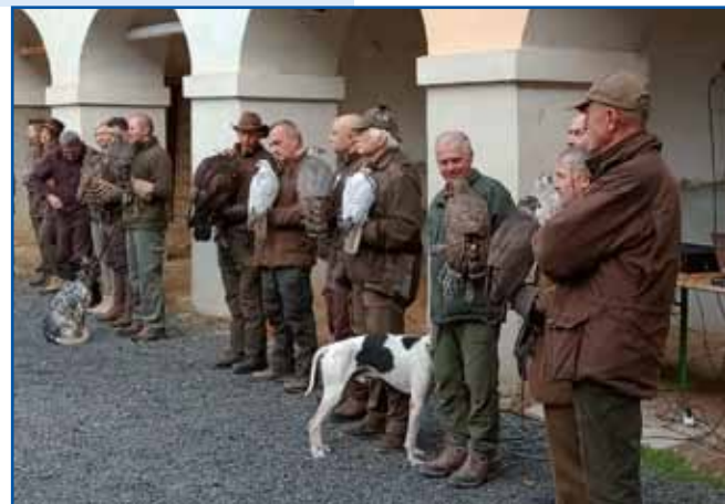
Udeleženci so iz Slovenije in sosednjih držav

»Vzgoja ptic ujed zahteva veliko truda in znanja, po-