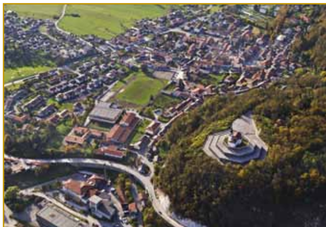
Kobarid se je inda samo na terasi više Soče »stiskavo«. Na brgej više varaša cerkev sv. Antona stodji, kaulak nje pa so v lejtaj po prvaj velkoj bojni graubišče napravili. V njem gnes 7014 čunt (okostje) poznani pa nepoznani talanski sodakov počiva

za sebe krajvzele. Nej samo Kobarid, dosta drugi vekši ali menjši varašov je vcejlak vničeni bilau.