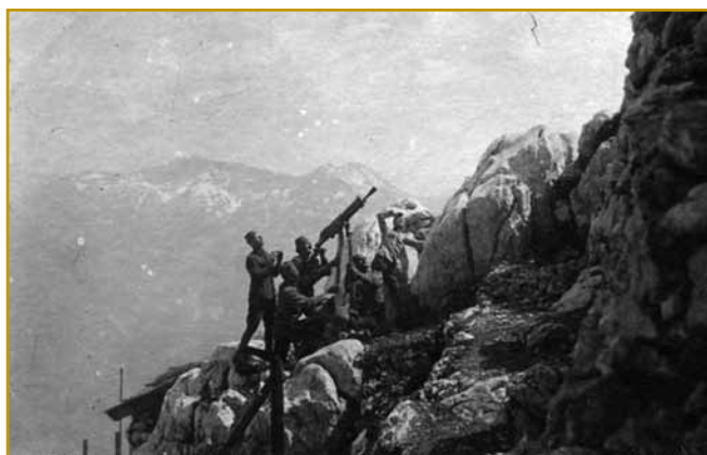
Tak talanski sodacke više Kobarida stražo držijo. Ranč tak je 24. oktobra 1917 tö bilau, gda se 12. bitje na fronti skrak Soče začne. Talani so tistoga dneva 400 000 sodakov pa 2200 štükov meli, napadnolo ji je 350 000 sodakov, steri so iz eške malo več štükov granate na nji strejlali

časa arheologi vöskopali. Po tejm je tadale šlau, kak smo že vseposedi v slovenski krajinaj vidli. Rimski imperij pa po njem so se v Kobarid tö stari poganski Slavi naselili. Depa, nindri so nej tak dugo svoje staro vörvanje meli, kak se je tau ranč v Kobaridi godilo. Nejsa se krščanskomi