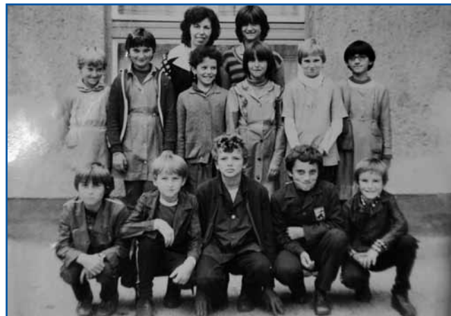
Šaularge števanovske šaule. Dinda pravi, ka je samo zatok rad v šaulo ojdo, ka je leko špilo nogomet pa rokomet

»Dja sem samo v Števanovci špilo nogomet, najprvin v mali ekipi od leta 1990 do 1992. Te sem rutjivo, gda sem