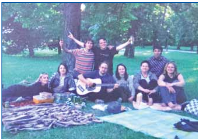
S prijatelji v času študija v ljubljanskem Tivoliju

nadgradnjo naše spletne strani, tako da bi na njej objavljali tudi aktualne vsebine. Najbrž bi bilo treba kakšno stran nare-