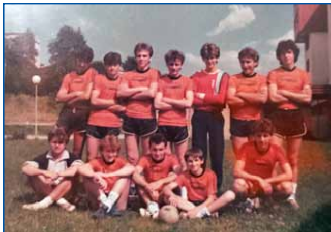
Števanovska mladinska nogometna ekipa, Dinda v prvi vrsti z labdov

šaulo, zavolo toga smo mi vsigdar fasivali kak doma tak v šaula. Mi smo fejest lagvi mlajši bilej, zavolo toga so na nas