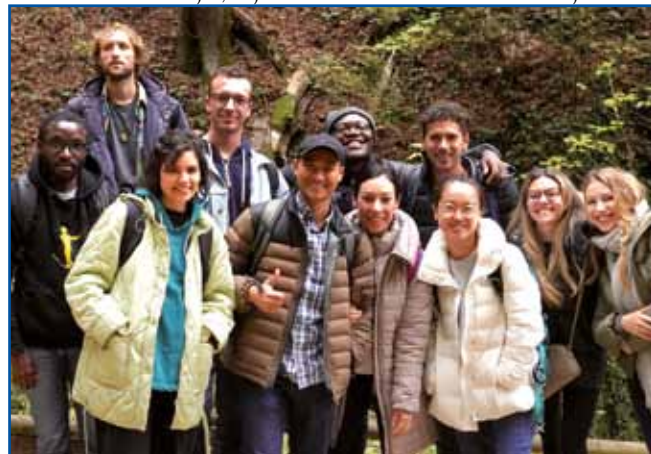
Na izletu s sošolci pri jami Pekel

Veliko sem razmišljal, saj nikoli nisem želel študirati v tujini. Am-