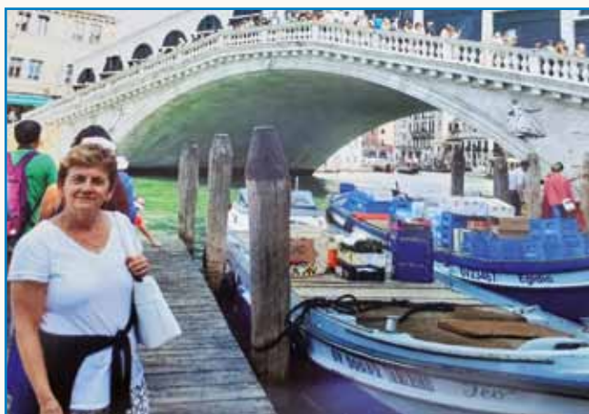
TAU SO LEJPI SPOMINI stran 8