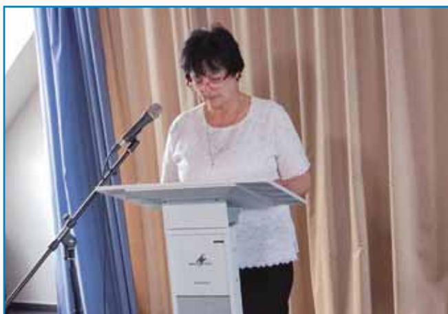
MELI SMO OBČNI ZBOR IN FORUM stran 6-7