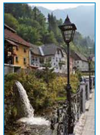
PRIPOVEJSTI O SLOVENSKI KRAJINAJ stran 9