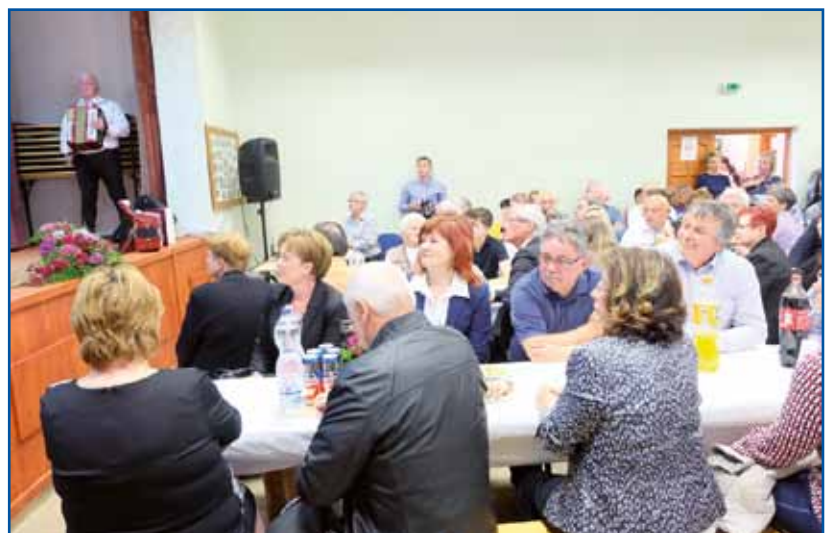
Kulturni daum v Sakalovci je bijo nabito puni.

z delom pomagale naslednje organizacije: Zveza Slovencev na Madžarskem, Državna slovenska samouprava, Občina Sakalovci, Občina Števanovci pa Slovenska samouprava Sakalovci.