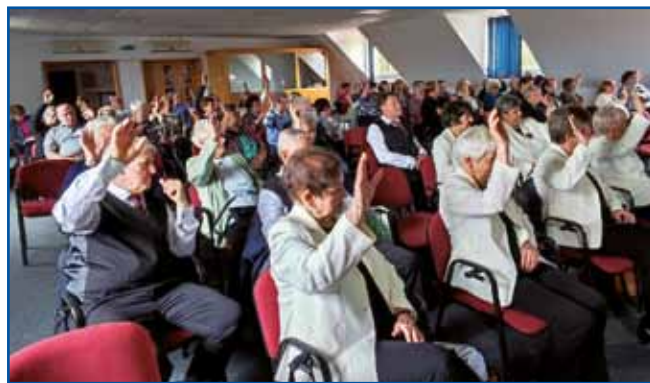
Člani društva so enoglasno sprejeli dnevni red občnoga zbora.

Nepozabni program je bilau srečanje z društvu upokojencev Murska Sobota, Rogašovci in Puconci. Štiri skupine so küjale golaž, ka so gosti in in člani zadvečerka do-