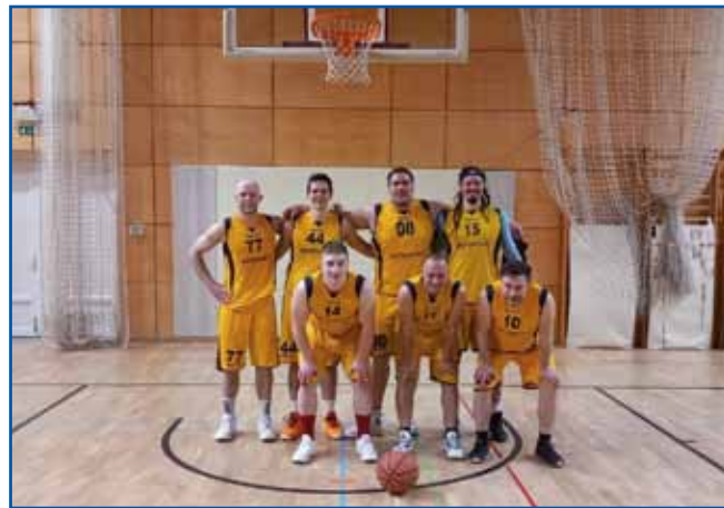
S svojimi košarkarskimi pajdaši