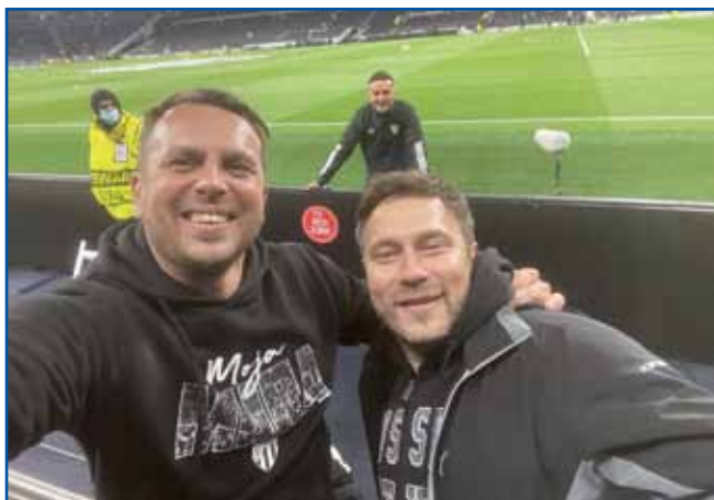
Že duga leta navija za soboški fotbalski klub Mura.

mi živeli. Meni se je že te kölnarsko delo povidlo. In zavolo toga sam se te tüdi odlaučo, ka dem v gostinško šaulo v Radence. Po zgotovljeni šauli sam prva šau