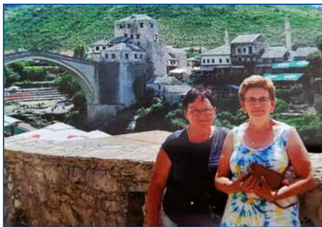
Spajdašico Ili Čuk v Mostari

štirideset lejt nikan sem se nej mogla pelati. Zdaj štiri lejta, ka župnik Bodorkós so prišli v Varaš, od tistoga mau sem začnila bola odti, najbola na romanja, stera on organizira. V cerkvi na konca meše vsigdar vōnja, kama baude prauška, pa te se vsikši leko glasi,