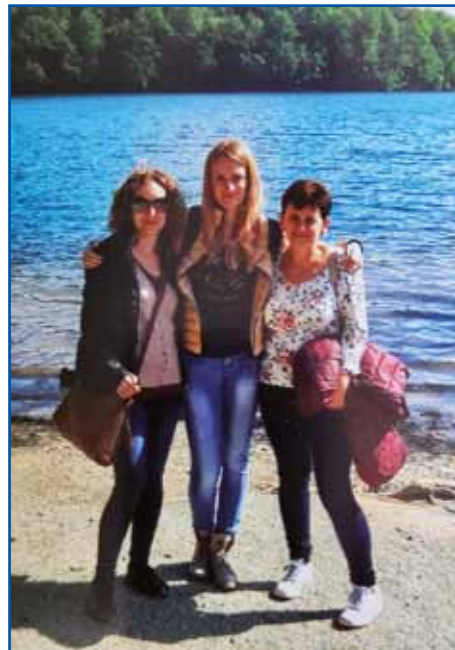
Večkrat kama idejo s hčerkama tō.

kamenje de ti kazalo paut. Pa rejsan je tak bilau, sploj dosta lūstva odi tam, pa tej kamni, gde lūstvo odi, so se že tak taščauvali, ka so svejkli bili