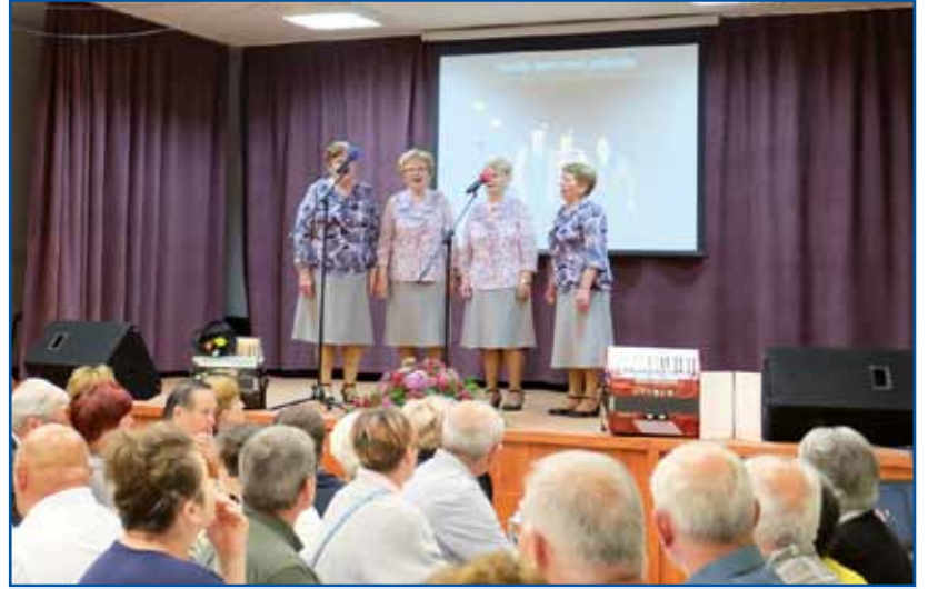
Ljudske pevke iz Lenarta so pokazale, kak se lepau spejvajo domanje pesmi.