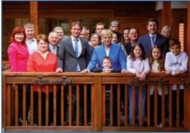
Nataša Pirc Musar je najprej obiskala Slovensko vzorčno kmetijo na Gornjem Seniku, kjer se je seznanila s ponudbo kmetije ter lokalnih pridelovalcev in rokodelcev, ki ohranjajo dediščino slovenskega Porabja.

besedah Pirc Musarjeve je to pomemben korak za spodbujanje razumevanja dediščine narodov in spodbujanje kulture branja, ki