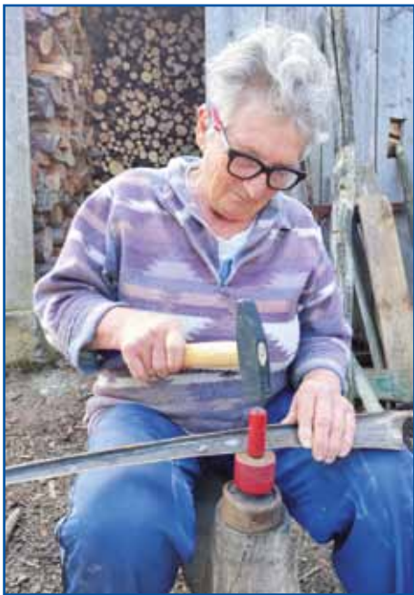
Kometrska Marika si sama klepa kosau.