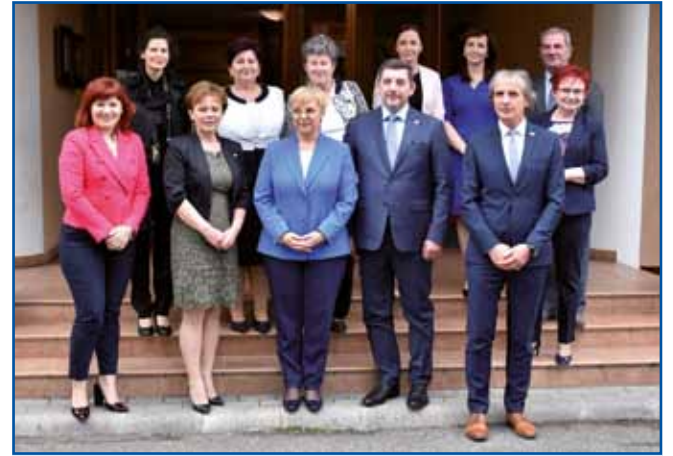
V Monoštru se je slovenska predsednica srečala s predstavniki slovenske narodne skupnosti.

prihodnost porabskih Slovencev. Dokler bodo med vami ljudje, ki bodo pisali v slovenskem jeziku in širili zavest o tem, da je slovenski jezik osnova obstoja narodne skupnosti Slovencev na Madžarskem, se za vašo prihodnost res ne bojim,« je po pogovoru s predstav-