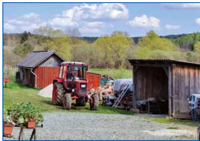
Stejmi mašini najbolje rad vnuk dela. Držina si vse pripauva, ka nej trbej.

»Tam, gde nega mare, tam leko z nitkarcov kosiš, tam se ne šte, če vse vküpdari, depa za bujcke je samo z ro-