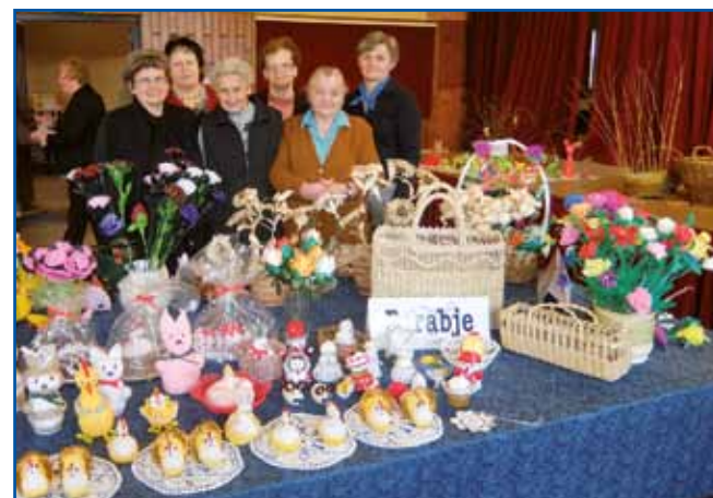
Porabski rokodelci so se notpokazali tüdi na Jožefovom senji na Cankovi.

Čabai so bili ravnatelj. Oni so neme trnok radi meli, pa so materi pravli, ka morem v Varaš v gimnazijo titi, vej pa se dobro včim.« Doma so gučali po domanje, tak ka se je vogrski komaj v šauli začnila včiti, tak pisati kak šteti: »Eno velko žalost mam. Gda