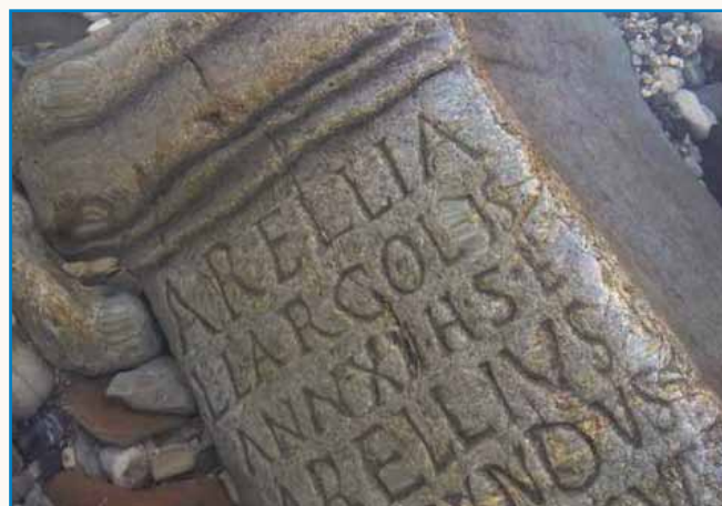
PRIPOVEJSTI O SLOVENSKI KRAJINAJ stran 9