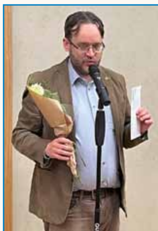
NAGRADA VSTAJENJE ... stran 4