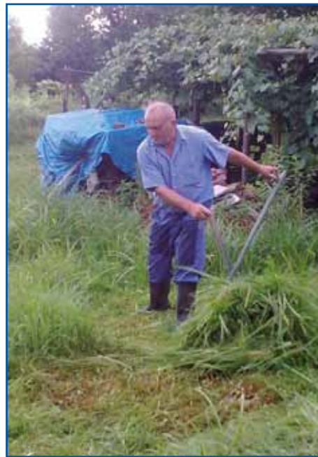
Karči pa kosi s kosau, stero je žena vösklepala.

sem se kositi, samo tak sem zato nikdar nej vej dla kositi kak moja oča. Nej samo dja, moja mati je tö vej dla kositi, gda je oča delat odo, te sve z mamov dveje šle na sonžete pa sve dopodneva vse do-