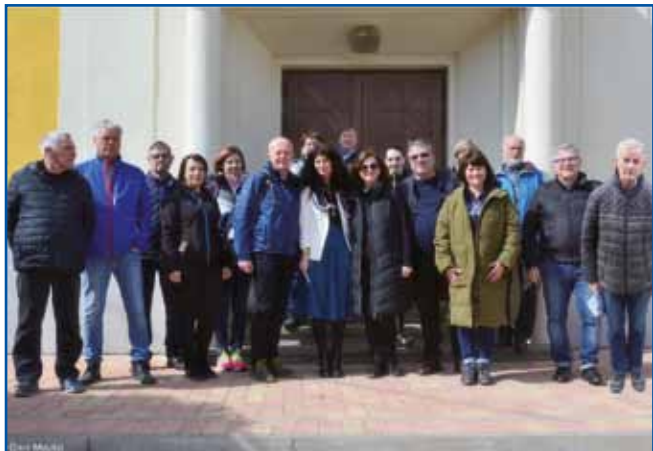
Strokovna domoznanska ekskurzija učiteljev osnovnih in srednjih šol s področij zgodovine, geografije in sociologije v izvedbi Prekmurskega društva generala Rudolfa Maistra Murska Sobota

ob slovenski domačiji skala s Triglava, ki ima na straneh kamen iz vsake porabske vasice. Po skupnem fotografiranju so pot nadaljevali mimo muzeja železne zavese v Števanovcih, kjer je na pokopališču zelo pomemben zapis »Sterim doma samo vözvo-