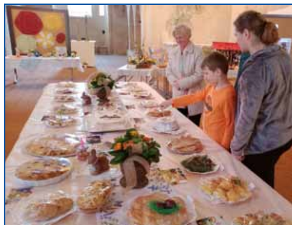
Na ogled je bilo več kot trideset domačih dobrot