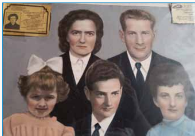
VSIGDAR NA PRAVO NOGAU TRBEJ LIČITI stran 8