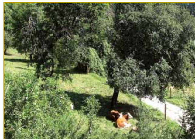
Na brgaj, na viski brgaj tö živejo, maro krmijo pa lejs v doline spravlajo

Sobote včasim prejk granice ves Žetinci stodji. Tam človek zaman tablo čaka, ka de po nemški pa slovenski tau pisalo. Samo Sieheldorf se leko