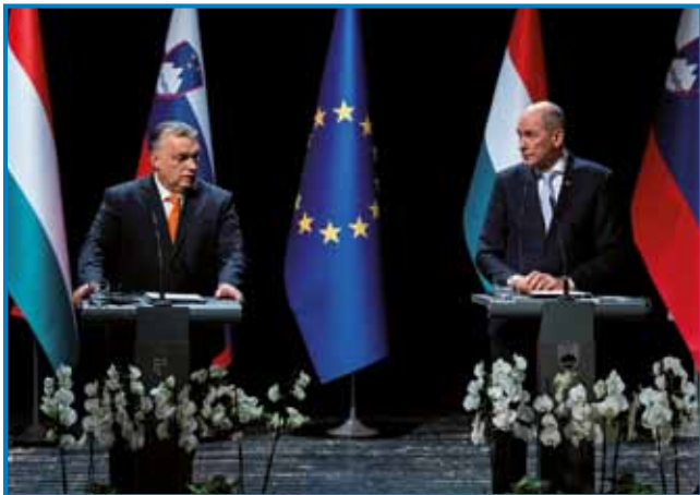
Premierja Viktor Orbán in Janez Janša na tiskovni konferenci v lendavski Gledališki in koncertni dvorani