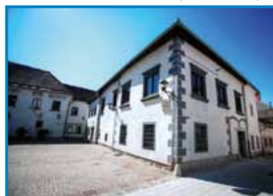
Lekarniški in alkimistični muzej

zelo estetskega videza. O tem priča zlasti dobro ohranjeno lekarniško pohištvo v radovljiškem muzeju. Ta obsega farmacevtsko opremo iz 18. in 19. stoletja, zbirko rastlinja, alkimistični laboratorij, veliko zbirko možnarjev od 12. do 19. stoletja, tehtnice in uteži, 30 starih farmacevtskih knjig iz 15. do 19. stoletja, zbirko zgodovine kozmetike in par-