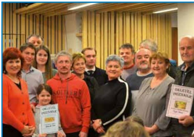
Nagrajenci, ocenjevalci in organizatorji

V soboto, 19. februarja 2022, je potekal festival domačega vina in pogač na Slovenski pogač potekalo podobno kot v prejšnjih letih. Vina je žirija ocenjevala po