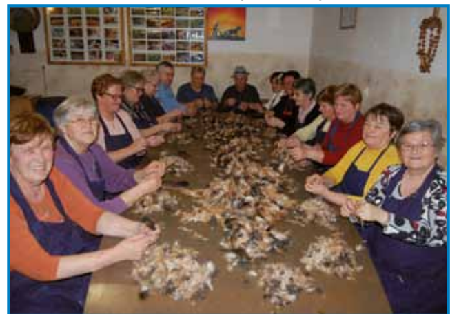
Etnološki prikaz česanja perja pri Hrenovih, v sodelovanju z Ljudskimi pevkami iz Žižkov

Besedila je napisala v prekmurskem narečju, v knjigi pa so tudi predstavite v slovenski knjižni jezik.