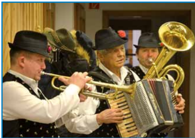
Za dobro voljo je poskrbel ansambel Što ma čas

li okus, teksturo in izgled. Vino so ocenjevali generalna konzulka Republike