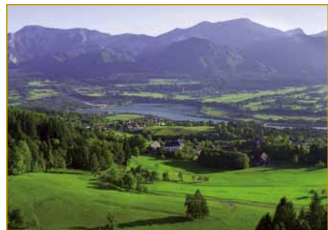
Največ lidi na Koroškom po dolinaj žive

lidi, steri so sami sebi prajli, ka »gori«, više doline živejo. Če malo poglednemo (Gor) otan-Korotan, se že malo od toga leko čüje. Tak ena teorija nam pripovejda. Druga vcejlak ovak guči. Ménje za Korotan-Karantanijo-Koroško aj bi iz staroga plemena Slavov - Horutanci - vöprišlo. Ranč Horutanci aj bi tisti stari Slavi bili, steri so se v tau krajino naselili. Kakoli vse teorije obračamo, za Koroško vala, ka že od inda je stara slavsko-slovenska krajina bila. Gda