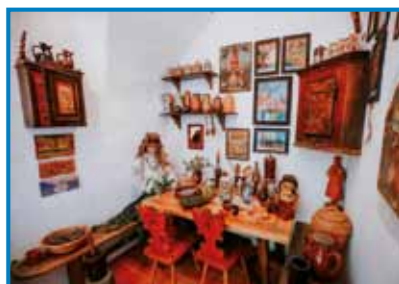
Etnološki del lekarne