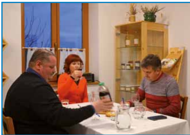
Komisija med ocenjevanjem vin

raznih lastnostih, kot so: čistoča, barva, okus in vonj, pri pogačah pa so upošteva-