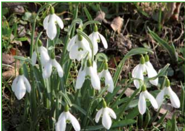
Velikokrat ne živimo z naravo, je ne poslušamo, kaj nam šepče. Zvončki se dobro počutijo pod listopadnimi grmi, ki so še goli. Toda kmalu se razširijo prek velikih površin

Dišeče vijolice, te majhne rastline, s svojo modri- no prinašajo na pomlad