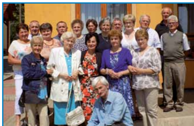
Na žalost je bilau tau slejdnjo našo srečanje 16. juniuša 2018. leta pred domanjjo šaulov, stero nam ostane v spomini na vekomaj

Draga naša prcerkorca, školnikojca, bili ste nam v višesi štiri razredaj - od 1964. do 1968. leta - kak razredničarka druga mati v našoj rojstnoj vesi v Števanovci. Od prvoga minuta ste nas z velikim potrpljenjom, skrbom pa radostjov ravnali pa vodili. Od prvoga minuta smo žedni bili na vašo lübezen, prijazne reči, smej, lejpi raji glas ... Vi ste nas navčili poštvivati, ceniti, radost meti do svoje materne rejči pri slovenski vörjaj, spoznavati lepoto sveta pri geografiji. S svojim znanjom, lejpm ponašanjom ste nam bili trno lejpa pelda. Gora smo gledali na vas! Ponosni smo bili, ka mi tašno dobro pa vrlo prcerkorco (učiteljico) mamo. Bili ste furt gospočko, lepau zrihtani od glavé do paté. Meli ste velko poštenjé pa ugled (tekintély) v cejlj vesi. Nikdar ste nikoga nej zbantüvali, vsakšomi ste z veseldjom pomagali, z vsikšim ste radi na gonč stanili. Vsebola za velkoga človeka smo vas držali, vsebola prausto sta se ponašali od najmenšoga do najstarejšoga človeka. Priznam, ka