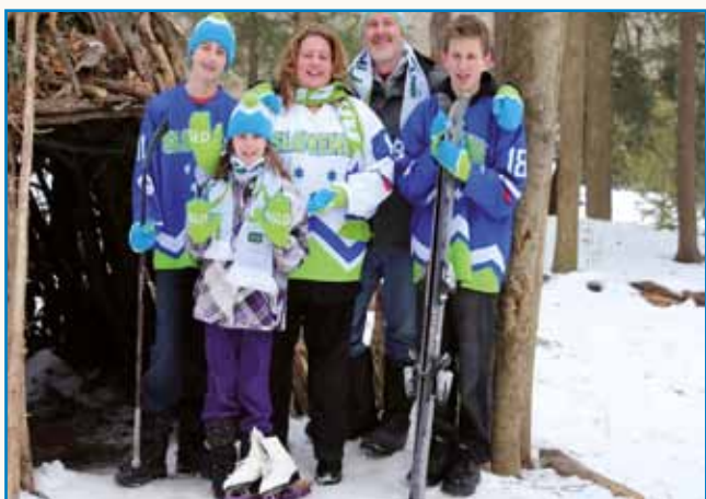
»Že skor dve leti je tak, ka se ne smemo družiti« stran 6