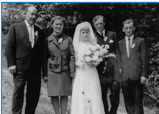
Njeni mauž je Vogrin biu, sodak je biu na Gorenjom Seniki

»Tam, kak demo na Janezov brejg, tam pod bergaum je bila edna mala iža, tam smo