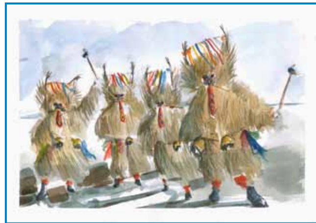
»Koranti« so najbole poznane maškare s krajine kauli Ptuja - naganjajo zimau in vse lagvo, zovéjo sprtolejte in dober pau

Koranti odijo v skupinaj, naponi skačejo in süčejo svojo