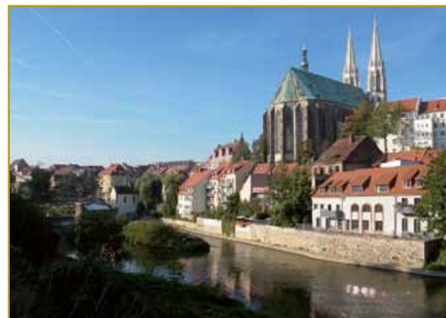
Tak Lužice gnesden vögleđajo. Slavom, steri tam kaulak živejo, Srbi pravijo. Depa njiva stara rejč je bole s porabsko v žlati kak pa s tisto, ka jo gnes Srbi v Srbiji gučijo. Tau samo od toga pripovejda, ka smo indasvejta vsi Slavi v gnakoj rejči gučali.

pripovejda. Z Lužicami, varašom, kualak steroga Lužiški Srbi živejo, je vse vcejlak ovak bilau. Kako li nin skrak sebe svojga naroda nemajo, eške sir