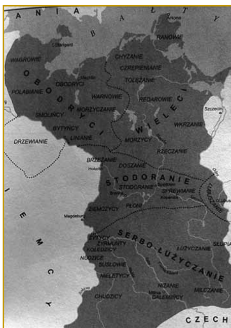
Tak je tau nin kaulak leta 800 vögleđalo. Zemljevid nam od toga pripovejda, kak na šurko se je pleme Slavov, iz steri smo Slovenci vöprišli, naselilo. Tam gnes zvekšoga lidge živejo, steri v nemškoj rejči gučijo.

... so slavski narod, steri je nej že od inda na svojoj zemli ostano. Z njimi je vcejlak ovak kak z Lužiškimi pa Polabskimi Slavi bilau. Gradiščanski ali ovak Bejli Hrvati so se na teritorijo gnešnje Austrije, Madžarske pa Slovaške dosta bole kesnej naselili. Nji so bojne s Törki iz njivi domauv tazagnale. Leko povejmo, ka so se kaulak 1530. leta seliti začnili. Gnesden je žmetno prajti, kelko lüđi je iz svoji domauv na vcejlak tihinsko zemlo prišlo. Gvušno, ka ji je nej malo bilau. Tau leko po tejm vidimo, ka eške gnesden prej 60 000 ji v trej rosagaj živé. Ja, inda je vse tau monarhija bila, Evropa je eške nej telko držav mejla. Zatoga volo Gradiščanski