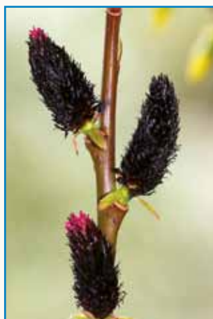
KDOR IMA CVETLICE RAD stran 7