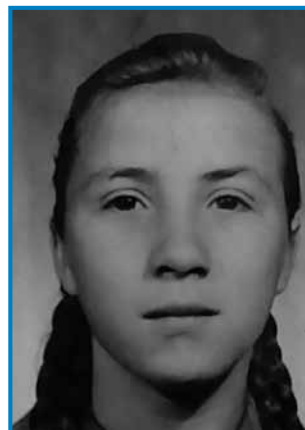
Ančika v mlajšči lejtaj