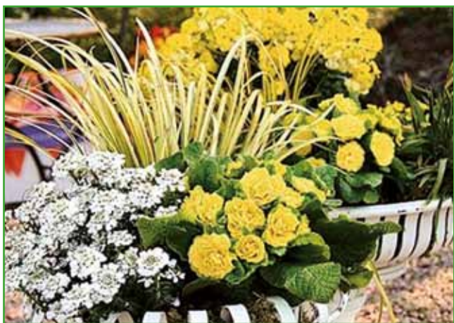
Polnjene trobentice v posajeni posodi

botanik, direktor botaničnega vrta Univerze v Ljubljani, največji poznavalec zvončkov pri nas,