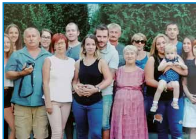
Ančika s čerami, zeti, vnuki pa pravniki

delat, samo prvin še tri mejsece smo se mogli včiti pa samo potistim so nas na mašine djali.«