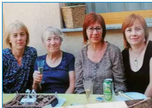
Ge bi ostala doma stran 8