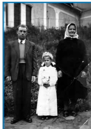
Prva spauwed, paulek njé sta oča pa stara mati, stera go je gorzranila

ra mati, tetice, svak pa ge. Mena je dobro bilau, zato ka ge sem tam tak bila, kak če bi njina sestra bila. Če so kama šle, gda so domau prišle, vsigdar so mi nika küple.«