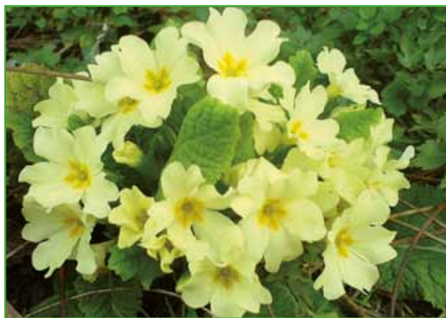
Primula - prav tako pomeni v latinščini prvi. Navadna trobentica ima blazinasto rast

Pravi, da raje občudujemo, kaj imajo drugi, namesto da bi pokazali svoje prve znanilce pomladi, saj ponekod zvončkov ne poznajo, in v takem obsegu vsepovsod zvončki ne rastejo. Zato so toliko bolj za-