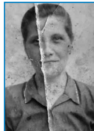
Svojo mater je nej poznala, samo te kejp ma od njé

»Nej tak fejest, zato ka on je nej z nami biu, on je ejkstra živo, telko samo, ka mi je peneze davo pa če mi je kaj küpo. Mena je bola lagvo bilau, gda so stara mati mrli, zato ka po pravici name so