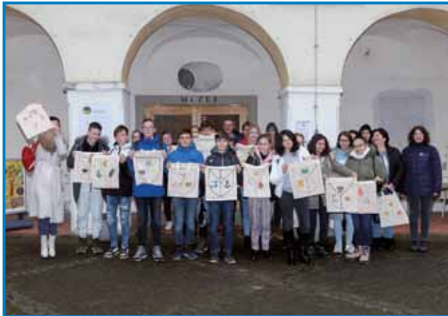
Porabski šolarji so 2. decembra obiskali Pomurski muzej v Murski Soboti