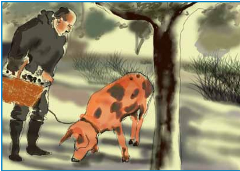
»Djelenove gobe« je žmetno najti v lesej, za tau se največkrat nücajo posabne svinjé - »Malo se šetam ž njauv,« so šegau meli gučati iskalci, gda je prišla kakša kontrola

v populaciji djelenovi gob. Zatok gnes že raj nücajo pisauve, na Taljanskem pa so celau dojzapovedali iskanje s pravcami. Iskalec more tō posabno dopüşčenje dobiti.