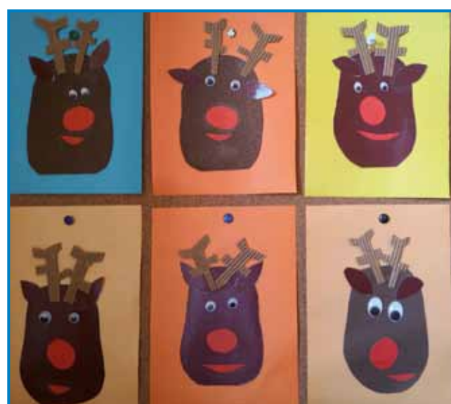
Ustvarjali so otroci iz vrta Sakalovci