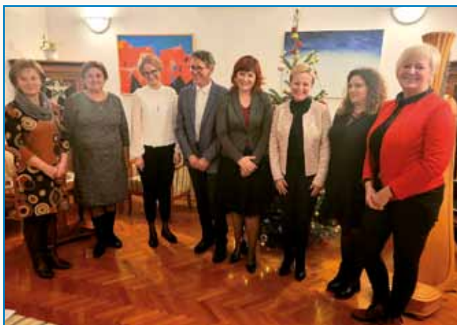
Konec je vsigdar srečen stran 4