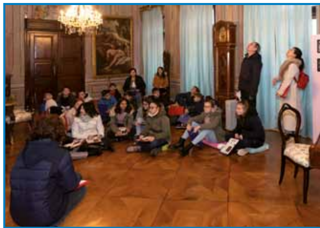
V soboškem gradu je tekla beseda o gradovih

tudi učiteljem sem predstavila projekt, ogledali smo si tudi spletni portal, najbolj podrobno podatke iz njihovega kraja,« je še razložila sogovornica. V bazo podatkov so sicer združeni etnološki, arheološki, kulturno-zgodovinski in biografski podatki.