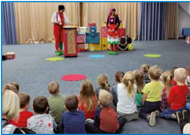
Malčki med ogledom praznične predstave

Kdo pa je bil sveti Nikolaj? Prvi dobri mož, ki v adventnem času obdari otroke, je Miklavž. To se zgodi v noči s 5. na 6. december, ko goduje Nikolaj. Sveti Nikolaj se je rodil ob koncu tretjega stoletja, svoja premožna starša je izgubil že v mladih letih. Podedovano bogastvo je razdelil med reveže, s tem pa postal ljudski simbol skromnosti in obdarovanja. O njem krožijo številne legende, med njimi je tudi darovanje s tremi zlatimi kepami, s katerimi je poskrbel za doto treh hčera siromašnega moža. Zato ga na podobah pogosto spremljajo tri kepe zlata, ki jih je ljudsko pojmovanje kasneje spremenilo v jabolka, ta pa so skupaj z orehi postala