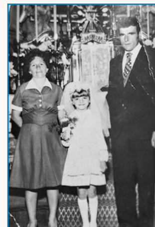
Kak smo popejvali, tak so se pasle stran 8