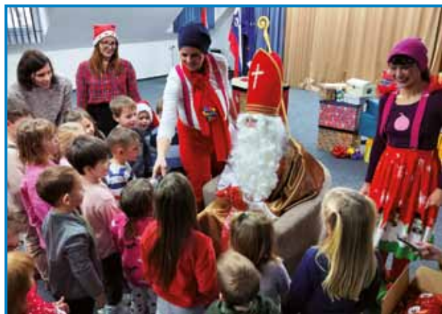
Potem ko so otroci peli in recitali Miklavžu, so prejeli vrečo sladkarij

ter pozdravil otroke, saj je slišal, da so bili pridni. Malčki iz posameznih vrtcev so Miklavžu zapeli in recitali pesmice, nakar