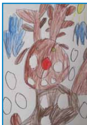
Dóra Fábián, 6 let, vrtec Monošter