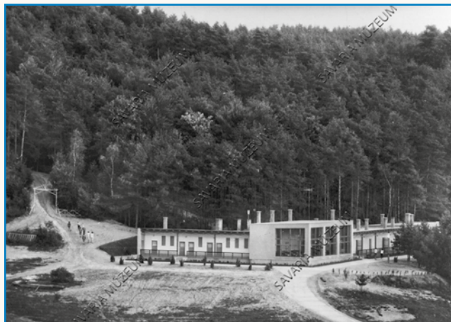
Našel je tloris svoje hiše stran 7