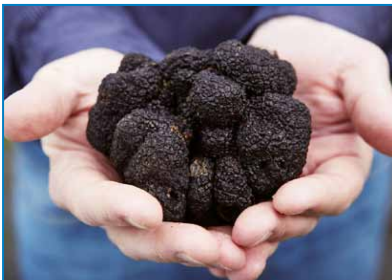
Tartufi ali djelenove gobe majo 180 fajt, najbole iškejo črne - ena kila košta više pau miljauna forintov

Na Francuskom je v 20. stoletji iskanje tartufov furt žmetnejše grtūvalo. Oprvim je najbaukše krajine na nikoj djala prva svetovna bojna, sledik pa süučé in ica. Že od davnik so sprobavali djelenove gobe pauvati tō, vej