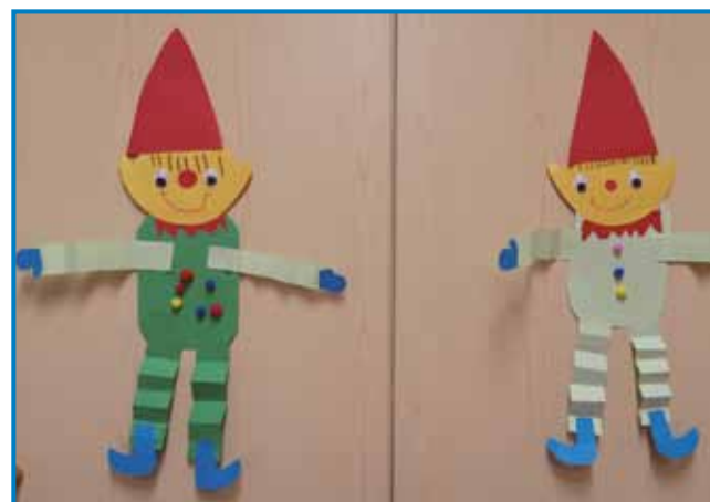
Škratki, ustvarjali otroci iz vrta Monošter in Sakalovci