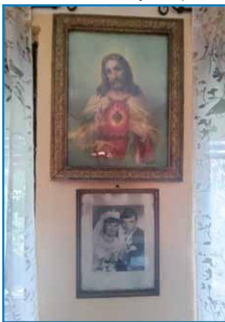
Svete kejppe je največ njeni ata spravo

»Djaboka, niši mali cutjar pa če so kakšne fidjice spekli, tiste so tü gorazvezali. Nej je bilau tau, baug vej, kak okinčano, depa mi smo se tauma krispana fejst vese-