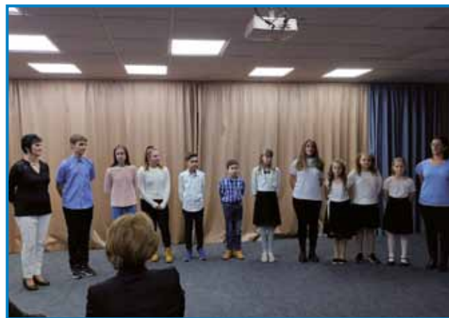
Lejpi program so pripravili senički šaularge

Potistim so gosti in člani društva vsi šli na adventni koncert v konferenčno dvo-