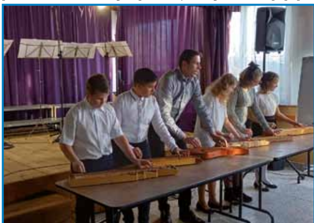
Učenci števanovske šole so igrali na citrah

Po koncertu smo pleli adventne vence, ki jih je župnik v nedeljo blagoslovil. Lep popol-