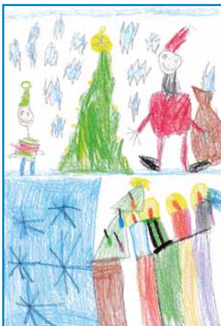
Risbici sta narisala Noel Károly Császár, 6 let in Léna Császár, 6 let