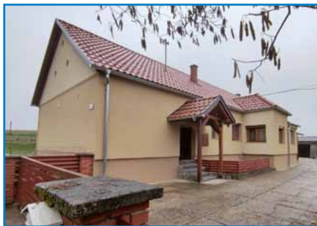
Verička hiša, v steroj je več deset lejt delo lončar Dončecz, je zdaj dom Batjine Terike

od dauma so Števanovci daleč bili pa Senik tö, kama ste odli vi k meši?