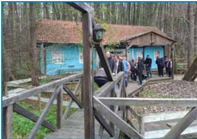
Ob Copekovem mlinu urejajo interpretacijsko pot naravne in kulturne dediščine

območje zdaj vzdržujemo brez strojev, tako kot so to nekoč naši predniki. Tu so se v toplejših dnevih pasle tudi ovce. Danes temu pravimo trajnostni način. Površine torej ohranjamo na način