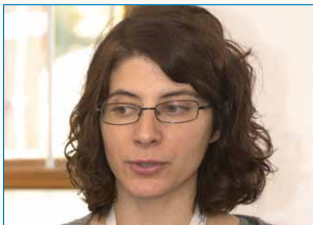
Bole je starejša, bole jo vse zanima stran 4