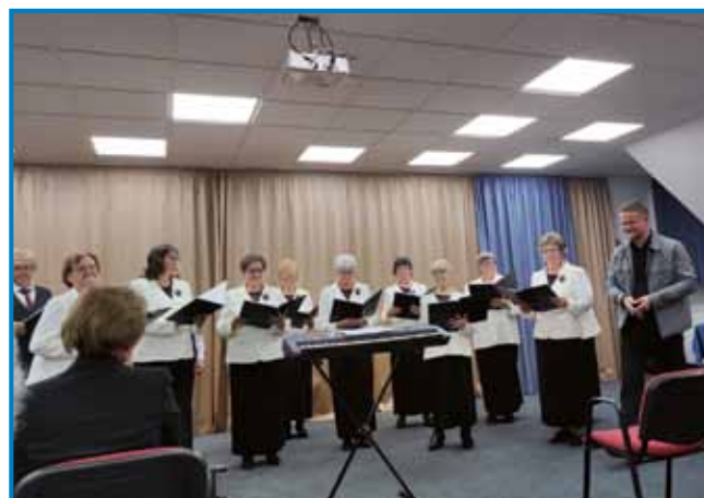
Na koncerti je spejvo pevski zbor Rozmarin DU porabski slovenski penzionistov

srečanje, na advent. Na rokodelski delavnici so pripravili božične zvezde za dar starejšim članom od 75 let. Flajsne ženske so spekle medene figice na Gorenjem Seniki v Hiši jabolk in