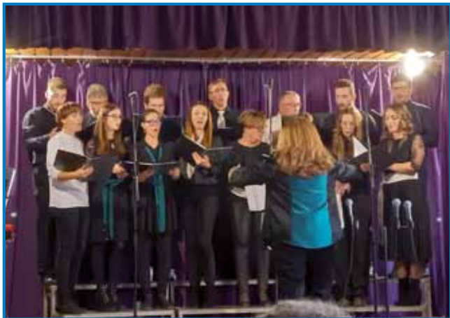
Nastop glasbene skupine Maranata

26. novembra je Slovenska narodnostna samouprava Števanovci organizirala adventni koncert in pletenje vencev v kulturnem domu. starejšimi in drug do drugega. Bolj pazimo na druge, več se pogovarjamo in bodimo tolerantni. Na adventnem koncertu in med pesmimi smo lahko