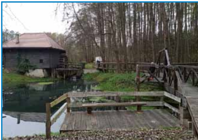
Copekov mlin je pomemben spomenik stavbne in etnološke dediščine