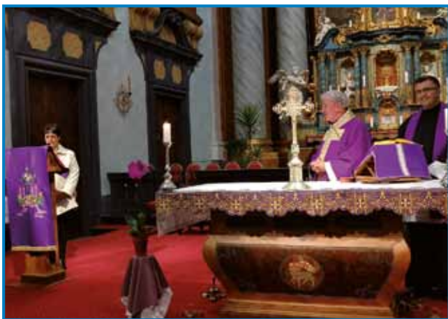
Po sveti meši se je predsednica društva zahvalila župnikoma Režonji in Bodorkósi

je predsedstvo Društva porabskih slovenskih upokoencev pozvalo člane in goste na slovensko adventno mešo v baročno cerkev v Monoštri, potistim na adventni koncert in pogosti-