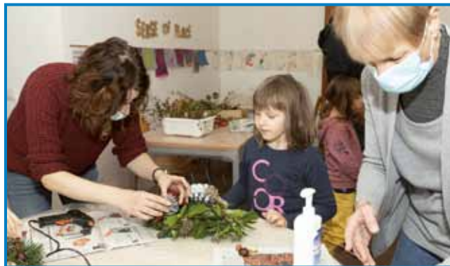
Spomin na delavnice v cajti epidemije, gda je trbelo nositi maske

Po zgotovljeni osnovni šauli v domanji vesnici se je šla dale šaulivat v Mursko Soboto na srednjo ekonomsko šaulo, po tistom pa je šla ške naprej v Ljubljano na Filozofsko fakulteto. Odlaučila se je za študij etnologije: »Meni so furt bole ležali humanistični, družboslovni predmeti. Te sam nej