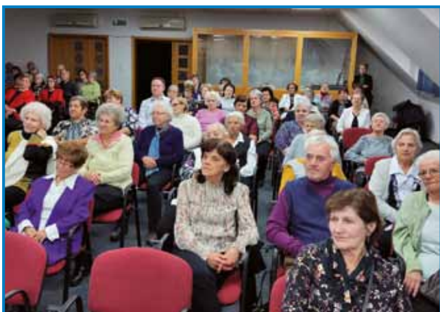
Konferenčna dvorana se je lepau napunila s penzionisti in gosti iz vsej porabski vesnic