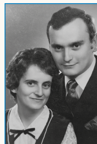
Krispan smo vsigdar meli stran 8