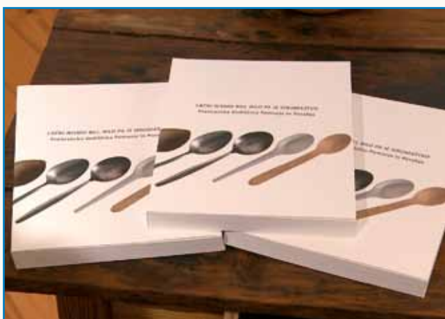
Kako in s čim so se prehranjevali - tudi v Porabju stran 3