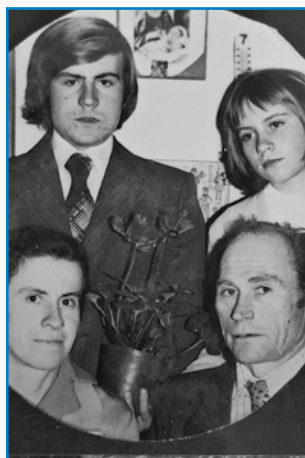
Moja mati je Marija bila stran 8