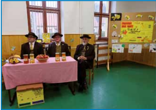
Slovenski čebelarji na medenem zajtrku na Gornjem Seniku

»Na ta dan na medeni zajtrk prihajamo k vam iz Slovenije, da se