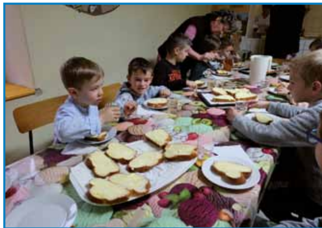
Skupni zajtrk nižjih razredov v Števanovcih

šolarji ozaveščate o tem, kaj pomeni čebelarstvo, kako pridemo do medu in kako je to pomembno za naše življenje. Vsi namreč dobro vemo, da