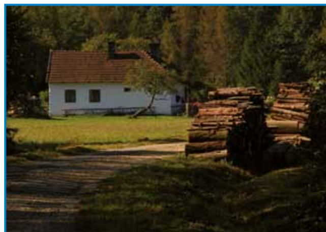
V božji deželi, na Verici je zmeraj mir

jasen pokazatelj zdravega delovanja narave. Nič ni lepšega kot jutraj sedeti na klopci in opazovati lastovke, ki priletavajo iz hleva. Pobiranje hrušk izpod drevesa kot jutranja poslastica je zame nepoznan luksuz.