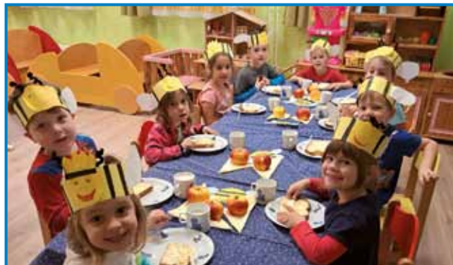
Slasten zajtrk na pogrneni mizi

V našem vrtcu smo skupaj z otroki praznovali Dan slovenske hrane, ki smo ga obeležili