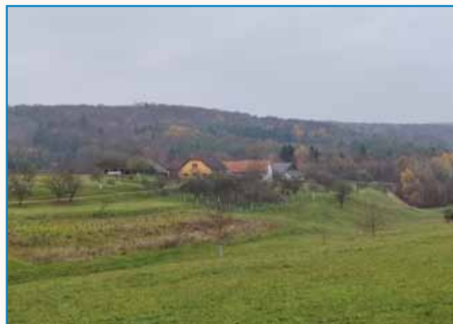
Božja dežela - Verica skozi oči Britanca stran 10