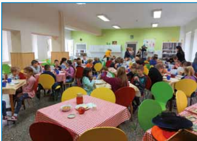
TRADICIONALNI SLOVENSKI MEDENI ZAJTRK ... stran 5