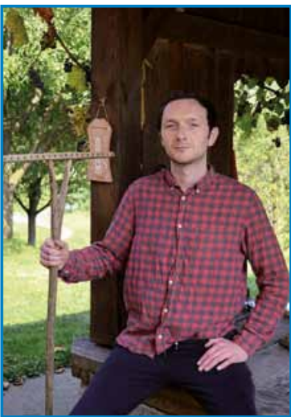
Z grabljami sploh ni bilo enostavno delati

Morda sem se preveč trudil, da bi naredil vtis na svoje gostitelje, ali pa morda kot mestni otrok nisem imel dobre tehnike, da bi orodje pravilno uporabil. V vsakem primeru je bil László