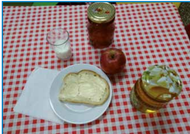
Tradicionalni slovenski zajtrk: kruh z maslom, med, jabolko in mleko

dogodka je otrokom približati zdrav obrok, prav tako pa jim predstaviti eno najbolj zdravih in hranljivih živil – med. Na osnovni šoli Jánosa