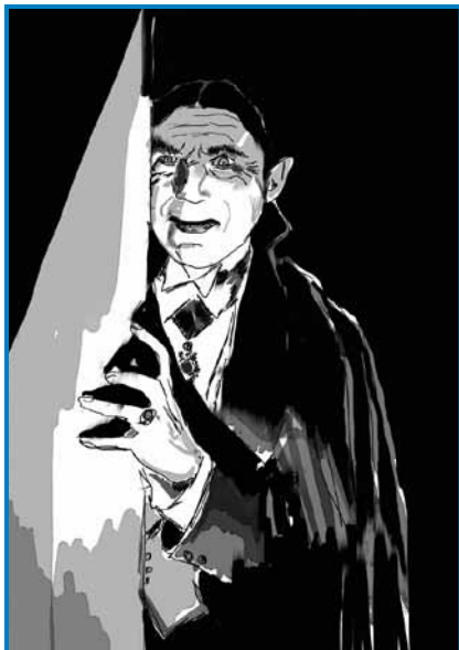
Prizor iz ameriškega filma Drakula – leta 1931 je vlogo odigral Béla Lugosi (1882–1956), ki ga še dandanes istovetimo z likom vampirja.

Lugosi je stopil v peto desetletje življenja, ko ga je zapustila tudi druga žena. Dolgo