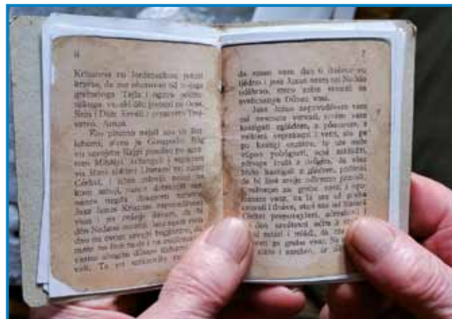
Molitvene knjige v stari porabščini, pisani z vogrskimi literami