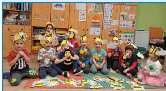
Spremenili smo se v male čebelice

s slovenskim zajtrkom. Na krožniku so nas čakali mleko, maslo, kruh, med in jabolko. Slogan letošnjega Tradicionalnega slovenskega zajtrka, katerega namen je pomagati pri osveščanju in predajanju