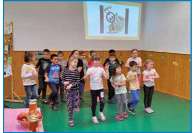
Prvo- in drugošolčki DOŠ Jožefa Košiča so zaplesali čebelji ples