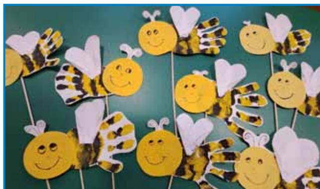
Otroški odtisi dlani. Nastale so čebelice

s slovenskim zajtrkom. Na krožniku so nas čakali mleko, maslo, kruh, med in jabolko. Slogan letošnjega Tradicionalnega slovenskega zajtrka, katerega namen je pomagati pri osveščanju in predajanju