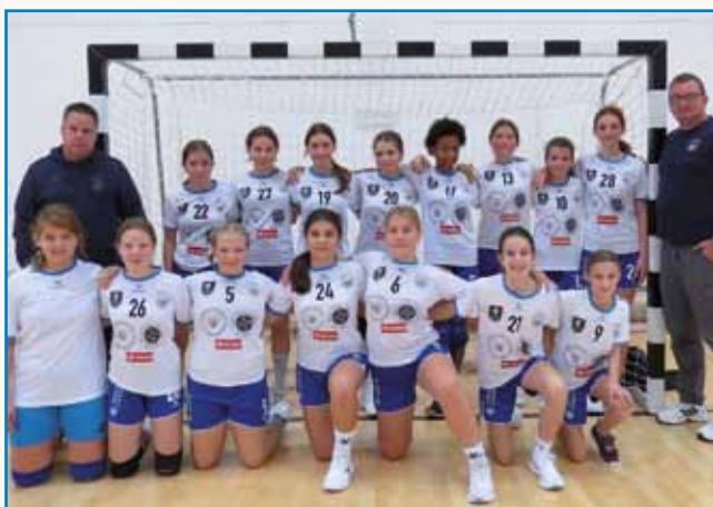
Mednarodni rokometni turnir v Monoštru stran 5