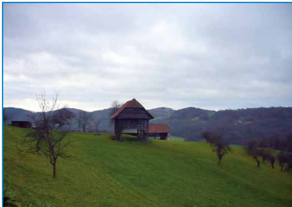
V takšoj dolensjskoj krajini pela paut z Litije do Čateža

za premišlavanje o cilaj tedešnje slovenske književnosti tö. Tak piše: literatura aj slüži prausnoma lüstvi, aj ga spravla v smej, ga vči in narodno prebidi. Pisatelj aj v ljudskom geziki nutpokazuje življenje lüstva, štero more v knjigaj sebé videti kak liki v gledali. Bole kak verši majo pomen proza