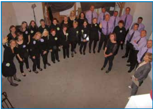
Soboški mešani pevski zbor Štefana Kovača je vodila 20 lejt