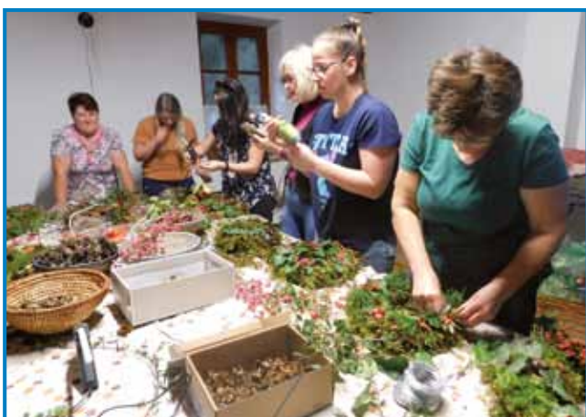
Izpod iznajdljivih rok udeleženk so nastali prekrasni izdelki

»Nikoli se ne sme nihče bati, da ni ustvarjalen. Vsi