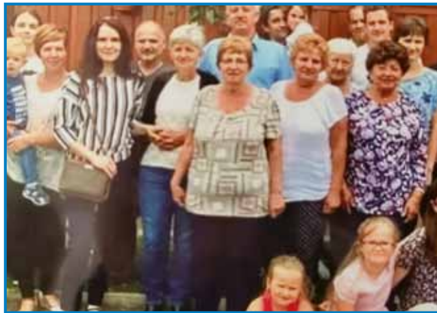
Širša družina na držinskom svetki

»Nika smo nej leko odali, kumaj smo leko telko