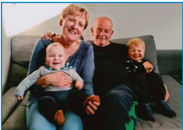
Babica in dejdek z vnükoma

vsakši den vküper, je bilau baukše. Ta sestrska lübezen je ške gnesden velka, fejst sve povezanivi, vej pa nega dneva, ka se ne bi čüle po telefo-