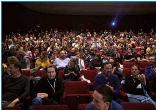
Na festivali se vsikšo leto rejsan dosta lidi leko vidi. Zvün publike se na njem najdejo vsi tisti, steri na filmi pa z njim delajo. Dnevi festivala za svetek slovenskoga filma valajo. Tau leto je festival biu od 25. do 30. okatubra

san dobrom filmi najdemo. Film Jezdeca je mlada ekipa naprajla, v njem se tau eške kak lepau da videti.