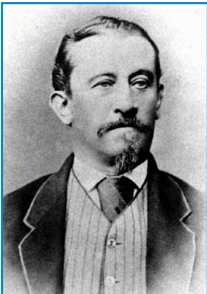
Slovenski pisatelj, pesnik in dramatik Fran Levstik (1831-1887) je med drügim napisal erično pripovedjst o Martini Krpani

gučati o ostalinaj ljudske literature in paverski pisateljaj, tau priliko pa vöponüca