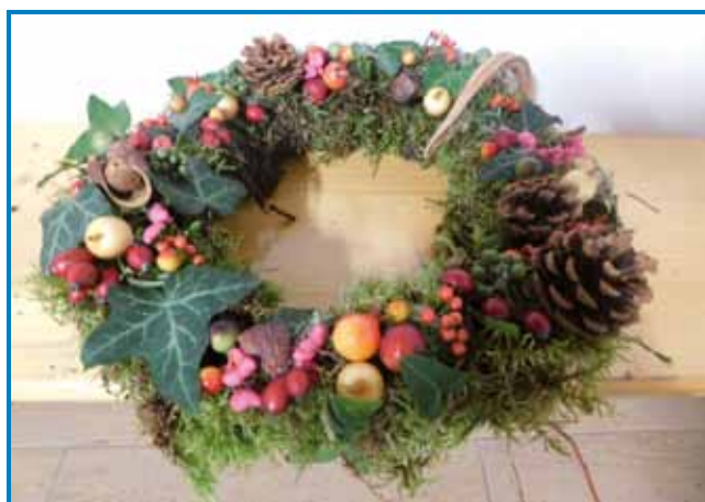
Eden izmed čudovito okrašenih venčkov

okoliških gozdovih. Tako se skupaj z naravo lahko povešimo konca rastne sezone. Tudi Hiša jabolk na Gornjem Seniku je bila v petek, 28. oktobra, polna jesenskih