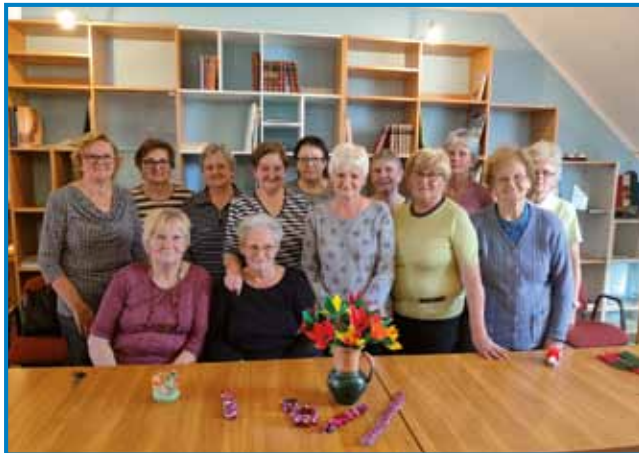
Članice Društva porabskih slovenskih upokoencev

Gda so tau une pokazale nam, se je enostavno vidlo, smo tak brodili, ka de naléki šlau. Sprvoga so se naši prsti nej tak gibali kak bi trbelo, dapa brž smo gorprišli na delo. Vsakši je naredo eno ali več božični zvezd, ka je leko domau neso. Svejčnik delati