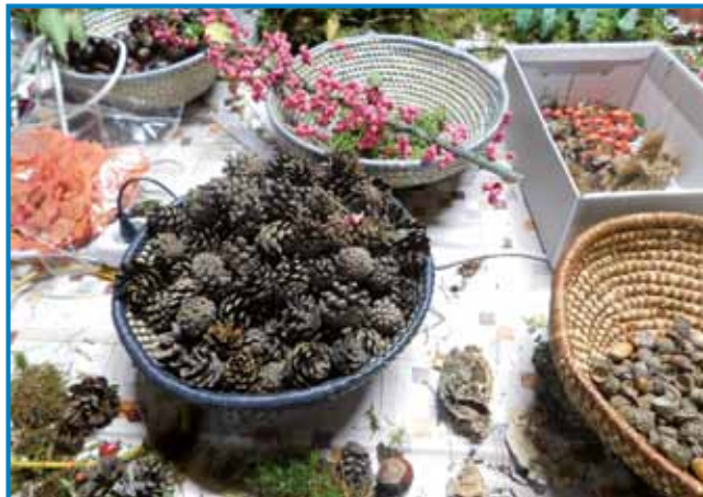
Miza je bila polna z jesenskimi pridelki

selje nam podarijo rastline na našem vrtu, polju ali v