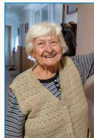
Znaava mo orali pa sejali stran 8