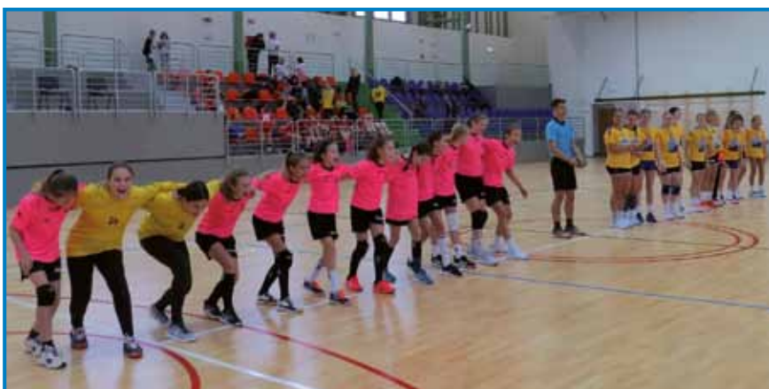
Monoštrske rokometasice (z leve) pred tekmo proti ekipi avstrijskega Weiza

Zelo smo zadovoljni, sicer ne najbolj nad našim rezultatom, doživeli smo namreč štiri poraze, a naše punce se