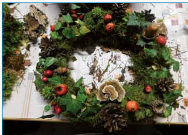
Pisane barve jeseni stran 7