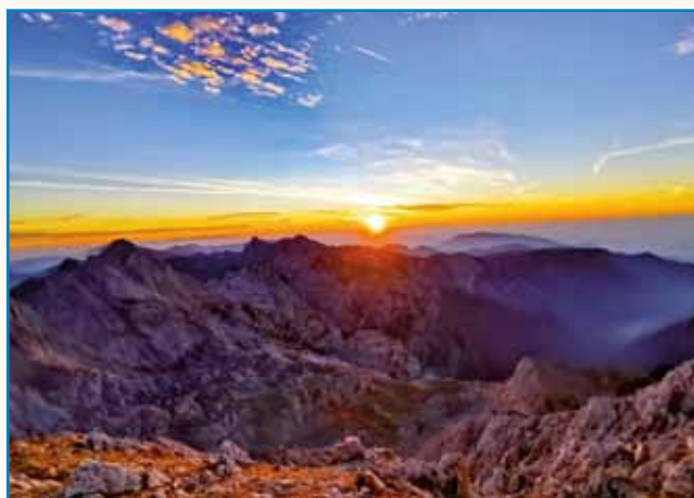
Karči osvaja slovenske vrhove stran 7