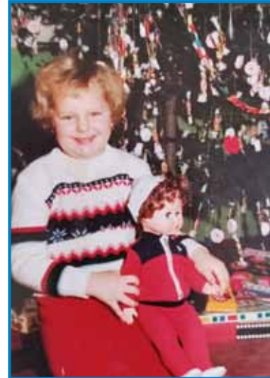
Človek ranč ne vej, stera je lepša, živa baba ali igračka

šali. Gda je tak bilau, ka nej bilau dela, te so nam prajli, ka idite domau. Tak sem te 2008. leta, gda so na psihiatrijo iskali delvace, se ge tö glasila nut v