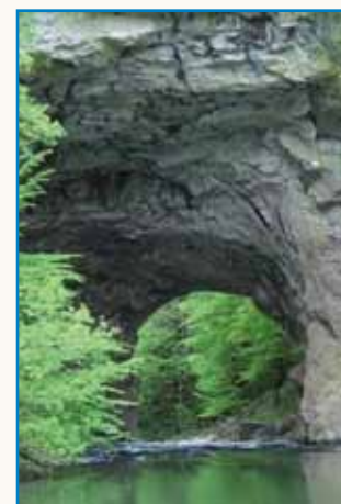
Pripovejsti o slovenski krajini stran 9