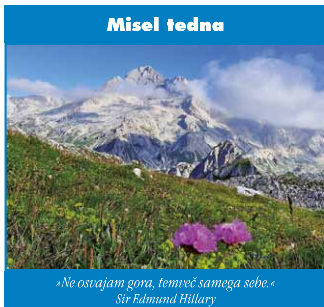
»Ne osvajam gora, temveč samega sebe.« Sir Edmund Hillary

ne ostane nič drugega, kot vrhovi in sonce. Kot če bi bil v nekem drugem svetu. Tako lahko malo stopim iz resničnega življenja. V tem dinamičnem svetu prehitro