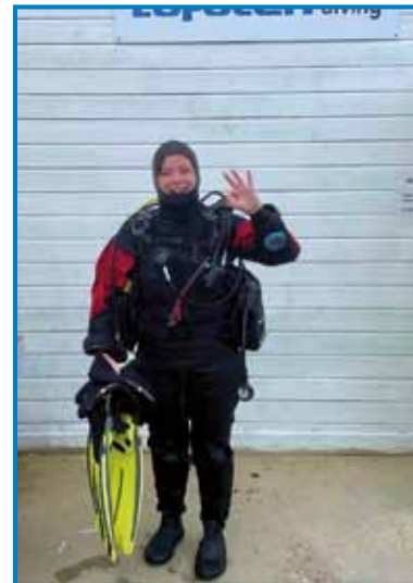
Severno mordje je mrzlo tüdi vleti, zatau se leko potapljaš samo v neopremski opremi

breg, pa si doj na tau plažo gledo.« Lepau je bilau tüdi te, gda se je na povabilo ene od gostij hotela šla potapljat. Brez neopremskoga gvanta