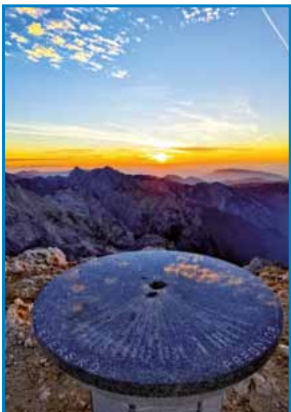
Pogled z Grintovca

žuje vrhu, počasi vse skrbi in težave pusti v dolini. »Ko napreduješ višje in višje, pozabiš na vse, zgoraj ti