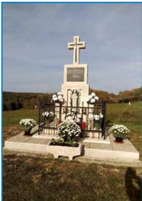
Obnovljen križ stoji na griču Bedi v Otkovcih

mestu postavljen lesen križ, ki je zaradi vremenskih vplivov propadel, zato so Antalovi stari starši ob koncu 19. stoletja dali na njegovem mestu po-