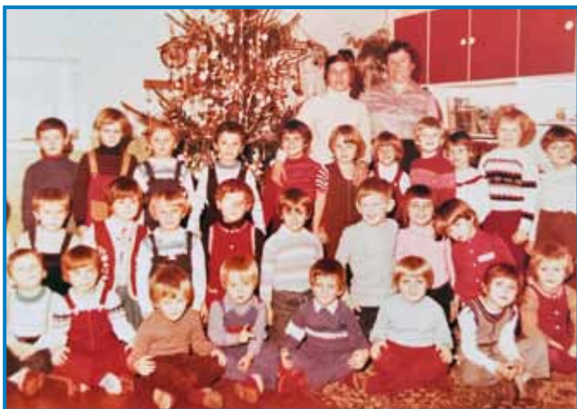
Kak dejte v gorenjoseničkom vrcti (v drugoj vrsti druga s prave)

»Leta 1981 je mrla, tau je mena lagvo bilau, zato ka ge sem njau fejst rada mejla, ge sem sploj dosta bila z njimi, skur cejli den. Gda je mrla, te je ona