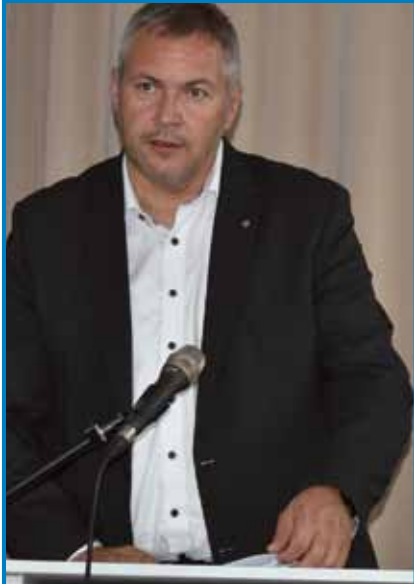
»S tovrstnimi dejanji se lahko manjšina ohranja in tudi razvija,« je dejal državni sekretar Dejan Židan, ko je najavil slovenski gospodarski program za Porabje