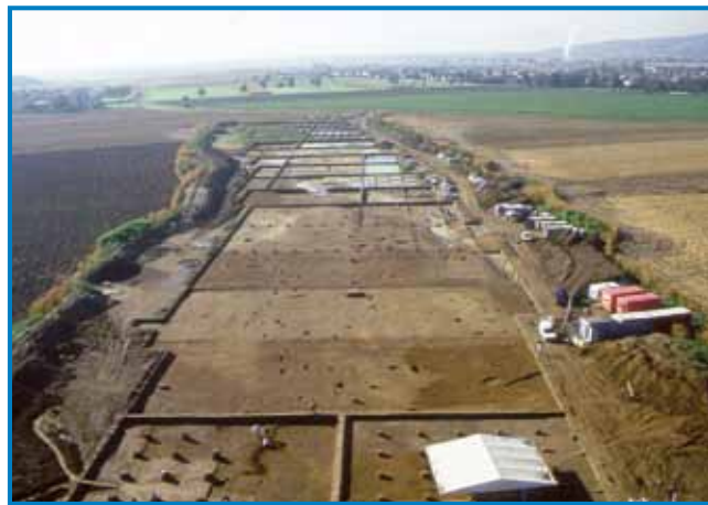
Površina razdeljena na sektorje in kvadrante

investitorjem in posledično arheologom zamejijo konservatorji iz Zavoda za varstvo kulturne dediščine na podlagi predloženih gradbenih projektov. Investitor si zatem poišče ustreznega izvajalca raziskav