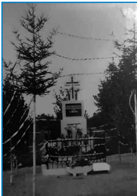
Tako je izgledal križ v 80-ih letih

stoji pri križišču na griču Bedi. Križ, ki ima precej zanimivo zgodovino, je dala obnoviti Slovenska narodnostna samo-