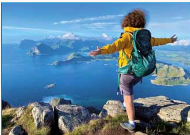
Cejli den je bilau sveklo stran 4