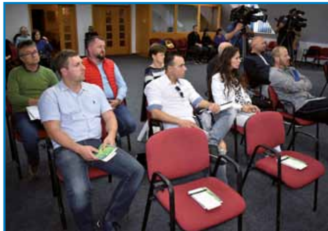
Del prisotnih podjetnikov na informativnem dogodku – njihova podjetja morajo imeti sedež na upravičenem območju in zaposlovati Slovence

330 tisoč evrov. (Slednji vsoti naj bi bili razpisani v prvi polovici prihodnjega leta.) Namen vseh treh ukrepov bo – v smislu razvijanja gospo-