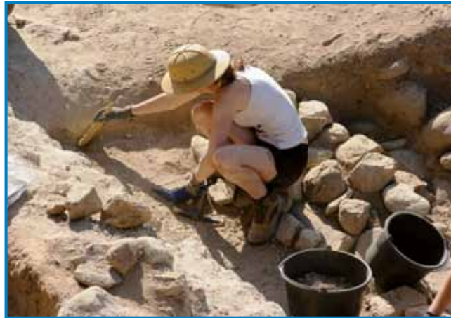
Arheologinja pri delu

Potek dela je takšen, da si arheologi pred vsakim izkopavanjem zakoličijo teren, nato pa pričnejo z izkopava-