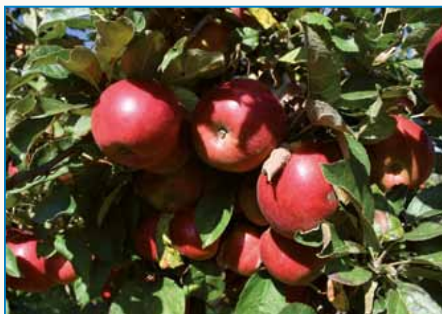
»Djabke mi spoj radi mamu« stran 6