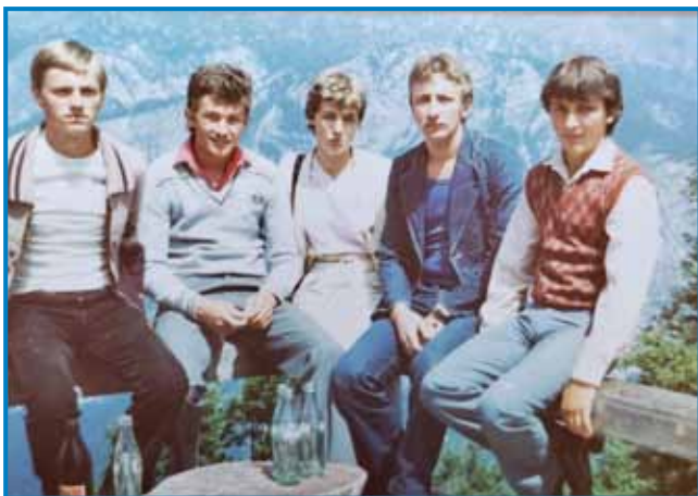
Lacijova generacija je trno rano začnla spejvati v Mešanom pevskom zbori Avgust Pavel

delati pa tau, ka iz dela leko živeš. Ranč tak so nas navčili na tau tō, ka moraš ceniti svoj jezik, svojo kulturo. Ge tak mislim, ge sem se v tau nutnaraudo, ge sem tau daubo, ge tau moram tadale nesti. Ge se tauma radūjem, mena je tau lejpo pa dobro. Ge sem se tū naraudo, ge sem odtec nikdar nej mogo kraj titi, sir sem doma