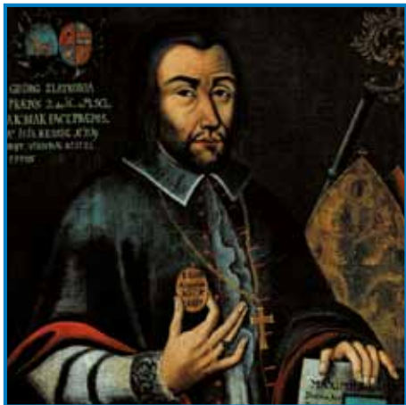
Slatkonja, portretna slika, razstavljena v galeriji prostov na hodniku škofije Novo mesto.

Jurij (Georg) Slatkonja se je rodil v Ljubljani 21. marca 1456. Pred odhodom na Dunaj je študiral v nemškem Ingolstadt, na dunajsko artistično, filozofsko, umetniško in