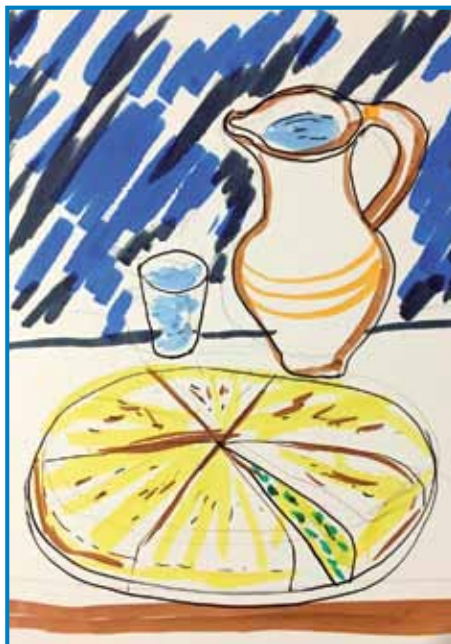
V našom Porabji so vertinje na vsisvecovo »za düšice« spekle repovi zaunik s tikvinimi koškicami – nalekle so jim edno posanco vodé tó

dinske ali žitne mele pekile »prešice«, štere so mele formo krüja. Na več mejstaj so kaudiške na vsisvecovo vküppobrali telko prešic, ka so meli gesti za en par mejsecov. V varaši Železniki pa so mlajši in srmacke ojdli k kovačöm, šteri so jim mesto krüja davali peneze, indrik na Gorenjskom pa so dobili djabka, grüške in krumple tó. Na Dolenjskom so srmacke klantivali z veukimi žakli in se za prešice zavalili: »Baug plati vam in vörnim düšam v vicaj!«