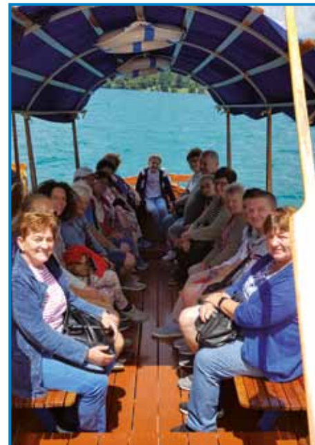
Vesela vožnja s pletno do Blejskega otoka

dilo slovo od morja. Na poti domov smo se ustavili še v Lipici in si ob vodenem ogledu pogledali prečudovite bele konje. Po ogledu kobilarne nas