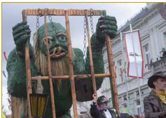
Brezi povodnoga moža v Cerknici nejde. Ranč un je njino Cerknisko jezero naredo, tak nam legenda pripovedja. Zviin njega leko eške dosta drugi takšni figur se vidi, stera nam od stari, indašnji časov pripovedjajo. Kelko časa pa dobre volé za vse tau trbej meti, samo domanji lidgé vejo

iz poganski časov k nam prišlo. Pustni ali fašenski čas že sprto-lejt k nam zové. Vse de začnol-rodití, vse na nauvo zaživé. Ženski »pauv« se tó nin mora