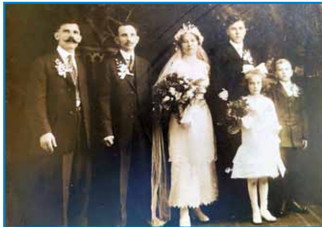
Zdavanjski kejp iz Amerike, steri je biu napravljeni na lemez

kak zdaj vse tadoj dé. Ge sem še s kravami orau, zato ka moj oča je rano mrau. Nas, moja generacija so še navčili delati, dočas ka so se drūgi čopkali v potoki, dočas smo mi na njivi, na mazejav delali ali krave smo pasli. Mi smo še tak gorrasli, nas so navčili, ka moraš