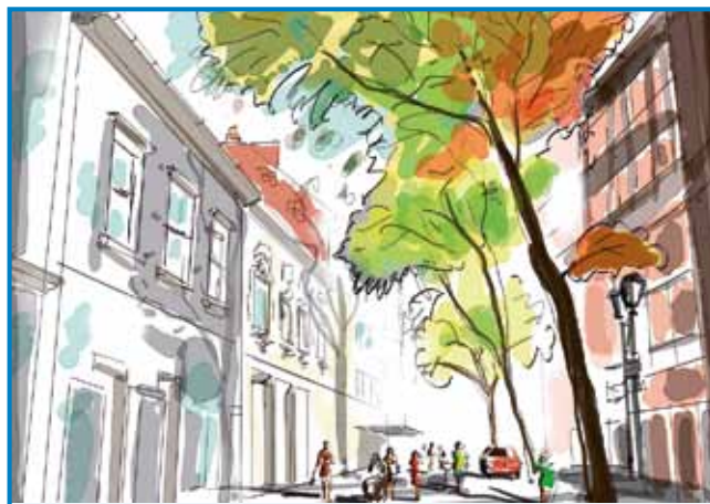
Po varašaj na cejлом svejti je temperatura vleti vsikdar višiša, dugi kedni minéjo brezi deži - zavolo toga trpijo drejve tō, štere brezi vodé ne morejo laditi luft

vsikdar več od nji de se spakivalo v varaše. V tej mejstaj de vročina eške vekša gratala kak indrik, zatok bi bilau trnok potrejbno, aj drejve žive ostanejo. Ne smejmo pa pozabiti, ka v ici une tō nazajdržijo vodau, ne spiščavajo vō paro, tau znamenüje, ka ne ladijo več luft kauli sébe. Če ne morejo trpeti nauvo klimo, ne morejo pomagati lidam: betežne gratajo, dojlčijo svoje listke in mrgéjo.