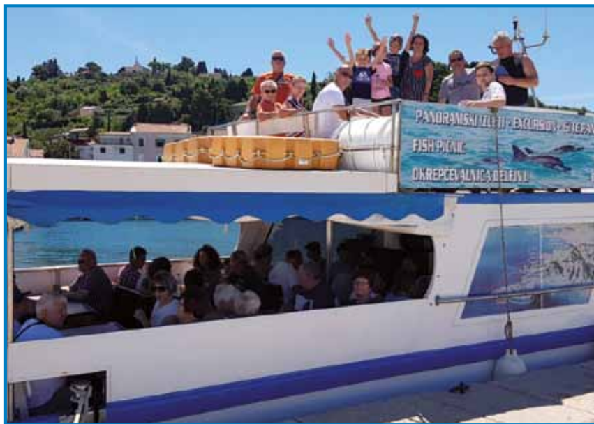
Vožnja z ladjico je bilo veliko doživetje posebej za otroke

terega je bila že takrat Marijina cerkev. Ta mala cerkvica je bila že od nekdanj romarsko središče Istre. Še danes obstaja običaj na predvečer Marijnega vnebovzetja. Takrat namreč Marijino podobo z ladjo v spremstvu več ladjic peljejo v Piran k cerkvi sv. Jurija. Gre za staro tradicijo. V nekdanjem samostanu je ško-