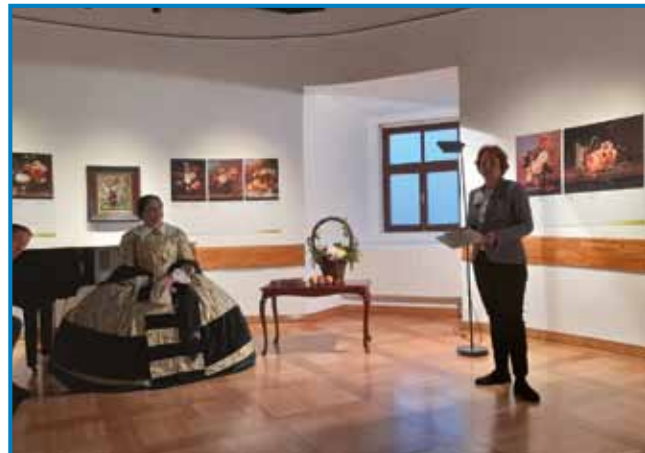
Detajl z otvoritve razstave

S trenutnim projektom Cvetlična kultura podeželja v Malem avditoriju Posavskega muzeja Brežice želijo razširiti sodelovanje z drugimi ustanovami ter pri-