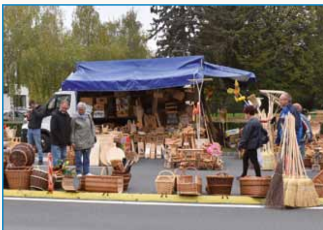
Vse je bilau po starom stran 3