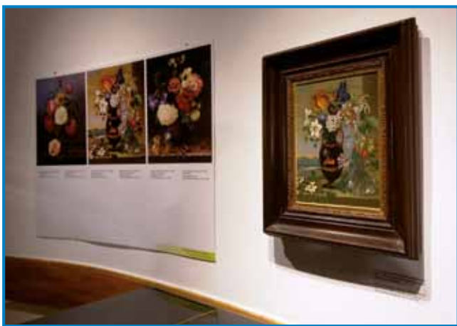
Del razstavljenih slik

Attems. Razstava na slikovit način predstavlja življenje in delo slikarke grofice Auersperg Attems (1816–1880). Njena likovna dediščina postane bolj razumljiva, ko jo postavimo v kontekst dosežene vrtnarske kulture, arhitekture, dogajanj v habsburški monarhiji in živlega zanimanja za novosti v širšem evropskem prostoru. Razstava sodi v projekt Cvetlična kultura podeželja, ki ga sofinancirata Evropska unija iz Evropskega kmetijskega sklada