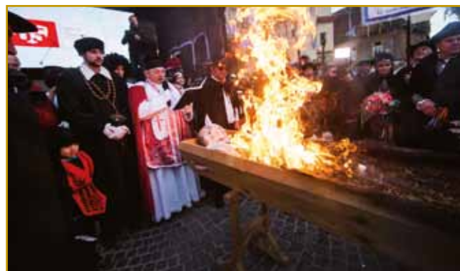
Na pokapanji Pusta vse tak vögleda, kak bi najbolje za istino šlau. Depa, vse vküper ne odide v zemlau. Voda, potok je njegva »zemla«, kama ga nut spistijo, ka tadale v Cerknisko jezero pride. Tam eške po svojoj »smrti« mora »dela« obrediti. Ranč tau pokapanje aj bi jezero varvalo. Ga varvalo, ka do kraja v zemlau ne odide, ka dun za lidi zavole rib ostane

Zatoga volo se megla začne delati, strera se doj v dolino spisti. Lidgé so tau indasvejta ovak razmeli, zaprav, so si tau po svoje tumačili. Tam nut copr-