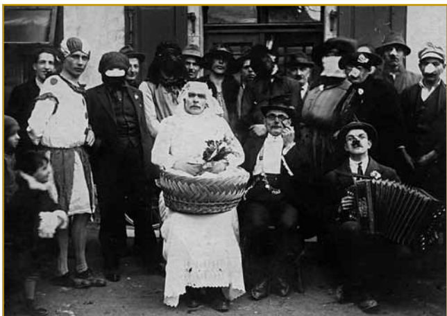
Ta fotografija je 1925. leta bila napravljena. Na njej se leko vidi, ka za nekšno gostiuvanje dé. Moški je nut v mladoženko (snejo) zrvnani. Po njinoj tradiciji se je skur neka takšnoga godilo, kak se pri nas na borovom gostiuvanju vej goditi. Depa, v Cerknici pa kaulak nje se tau malo ovak godi

Nazadnje smo po Cerkniskom jezeri ojdli, plavali, ribe lovili pa eške kaj smo vidli pa delali. Jezero je ménje po malom varaši Cerknica daubilo. Cerknici pa je cerkev ménje dala, tri v njoj stodjijo. Dokumenti nam pripovedajo, ka od prve njive fare leko že od leta 1040 tadale gučimo. Depa, na brgaj kaulak gnešnje Cerknice so eške bole stare grobe najšli. Nin 2000 lejt nazaj so že lidge svoje pokojnje tam pokapali. Tau v čas antike spadne, že 600 lejt po tejm so skrak tej grobov arheologi od naši stari Slavov grobe najšli. Ja, od toga pripovedamo, kak je krajina lidam že od inda leko vse tisto davala, ka njim je za življenje trbelo. Gnes je Cerknica nej samo po svojom rej-san atraktivnom jezeri poznana. Že od inda se v njoj pa kaulak nje na fašenski čas dosta vsega godi.