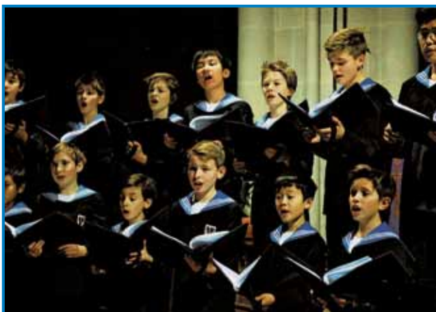
Zbor Dunajskih dečkov/Wiener Sängerknaben danes.

živel na Dunaju ter tam uspel, umrl in je v stolnici sv. Štefana tudi pokopan, je ves čas ohranjal tesne stike z rojstno deželo. Spomini nanj še kar trajajo: njegov grb danes krasí novoustanovljeno škofijo Novo mesto (2006 →), po njem se imenuje Konservatorij za glasbo, ki deluje v okviru novomeškega Zavoda Friderika Ireneja Barage. Po Slatkonji se imenuje nagrada za novo liturgično glasbo, ki jo od leta 2000 podeljuje dunajska nadškofija. V Novem mestu pa so prav v letošnjem jubilejnem letu izdali spominsko knjižico o Slatkonji, ki jo je ure-