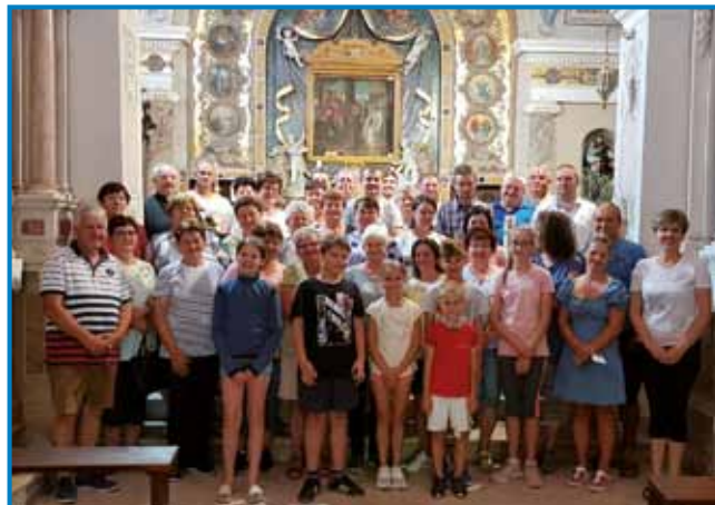
Gornjeseniški romarji po maši na Brezjah