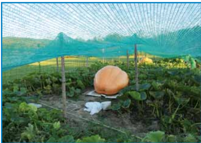
Buča, ki sta na vrtu zasedli veliko površino, je gojitelj zaščitil tudi z mrežo proti toči

Imel je prav, saj je z večjo bučo zasedel drugo mesto,