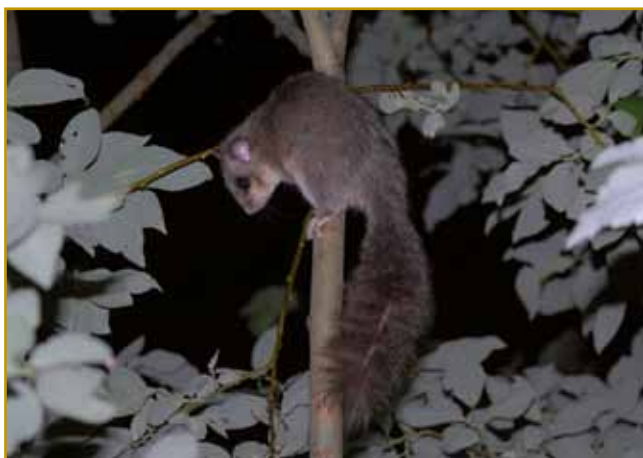
Polh skur tak dugi rep ma, kak je njegovu tejlō dugo gé. Ranč v krajini Notranjska, od stere pripovedjamo, ga na velke lovijo. Ta »djaja« se polhanje zove. Kelko je poznano, prvi dokument od toga nam iz leta 1260 pripovejda

lidge vedli, kama ji paut pela, v gradi so si leko počinuali, kaj spili po pogeli tō. Depa, enoga dnejava v grad lagvi lidge pridejo. Nikšnoga poštvānja do drejv pa do divji živali