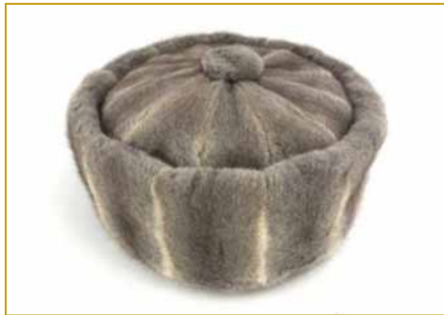
Zaprav ne pripovedjamo od klobūka, bole bi njoj kapa leko prajli. Depa, tau za gor na glavau dati vcejlak svoje menje ma: polhovka. Za njau kaulak 32 kauž trbej. Inda so iz nje eške kapute tō delali. Polhovka gnesnin kaulak 80 evronov pride, delač ta nazaj je »cejlo malo verstvo« je vrejndna bila. Baukše povejdamo, zvekšoga so jo samo djagri na polhe, polharji, nosili

Vej se, ka že stari Rimljani so je geli. Na Notranjskom pa kaulak krajine že od inda ga vōcvrejo. Tak mast dobijo, stero za vrastvo majo. Pravijo,