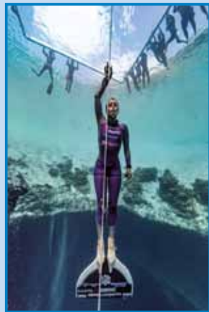
Tak Alenka Artnik po dobri trej minutaj samo z zrakom v svoji plüčaj nazaj »tagor« plava. Lepau se vidi, ka je vesela, znauva je najbavška. Kuman po svojom trestom leti je s tejm športom začnila

Nauvi klub pa si je Josip Jojo Iličič najšo. Legendarni nogometaš, indašnji reprezentant, je na Talskom nazadnje labdo brso. Tam si je rejsan velko kariero naredo. Nazadnje je pri Atalanti gole davo. V zadnji dve lejtaj je bole malo brso, puno problemov se je v njem nabralo. Depa, inda na »fuzbal pijaci« 22 milijunov evronov vrejen Iličič je tam svojo kariero zgotovo. Gnes je eno milijonko vrejen. Kak povejdan, nauvi klub si je najšo, nazaj v Slovenijo je prišo. Tau se je že eden čas čakalo. Nej samo eden klub ga je škeu za sebe dobiti. Na konci je k Maribori prišo. Depa, tau eške nej vse, ka se kaulak