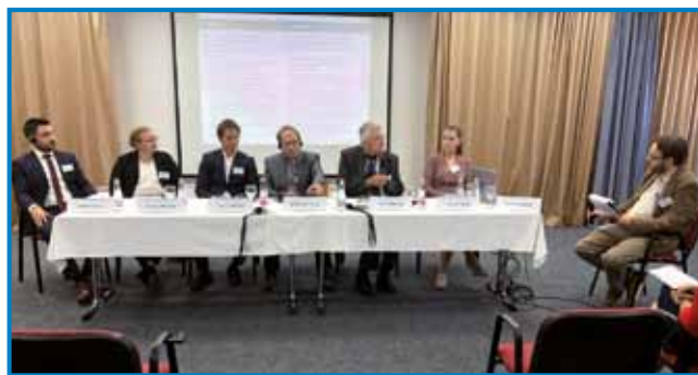
Tretji posvet foruma je bil namenjen pogovoru o demografskih izzivih - na njem so svoja stališča izrazili mlajši in starejši poznavalci problematike iz Porabja, Pomurja in širše regije

obe vladi pa bi se morali posvetiti razvoju infrastrukture na obeh območjih. Opozoril je tudi na prihajajočo recesijo, v kateri pa bo kljub vsemu po-