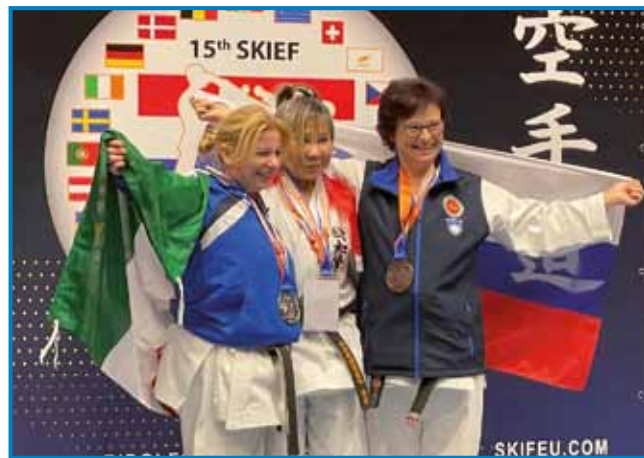
Tri najbaukše z letošnjoga evropskoga prvenstva v kataj, v starostni kategoriji od 55 do 60 lejt

paut so šli s kombiji, vej pa se je pokazalo, ka bi biu bus predragi: »V našom kombiji smo