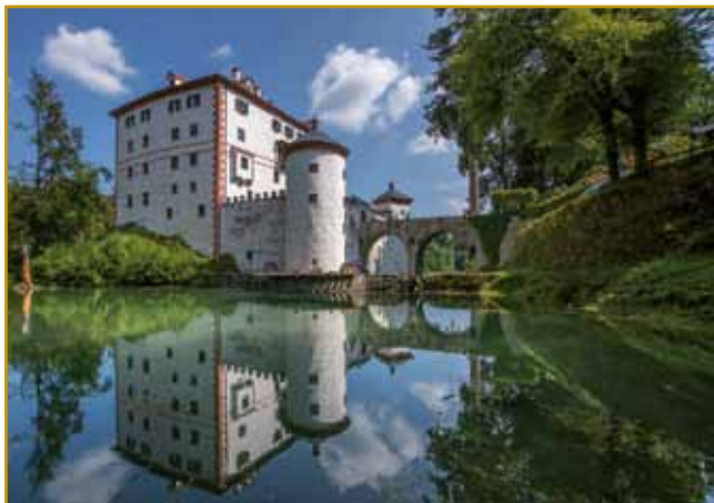
Istina nam pravi, ka na tom mesti že malo po leti 1000 so velki grad-trdnjavo zozidali. Tau je biu čas velkoga bitja, nauve dinastije so po zemlej segale. Sto je prvi stejne dau gor postaviti, se nej vej. Zaprav, nekšne teorije živejo, depa, neje najbolje gvūšno, kak aj bi bilau

prosili, aj je eno par v lidi spreobrne. Dobra vila ji poslūša. Tej »nauvi« lidge grad Snežnik gorpostavijo. Do ta eške velko pa šorko paut naredijo. Tak so