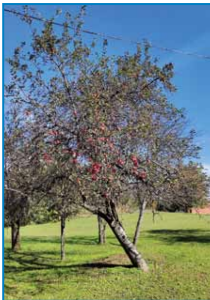
Stare djablane so letos trno pune

»Krumpline, kukrcu, ajdo, kapüsto, vse ka je zraslo na njivi, depa te je