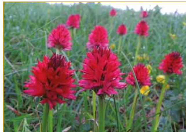
Eden od cvejtvō, steroga so lidge skur na nikoj djali, se rdeča murka zove. Na više kak 1000 mejtrov raste. Vse do oktāubra jo leko na Snežniki vidimo. Ovak pa murka nema samo takšo farbo kak leko na fotografiji vidimo. Na drugi planinaj vsikša ovakšo farbo ma: od blejdo rauzane pa vse do črne

ka takšnoga penicilina nega, ka vse leko od polha mast vōzavrači. Gnes se polha samo