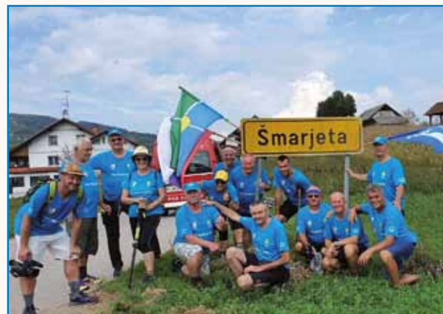
»Če maš v glavi vse popucano, te nika ne mauti« stran 10