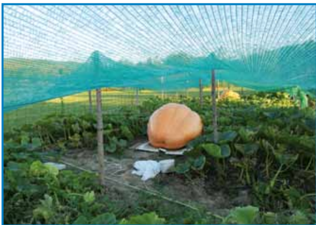
Bučí, ki sta na vrtu zasedli veliko površine, je gojitelj zaščitil tudi z mrežo proti toči

Imel je prav, saj je z večjo bučo zasedel drugo mesto,