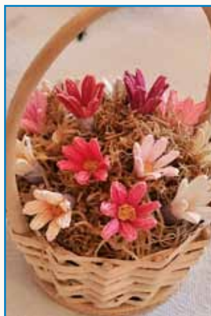
Rauže iz kreppapira ... stran 6