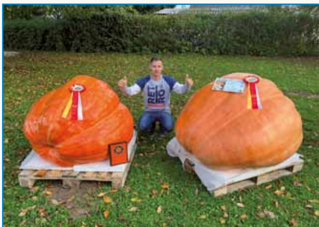
Obe buči sta bili nagrajeni stran 5

»DOVOLITE MI TOREJ, DA PRAZNUJEM, NOROST JE KONČNO UMRLA«