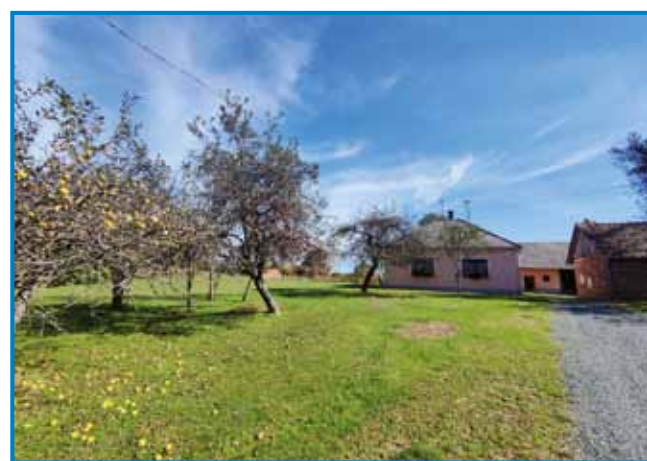
Čameštrna iža je na vrejeki Janezovoga brejga na trno lejpom mesti

»Kaj pa nej, graužge je bilau, s tistoga vino, sör smo pa na leto večkrat küjali, zato ka dugo je nej tastau.«