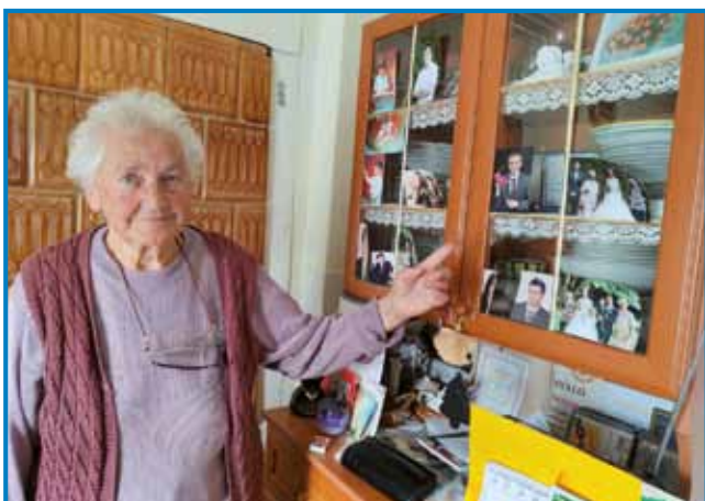
Majči néni pred kejpi, gda je družina mejla kakšne lejpe dogodke

»Rano, gda sem sedemnajset lejt stara bila, te sva se že zdala. Tak sem se vejn zato