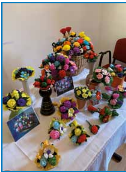
En tau razstave