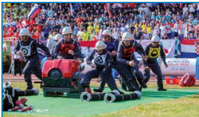
Korovski gasilci so bili trnok dobri, 4. na olimpijadi

»Naše društvo ma že dugo tradicijo, vej pa smo letos proslavili 120. obletnico svojo-