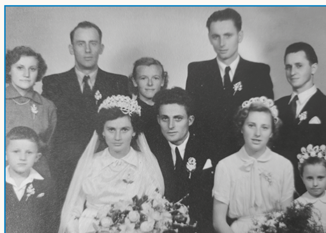
Gda sam ostanješ stran 8