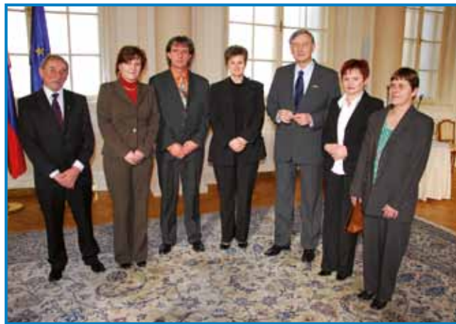
Leta 2012 s svojimi kolegi pa predsednikom Slovenije Danilom Türkom, gda je v Ljubljani dobila odlikovanje Red za zasluge