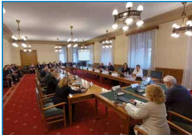
Člani Komisije Državnega zbora za narodnosti so se sestali v parlamentu