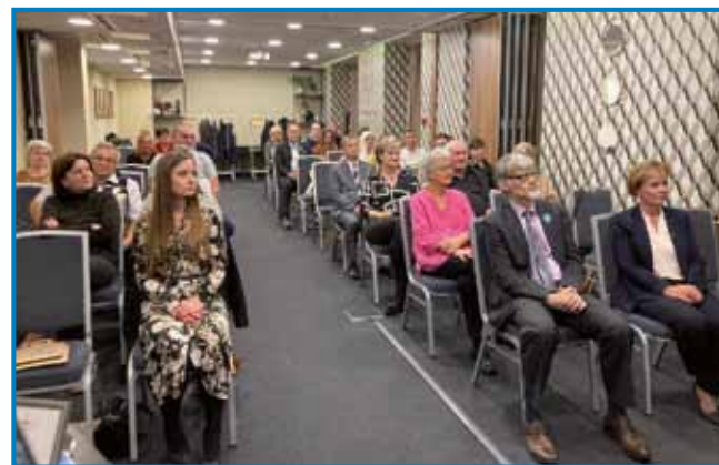
Udeleženci foruma v konferenčni dvorani Hotela Memories v Budimpešti

koščki sestavljenke in poudaril, da je vsak kos zelo pomemben, saj brez njega slika ni popolna. »Na zadnjem popisu leta 2011 nas je bilo 2820, zdaj pa lahko dosežemo število 4000,« je pričrčan predsednik DSS.