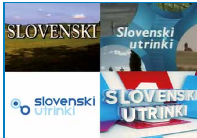
»Dragi moj sausad, posaudi mi kolau« porabska ljudska melodija v signalu oddaje ostaja že trideset let nespremenjena, zamenjala se je le grafična podoba magazina.

tudi danes. Je pa res, da je domačih dogodkov, ki jih prirejajo predvsem Zveza Slovencev na Madžarskem, Državna slovenska samouprava in Generalni konzulat Republike Slovenije v Monoštru, zmeraj več. Te organizacije so vesele, če pridemo poročati o njihovih programih. Poleg prirediteljev pa dandanes veliko pozornosti namenjamo na primer tudi gospodarstvu, kmetijstvu, turizmu, gastronomiji, likovni umetnosti in glasbi.«