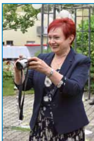
Nej je roka, liki rauka stran 6