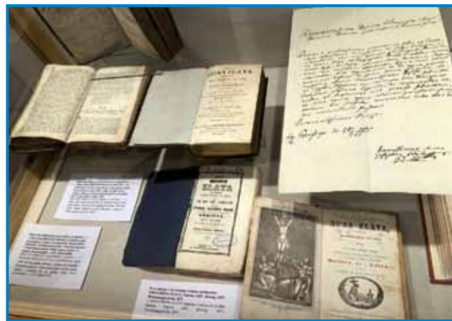
Več ponatisov molitvenika Nova Hizsa zlata in pismo, v katerem avtor prosi za cerkveno dovoljenje za objavo

materini smrti pa je bival v sirotišnici v Kőszegu. Želel se je izučiti za kirurga, usoda pa ga je odvedla na semenišče v Sombotelu oziroma kasneje v Győru. Kot župnik v Prisiki je