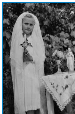
Tetica Majči pri prvom spauvedí pa na zdavanji