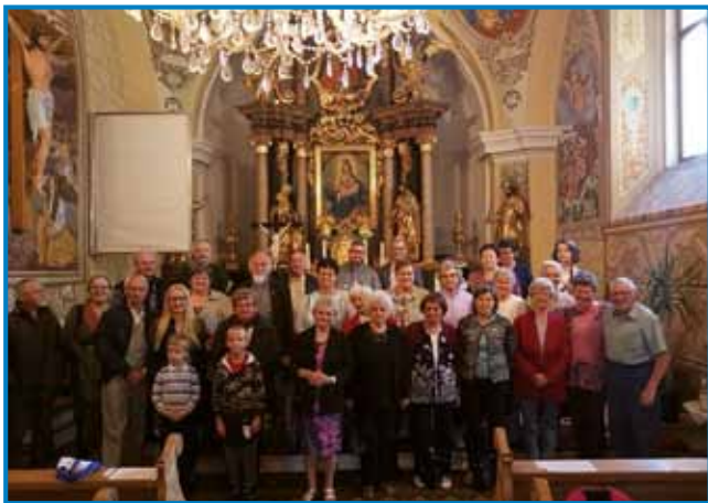
Romarji po maši v cerkvi v Dolencih