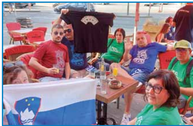
Slovenski in bosanski navijači v Kölni

malo več kak 144 metrov duga in malo več kak 86 metrov šurka. Tau je največša gotska cerkev v severom tali Evrope. Leko povejm, ka je bilau žmetno preoditi 533 stub, ali se je splačalo, tak ka je bilau tau rejsan eno velko doživetje, po sterom sam spila svojo najdrakšo pijačo na tom dopusti. Za 7,5 dcl glaž mineralne vode sam plačala skor 7 evrov. Prva kak sve se v ponejlek zrankoma odpelale prauti daumi, je v nedelo Slovenijo čakala ške tekma prauti Bosni in Hercegovini. Že v soboto sve se srečale s starim pajdašom Emirom, steri je prišo iz Sa-