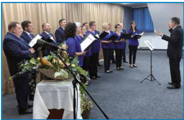
Mešani pevski zbor Avgusta Pavla ZSM z Gornjega Senika se že več kot tri desetletja udeležuje taborov slovenskih pevskih zborov v Šentvidu pri Stični, kjer srečuje tudi druge zamejske zборе.

sveta. »Prišlo je enajst združenj, od Švedske do Avstralije, od Sarajeva do srbskega Zaječarja. In seveda še druga društva iz Slovenije,« je povedala predsednica in pristavila, da so na četrti mednarodni pevski fes-