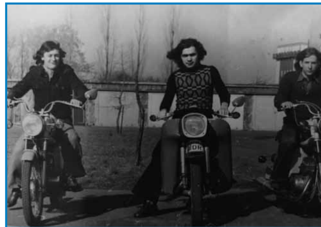
Podje so iz DDR-a večkrat prišli domau z motori

do Bulgarije, tauga so tak zvali, ka Meridian ekspres. Na taum cugi je telko lüstva bilau, ka največkrat si ranč dolasesti nej mogo. Bilau tak, ka smo se s fligarom pripelali, te smo se najprvin dvanaj-