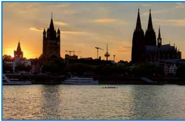
Večerni pogled na center Kölna