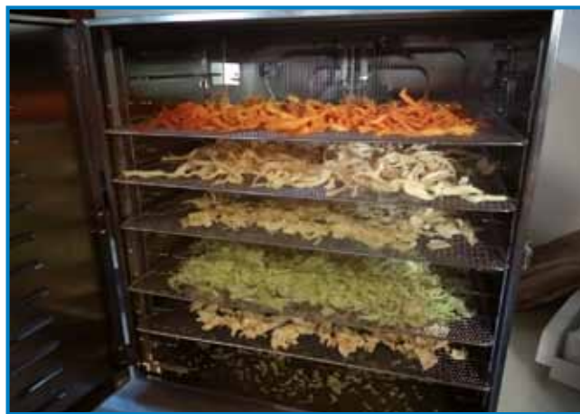
Zelenjave v sušilniku

kuhanju. Posušena jušna zelenjava brez dodane soli je kakovosten, enostavno pripravljen shranek za ozimnico, ki ga uporabljamo za pripravo vseh vrst juh,