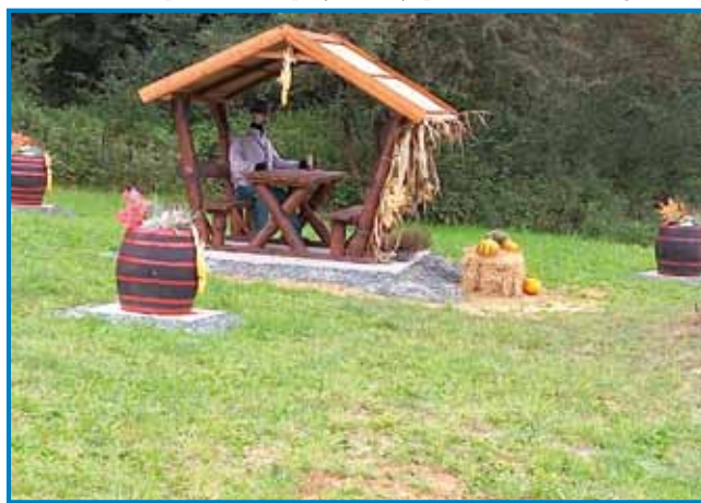
Okinčani park z djesenskimi pauvi, steromi se stari dejdek tü veseli s pivom v rokej

»Eštja več vse štjemo naprajti. Napravimo tašo mesto, gde bicikline leko dola postavi. Dja sam tak brodo, ka tak za 4-5 avtonov bi mesto naprajli pri pauti, stera z brga dola dé. Tablice tö vözbrodimo pa vösklademo. Leko vönapravimo mesto, gde mali odjen nalaužimo pa mo leko špekj pekli. Menši baur na prvi majuš (mlaj) tü leko postavimo, ka smo mi pri bauti že prejk 25 lejt postavlali. Malo