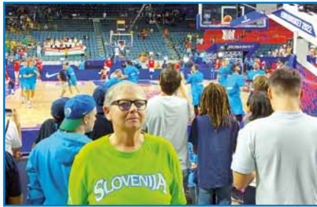
Tekmo med Slovenijo in Madžarsko sam si leko poglednola čista bližji igrišča

Stolnica svetoga Petra, stero so začnili zidati že davnoga leta 1248, je