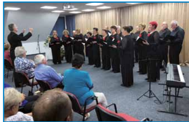
Korenine MePZ Ivana Cankarja z Vrhnike segajo v 70. leta 20. stoletja - v središču njihovega repertoarja so klasična zborovska dela in za njih uglasbena Cankarjeva besedila.