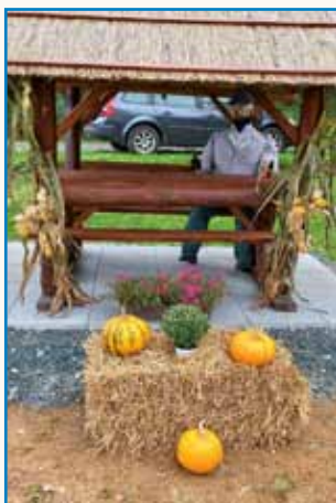
Aktivni Otkaučani za svojo lepšo ves stran 6