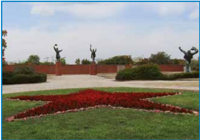
V Parki Memento vidimo skulpture, štere so na ulicaj Budimpešte dičile komunizem (na kejpi: Ostapenko, kapetan Steinmetz in spomenik Republike sovjetov)

Tam nutpokažejo zgodovino spravlanja z malimi mlajša-