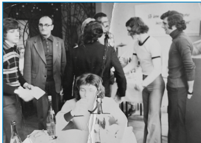
Naši podje so delali v DDR-i stran 8