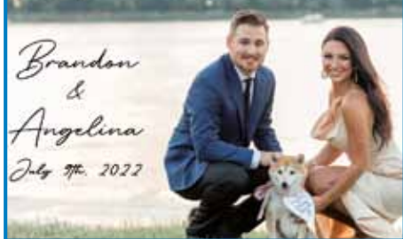
V ZDA smo šli na bratrančovo poroko

vati tja, na drugo stran sveta, da praznujem skupaj z družino poroko sorodnika,