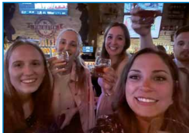
Vesela mladina z ene in druge strani »velike luže«

Ta pot mi je pokazala, da ljudje lahko ostanejo povezani tudi takrat, ko živijo več tisoč kilometrov daleč drug od