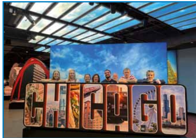
Stanovali smo pri sorodnikih v Chicagu

ke unikate, kot so deep-dish pica, Chicago hotdog, jedi na žaru in ogromno palačink ter krofov.