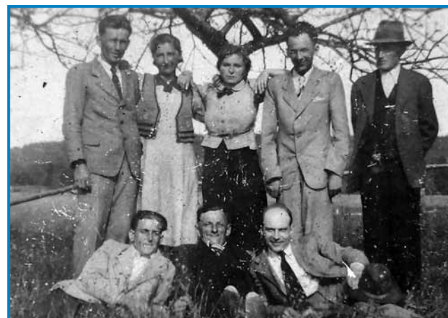
Indasvejta, gda so se lidgé dali slikati, so se oblekli v svoje najlepše gvante

»Zato so redli tjepe, aj majo za spomin, zavolo toga, gda so se doladjemali, vsigdar so se v