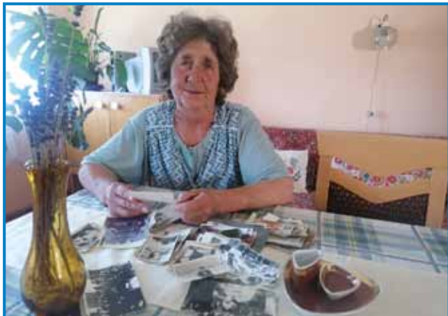
Kozaulin Ani iz Otkauvec

Pri Kozaulini Ani v Otkovci sem že dostakrat odo, dosta vse smo pripovedjali, depa