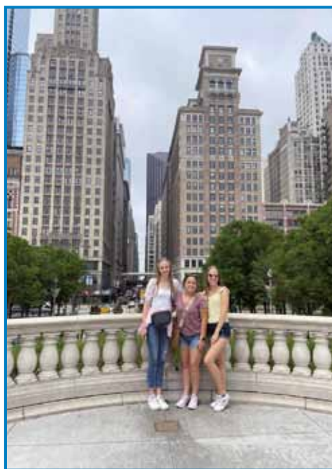
Sestro in sestrično pred džunglo nebotičnikov

hkrati pa odkrijem džunglo nebotičnikov.