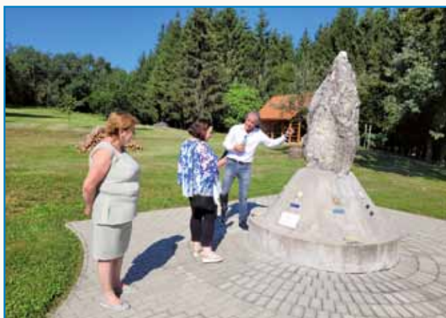
Slovenska skupnost v Porabju je morda res majhna, ampak dejavna stran 45