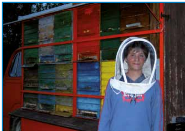
Gda je v osnovno šaulo odo, je biu tudi v fčelarskom krožki

ra Črta Lasbahera se je začnila že v njegovi deteči lejtaj. Prva je tak brodo, ka de špilo bas pri