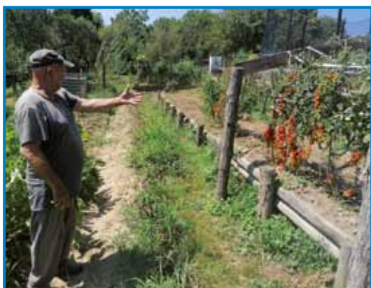
Paradajsi visijo pa zrejljo kak grauzdje

»Vsikši keden se pelam, če se srečam s kakšnimi spoznanci, te malo parklajamo, povejmo