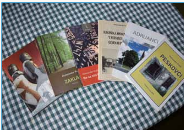
Zgubljeni čas in Tri goričke zgodbe stran 4