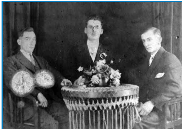
Kejp iz Merike, na pravoj strani oče, steri se je v Brooksvilli naraudo

za zidara v tašoj šauli, gde se je dvejdzero mlajšov včilo. Vejš, ka tam je zato ovak bilau kak doma, dostavse si se leko navčo, kak dobro tak lagvo tö. Depa tau gvüšno, gda sem odtistec nazaj domau prejšo, dosta več vse sem znau od življenja pa vse kaj drügoga kak moji vrstniki, steri so doma