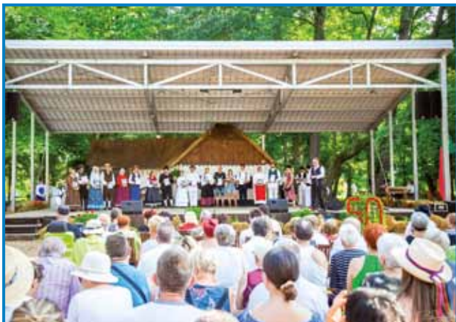
V Böltincaj majo nauvi oder, steri ma tudi strejo

fejst teko švic s čela, vseeno je na festivali vse do konca bilau veselo. Po svečani povorki nastopajočih je biu v nedelo zadevčarka na redi glavni tau svetka slovenske folklore. Paul leg domanjih plesalcom (KUD