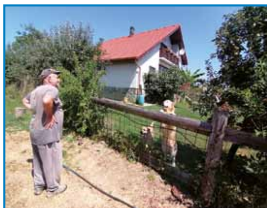
Joži ma trno rad svoj »ranč«