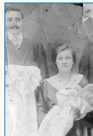
Nej gvant, grünt stran 8