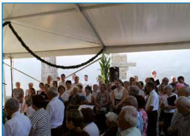
Petstan lejt cerkve sv. Ane v Boreči stran 6