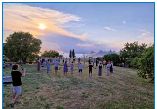
Pridi, zapleši z menoj

Ob takšni zgodovinski izkušnji izolskega mesta po nekem srečnem naključju pride do prepletanja med naravo in umetnostjo, ki samodejno vpliva na naše estetske potrebe in ob