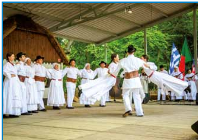
Na glavnom tali svetka slovenske folklore je zaplesalo osem folklornih skupin

vom Tudi to je festival, na steroj je notpokazanih 80 kejpov, stero je zadnji 25 lejt v svoj fotografski objektivi zgrabo Janez Eržen , je spregučala tudi ministrica za kulturo Asta Vrečko . Ministrica je pravla, ka té festival ne združuje samo tradicije in kulture domanje krajine, liki na njem že leta in leta sodelüvlejo tudi skupine iz tihinskoga. »Nega dosta prireditev, stero bi v Sloveniji mele tak veliko tradicijo kak té vaš festival, steroga pripravlate že od leta 1969,« je