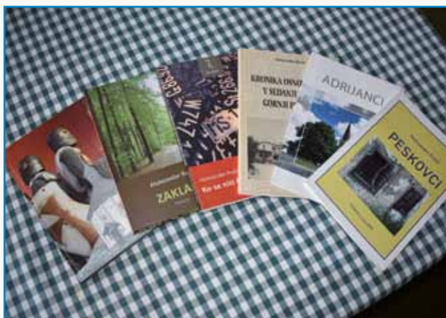
Zgubljeni čas in Tri goričke zgodbe stran 4