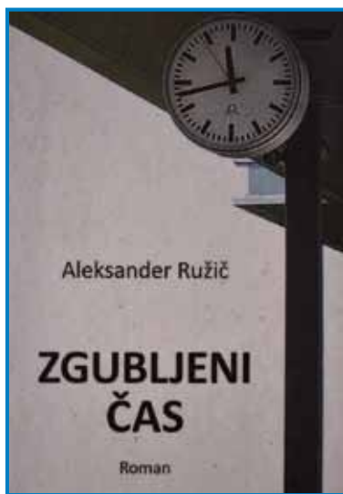
Roman Zgubljeni čas je postavljeni v cajt devetdesetih let preminaučoga stoletja

vnük, steri ga dostokrat obišče. Jožek ma vse materialne dobrine, vej pa njemi stariša küpita vse, ka si zaželej. Čiglij ga mata radiva, pa nemata cajta za njega. Dejdek vnüki davle dobre tanače in ga tudi vči, ka more poštvüvati druge lidi. Pauleg toga dejdek, steri je tudi fejest vören, furt gda ma Jožek kakšen problem, najde citat iz Svetoga pisma in ga njemi prešte. Bistvo te zgodbe je