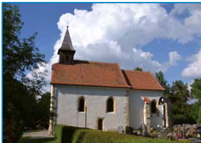
Cerkve sv. Ane v Boreči se nahaja v trno lejpom naravnem okolji

je leseni strop, pokrita pa je bila s slamo. Skozi leta so jo večkrat obnavlali pa predelali. Tüdi toj cerkvi so Törki dosta kvara naredli, vej je pa čista dojzgorela.