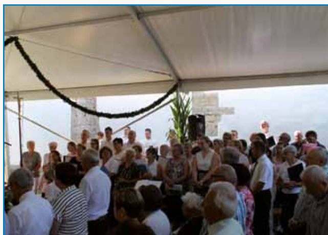
Petstan lejt cerkve sv. Ane v Boreči stran 6