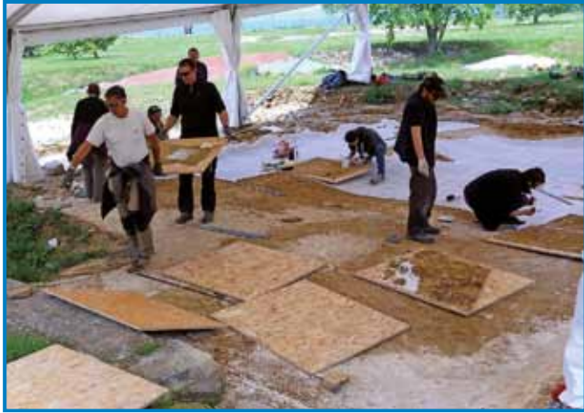
Arheologi pri delu

Skorajda ne dvomim, da bo marsikoga v tem poletju iz Porabja vzel v svoj objem primorski svet oziroma slovenska obala. Tako kot sleherna pokrajina v naši deželi ima tudi življenje ob našem morju veliko zabavnih in znamenitih točk, ki si jih je vredno ogledati.