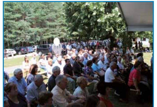
Zbrani vörnicke ob praznovanji 500-letnice