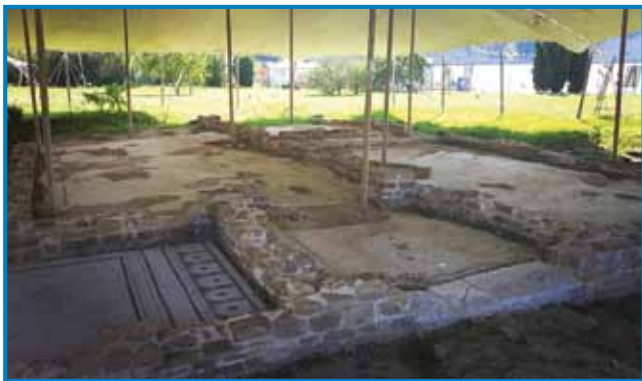
Ostanek rimske vile

Po čem je Izola tako specifično, obalno mesto? Nedvomno po svoji daljnosežni zgodovini, ki ji je pri tem še posebej