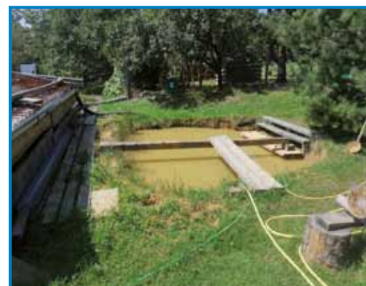
Mlaka pri rami

»Nej samo oča, mataré družina je tü vanej bejla, edna v Bethlehemu, drüga pa v Brooksvilli. Obadvej družine sta pred prvov svetovnov bojnov odišle