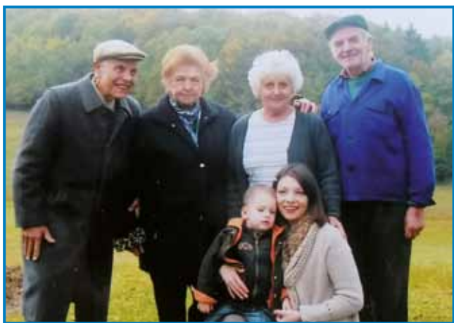
Z možaum pa žlatov

ona mena kröj pa vse, ka mi trbej, iz baute domau prinese, ona je moja sausedica. Gdakoli, če sem vanej, prejkpride pa lopau pripovejda z menov. Kelko kolikrat v Varaš dé, ona mena sir telefonira, če mi kaj trbej, vsigdar pravi, aj dolanapišem, pa te mi pri-