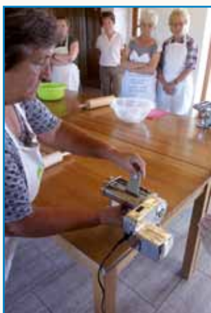
Izdelava suhih testenin stran 3

»STAREJŠI AJ PREJKDAVAJO VREDNOTE, MLADI PA AJ JE GORDRŽIJO«