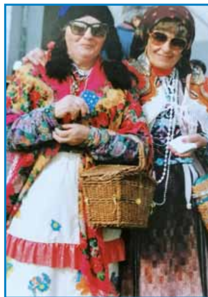
Na fašenek se je vsigdar rada notmaravnala

steroga zdaj se vozijo, vcejlak ovakši žmaj ma, depa zaka, tau ne vejm pa ranč tak so žemle pa kiflindje tü.