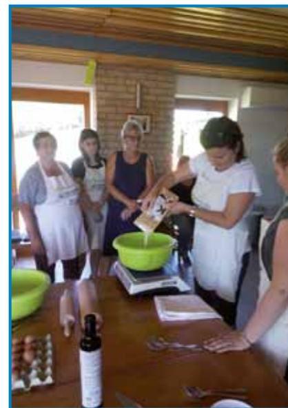
Delavnice se je udeležilo več gospodinjin in mladih

od nas. Kamut ali Khorasan je starodavna sorta pšenice, vendar se po lastnostih raz-