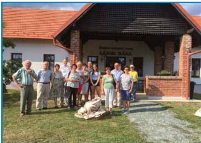
Žaba nas zove v Ižo müzg

Sombotelški Slovenci smo se 16. juliša podali na paut v krajino Órség, štera s slovenskim Porabjom vred sliši k Narodnomi parki Órség. Na trankaj in v gauščaj toga parka rastejo gna-