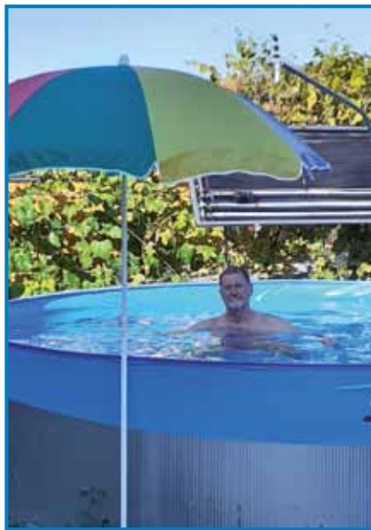
Aj dé lagvo, če more! Gda se tejlo pa düša leko vöspočineta

»Najprvim sem mali zid zožido pa té z lejti vsikdar malo na vekša, dočas sam starejši grato, sam na velko vözožédo delavnico, pri sterom so mi pomagali padaštje pa en zidar tü. Gda sem zéjdati začno, te mi je domanji krčmar možak Handjaštji Karči pra-