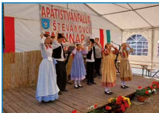
Folklorna skupina DOŠ Števanovci