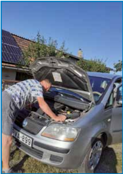
Med svojim delom, ka najraj pa z največšim veseldjom opravla

»Dja sam v firmi v Varaši začno popravlati avtone, to-vornjake za blagau, menše kombije pa vsefale drüdje mašine tü. Med tejm sam zgotovo šaulo za avtomeha-