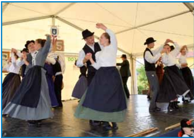
Folkloristi s Sakalauvec vsikdar s srcom zastopajo svojo ves, na štero so trnok ponosni