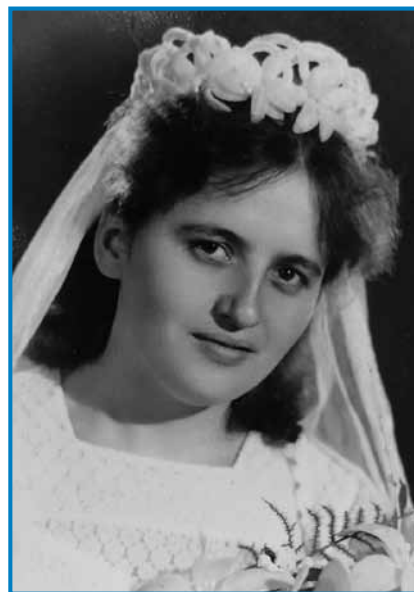
Magdi kak sneja

steroga zdaj se vozijo, vcejlak ovakši žmaj ma, depa zaka, tau ne vejm pa ranč tak so žemle pa kiflindje tü.