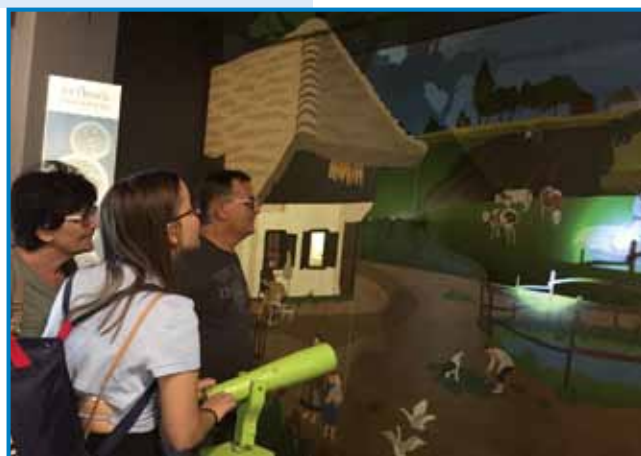
Držina Škaper s posvejtom poslušá, kak müče krava

ke rauže, gobe, drejva in lejčejo gnaki matürge pa vsefele divdjačine. V Porabji smo se tak cüvzeli lejpoj krajini, ka ranč ne vejmo, kakšno bogastvo mamó, šteroga indrik nega. Za toga volo odi k nam in v sausadnjo krajino Órség dosta turistov. Mi pa odimo v drüge krajine. Dobro bi bilau, če bi doma tó malo bole kaulikpoglednili, kakšne vrejdnosti mamó. Pri tom nam pomagata dvej razstavi: v Óriszentpétri Center za obisko-