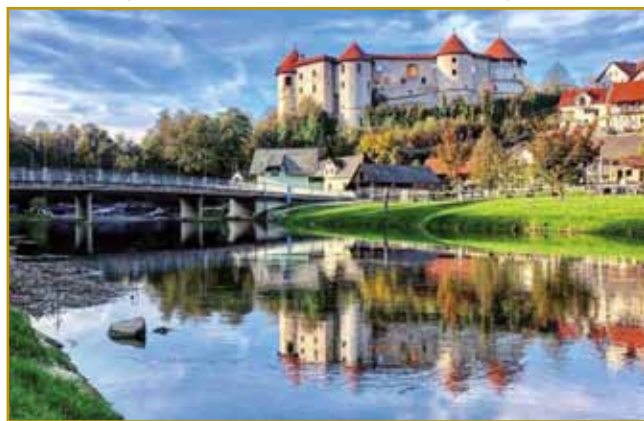
Žužemberk je stari varaš, ma bogato zgodovino. Na brgej više reke gnes grad stodji. Svoje kastelišče so na tom mesti že Kelti meli, steri so kaulak po brgaj železovo rudo (vasérc) kopali. Grad so začnili leta 1000 zidati, zvekšoga pa gnes tak vōgleda, kak so ga 1533 naprajli, kcuj zozidali. Pejnze so iz porcij na Törke daubili. Ja, pejnze so pobejrali, ka so se leko nji obranili. Nut v grad so Törki nigdar nej vdarili

eške eden takšen brejg se zdigava, Kurešček se zove. Njegvo ménje nam tō vse povej. Na tom 826