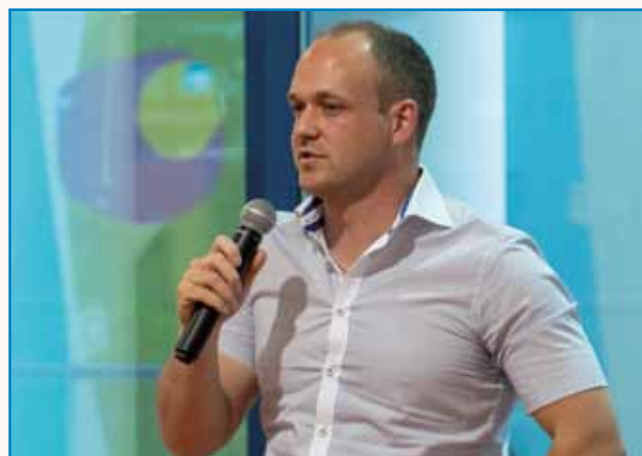
Stanovanje številka 27 stran 4