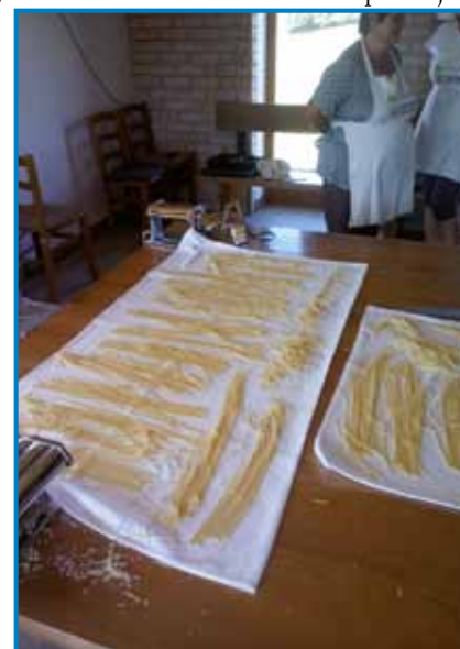
Izdelovali smo domače testenine iz pšenične, ajdove in kamutove moke

likuje od pšenice. Khorasan zrnje vsebuje več beljakovin v primerjavi s pšenico, bogato je z minerali, še posebej s selenom, cinkom, magnezijem in vitaminoma B in E. Za izdelavo testenin smo uporabljali