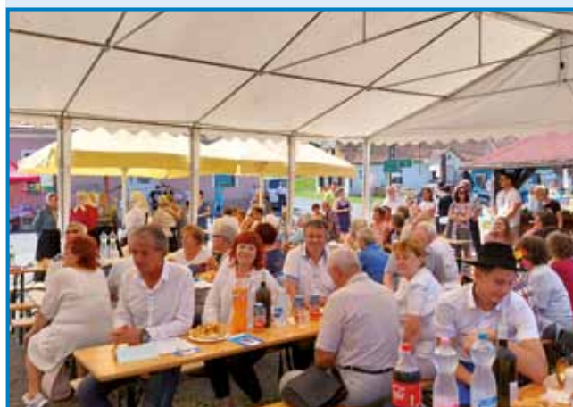
Program se je odvijal v velikem šotoru, ki se je lepo napolnil z obiskovalci