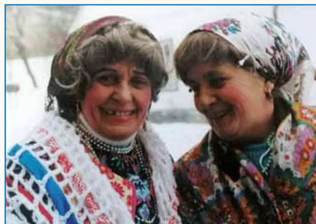
»Pridejo še taši časi ...« stran 8