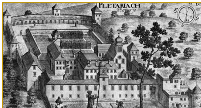
Na več kak 400 lejt saroj sliki pa nauvi fotografiji se lapau vidi, ka se samostan nej dosta spremeni. Tak je po tom začno vōgledati, gda so ga Törki 1471. leta gorvužgali pa so po tom skur cejloga mogli nauvoga naprajti. V tisti lejtaj so kaulak njega kuste stené dali zozidati, ka bi bejsni Osmani nej znauva velki kvar naprajli

velki ogen zakürili, ka se je trno daleč vido. Lidge so tak vedli, ka se morajo nekam skriti ali kama za zidove oditi. Na drugom kraji Dolenjske, že skur skrak Ljubljane,