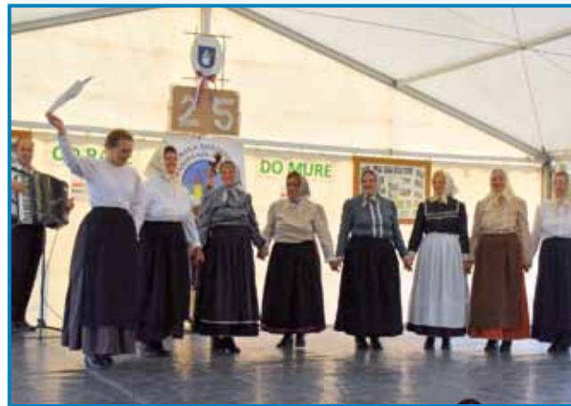
Folklorna skupina upokojenk ZSM je edina porabska folklor, v šteroj samo ženske plešejo

Na jubileji so gorstaupile eške tri gostujoče skupine. Člani goričanske bande »Što ma čas« so zaigrali tri pesmi, med šterimi