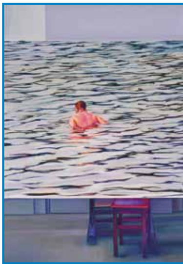
Slika iz cikla Kopalci