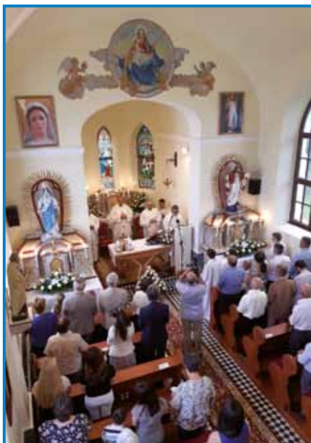
Sakalovska kapela, ki je bila zgrajena pred 100. leti, je bila od zunaj in znotraj obnovljena

blaženem stanju in s tem o srečanju dveh otrok, svetega Janeza Krstnika ter našega zveličarja, Jezusa. Cerkev je prostor, ki služi trem srečanjem: sreča-