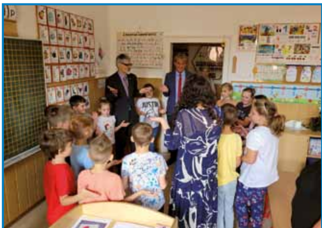
Veleposlanik Cencen z učenci gornjeseniške šole

kaj drugega. Potem bi jih pač usmeril v skladu z njihovimi interesi. Samo predlagati posamezne destinacije je pre malo, saj lahko na primer nekdo v določenem kraju izjemno uživa, spet nekdo drugi pa bi se dolgočasil, ker ga kraj ne bi pritegnil.«