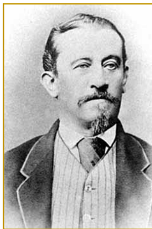
Josip Stritar 1836-1923

začnili. Za center te krajine Velke Lašče valajo, eni malo ovak pravijo, depa o tom malo sledi kaj več vöovadimo. Velke Lašče so nej ves pa varaš tö nej. Nin zmejs je leko dene mo. Po slovenski se takšnomi kraji trg pravi. Oprvin dokumneti o vejsi Sele, tau je prvo poznano menje, nam leta 1145 pripovejdajo. Kak zveškoga po cejlj krajini so Velke Lašče Törki tö večkrat gorvužgali. Kuman po tejm leko od trga s tejm imenom tadale pripovejdamo. Pravi jo, ka na mestaj, na steraj se telko lagvoga zgodi, pomalek začne vse dobro vörasti. Leko ka ranč zatoga volo so kaulak Lašč se tej velki štirge najšli. Ja, v Velki Laščaj se eden od nji nej naraudo, vse se je kaulak nji zgodilo. Depa kak eden mali center aj bi une Slovenske Atene bile. Po redej demo. Primož Trubar se je v Raščici pri Velki Laščaj naraudo. Fran Levstik v Retjaj pri Velki La-