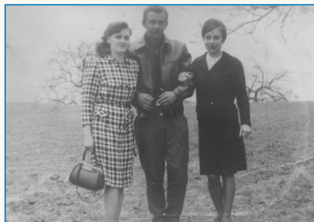
V Markovce pa Čõpance sva odla na veselice stran 8