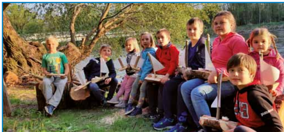
Najmlajša generacija »čolnarjev« z lesenimi ladjicami

jev Pomurja. V zadnjih dveh letih je bilo zaradi pandemije čolnarjenja po Muri manj,