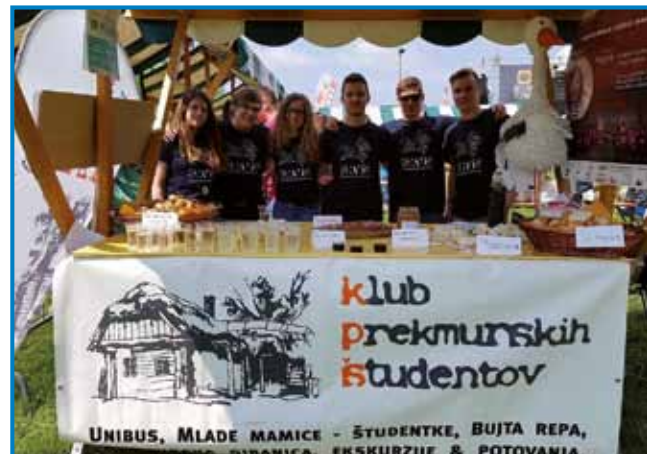
KPS, steri ma 300 članov, organizera dosta aktivnosti

Ovak pa je bilau eno lejpo doživetje tudi tau, gda se je leta 2019 odpravo na Jakobovo pout. Z eno pajdašico sta preodila celo, 800 kilometrov dugo pout, do enoga največših krščanskih svetišč na sveti, Santiaga de Compostele na severovzhodi Španije. »Tau je takša pout, na steroy se s človekom trnok dobro spoznaš. Če sva vidla, ka eden od naja nüca malo cajta za sebe, sva njemi tau tudi pistila. Če deš na takšo potovanje, stero je tudi raziskovanje tvoje düše, je dobro, ka si z nekim, s sterim se dobro razmejš,« je ške povedo sogovornik, steri je Jakobovo pout preodo v enom slabom meseci. »Čiglij je bilo vrauč, te tau ne mouti preveč. V glavej maš vsakodnevni cilj, oditi in oditi. Nejsam meu nekših vekših problemov, stero bi rešavo s tau hojo. Bole sam