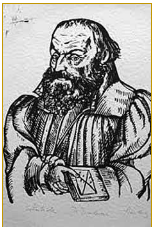
Primož Trubar 1508-1586

Primož Trubar, Jurij Dalmatin, Fran Levstik pa Josip Stritar so možakarge, zavolo steri so lidge krajino tak zvati