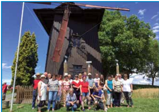
Mline na vŕter so nŭcali tam, gde je nej bilau vodé – slejdnjoga so sombotelski Slovenci gorpokskali v Staroj Gori