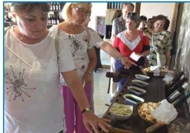
Ladno pa toplo stiskavani oli mata ovaško farbo – če štoj pride v Oljarno Kocbek, leko vsikšoga kaušta

V zidini nekdešnje šaule so domanji napravili eden mali etnografski muzej , v šterom nutpo-