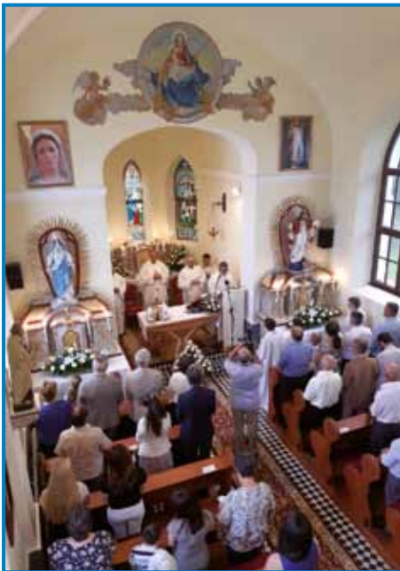
Sakalovska kapela, ki je bila zgrajena pred 100. leti, je bila od zunaj in znotraj obnovljena

blaženem stanju in s tem o srečanju dveh otrok, svetega Janeza Krstnika ter našega zveličarja, Jezusa. Cerkev je prostor, ki služi trem srečanjem: sreča-