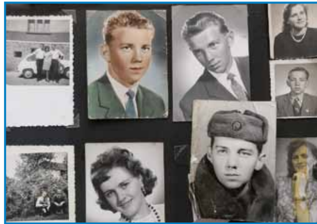
Ani pa mauž Karči v mladi lejtaj

- Če gledamo te tjejpe, stera lejta so bila tista, stera so najbola baukša pa vesela bila?