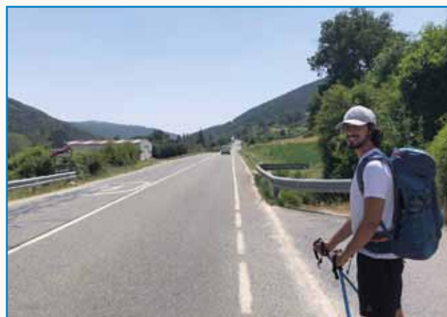
Ponosen je na tau, ka je Prekmurec stran 4