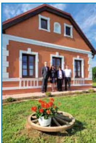
Imel sem priložnost... stran 2-3