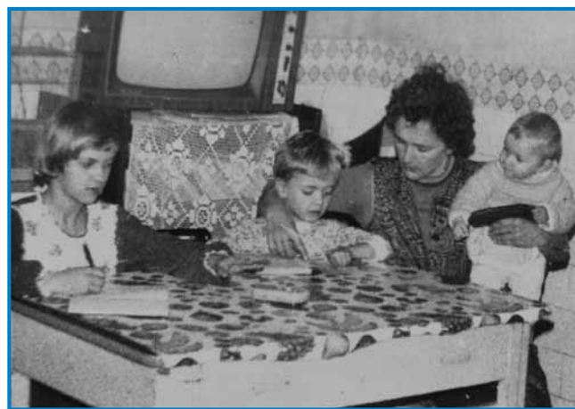
Ani kak mlada mati z Valiko, Tibinom pa Staziko

»Prvin samo tak, ka smo se kaulak nad Bajansenye pelali, če smo steli videti eden