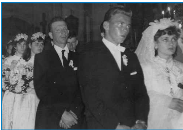
Zdavanjski kejп iz števanovske cerkve

»Tau so lejta na konci šestdeseti lejt bila, vejn te je bilau najbaukše. Te je dobro bilau kaulak gledati po vesi, vse so njive pa mazeve bile, puno lüstva je delalo kaulakvrat. Zdaj nikoga ne vidiš, vejpa cejla ves je vküpzarasla, odtec mi že nika ne vidimo, samo poštijo. Fejest žalostno je tau, če bi starci