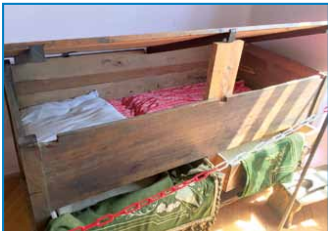
V muzeji v Staroj Gori majo eden »sto«, v šterom so spali tŭ – starejši vrkaaj, mlajši pa v spaudnji mali kištaj

Po kratkom pelanji smo prišli v malo prlečko vesnico Stara Gora , gde pauleg glavne pošti-