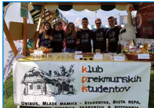
KPS, steri ma 300 članov, organizirer dosta aktivnosti