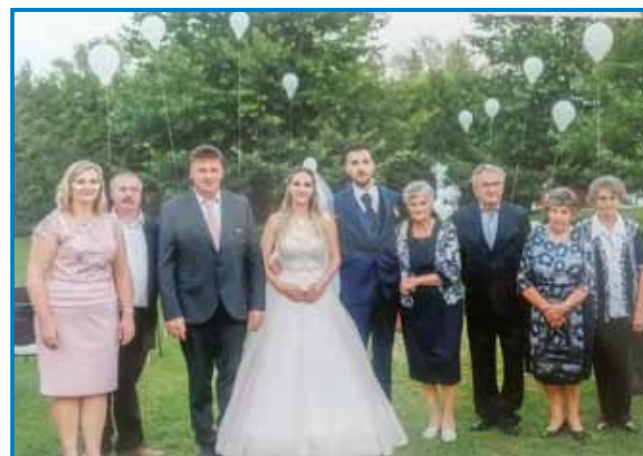
Na zdavanji vnukice

»Nejmam dosta, samo trinajset, depa mena telko dojda. Drugo pa tau, ka več ranč neštjem, zato ka fejst drago je sildje. Zdaj vleti je še kak tak,