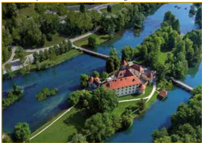
Otočec s svojim gradom je prava atrakcija. Ménje Otočec nam od maloga otoka pripovejda. Oprvin se od njega v dokumentaj 1252. leta leko kaj tapršte

Naše slegnje vandranje s čunaklinom po Krki smo v naj-