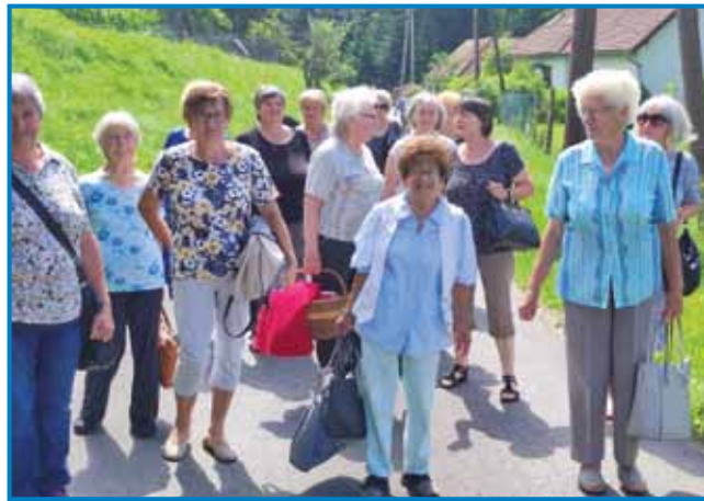
Od avtobusa do Iže jabolk smo pejski šli

Držstvo porabski slovenski penzionistov je 24. junija držalo na Gorenjom Seniki v Hiši jabolk »Veseli zadvečerek«. Člani predsedstva in pomočniki so se že rano sre-