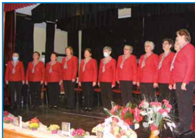
Ljudske pevke iz Žižkov so obletnico delovanja obeležile v vaškem domu v Žižkih

Ljudske pevke iz Žižkov, ki že vrsto let ohranjajo in predstavljajo glasbeno ter drugo ljudsko izročilo, so ob 20. obletnici svojega delovanja izdale pesmarico z naslovom Naša zapuščina. V njej je zbranih sto ljudskih pesmi, ki so jih nekoč peli v Žižkih in drugje po Prekmurju. To so pesmi, ki so se prenašale iz roda v rod, tako vesele kakor tudi žalostne, o ljubezni, delu, prijateljstvu ... Pesmarico je uredil in obli-