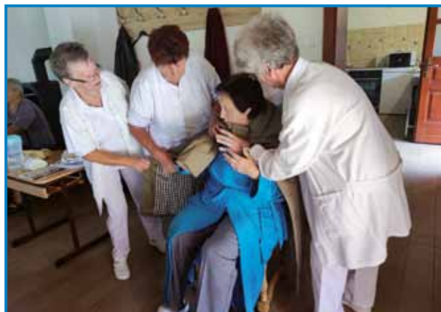
Veseli pajdaši so nam zašpilali igro Testament

S števanovskimi igralci vred je nas bilau 55. Finančno pomauč smo dobili od