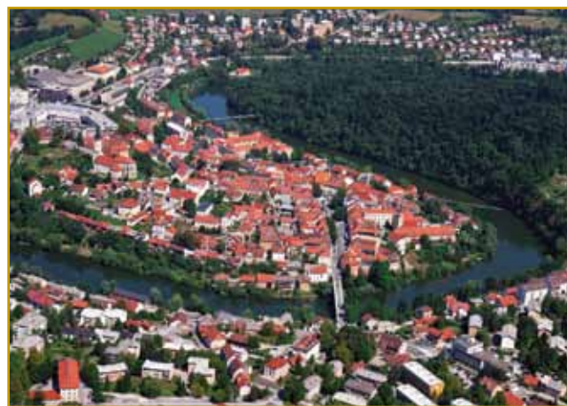
Rudolfovo ali Novo mesto se je nej samo za časa Rudolfa IV. Habsburškoga z lidami naselilo. Arheologija nam pripovejda, ka lidge so na tom mestu skrak Krke že od davnik živeli. Že 1700 lejt pred Kristusom so si lidge tü svoje mesto najšli. Za Novo mesto leko povejmo, ka najbolje bogato življenje je v tistom časi melo. Nin v Sloveniji se je do gnes nej kaj takšnoga najšlo. Ta bogata kultura stari lüstev, njivo menje nam je nej poznano, se v zemli vseposedi leko najde. Za njimi so Kelti pa eške Rimljani prišli. Slovenski karakter pa s starimi Slavi dobi, steri se skrak Krke kaulak leta 600 naselijo.

dobi, gimnazijo tö. Vse več včeni lüdi je dosta lejt po tejm do sprtolejtja v varaš pripelalo. Gnes je tau kak »novomeška pomlad« poznano. Gimnazija pa Slovenski narodni daum (prva takša organizacija na Slovenskom, 1873) sta bot-