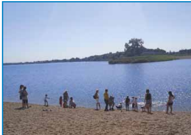
Ob soboškem jezeru

li smo se ob jezeru. Ker pa je bil dan zelo sončen in vroč, smo se hladili tako, da smo v jezeru zmočili noge, nekateri otroci pa so kar zaplavali.