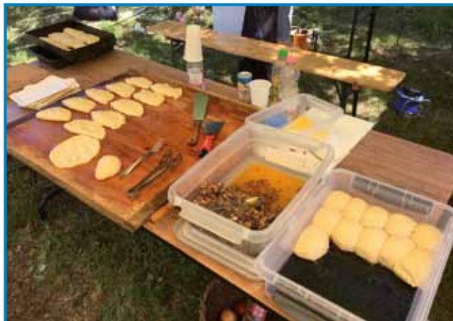
Ob igrišču so se pekle razne dobrote

pod naslovom Športni dan in vaški eksatlon, tudi sedaj menimo, da je bil ta dan praznik. Ne samo zato, ker je bilo nogometno igrišče – na katerem je bilo svojčas veliko tekem in bojov – v polnem siju, saj smo lahko po večtedenskem vztrajnem delu in skrbni pripravi terena udeležence in obiskovalce sprejeli v dokaj prijetnih