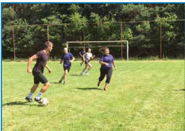
Nogometne ekipe so bile mešane

smo bili tudi zato, ker so naše delo priznali in pohvalili vsi prisotni. Dogodek je bil med letošnjimi prioritetami naše organizacije, izvedbo le-tega pa je omogočila finančna podpora, ki smo jo prejeli od Urada Vlade RS za Slovence v zamejstvu in po svetu.