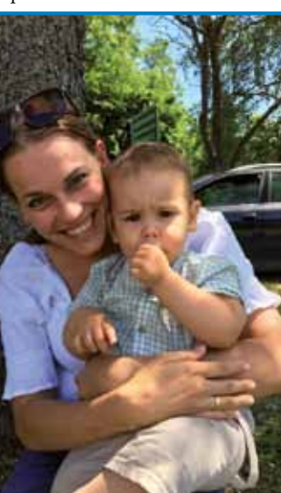
Mladi udeleženec srečanja

Društvo za lepšo vas in ohranjanje tradicije Števanovci je že dolgo časa načrtovalo organizacijo takšne prireditve – saj so bili podobni programi