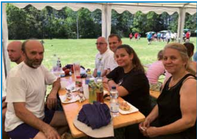
Domačini pod šotorom v prijetni senci

svojčas zelo uspešni – in smo bili zato posebej veseli, da so se naše večletne sanje v soboto tudi uresničile. Zadovoljni