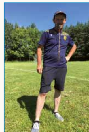
Športni dan ... stran 7