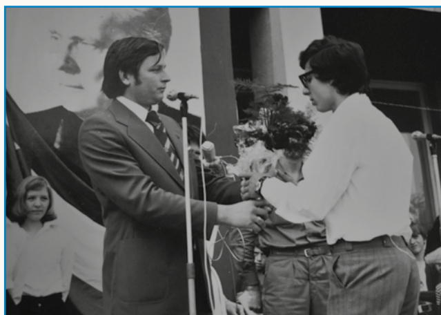
Lidge so dolgo v nauč v djarki sejdli pa so se pogučavali stran 4