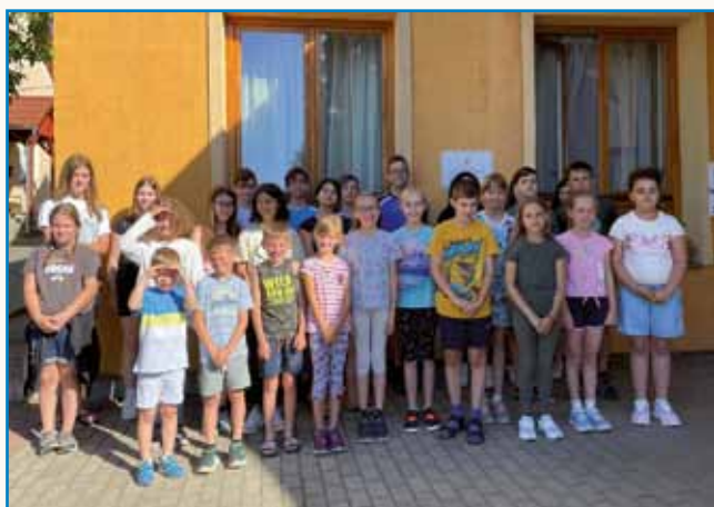
Ustvarjanje na vretenu, po navodilih v slovenščini stran 3