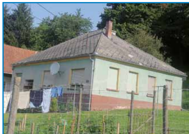
Iza stoji na tistom tali vesi, steroga Števanovčarge tak zovejo ka Graba

»Tau so naše, tak na silo dejo, ka že kaj ne vejim. Vse vtjūp-zrdijo, že kaj ne vejim, telko moram pucati za njimi, depa tau gvūšno, ka pri nas mūj nega, zato ka je vse spatjiva-jo.«