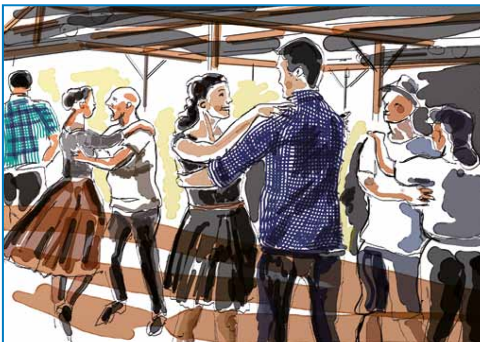
Čar petdesetletnega madžarskega gibanja »Táncház« je, da se folklorističnih srečanj z živo ljudsko glasbo lahko udeleži kdor koli – četudi »pade noter« z ulice

ljudske plesne. Postali pa so tako navdušeni nad vide-nim, da so se odločili ostati še tudi za novo leto. Plesalci z matične Madžarske so bili vajeni le izvedb odrskih postavitev, tamkajšnja prireditev z nazivom »táncház« (»plesna hiša«, druženje ob ljudskih plesih) pa je nanje naredila tako globok vtis, da so se odločili, da nekaj podobnega uprizorijo tudi v Budimpešti.