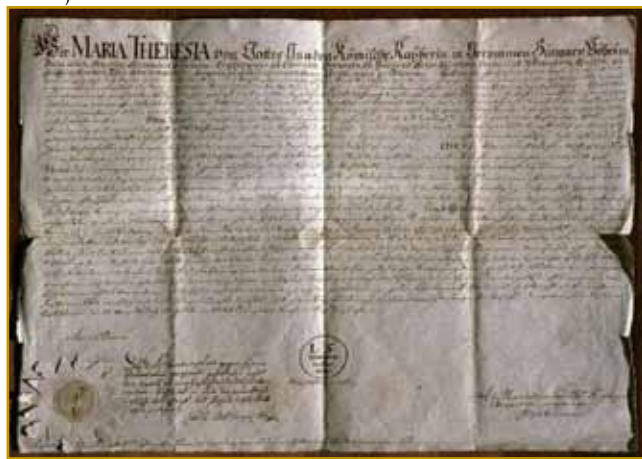
V muzeji se leko vidi dokument, s sterim je Marija Terezija zapovejdala, aj v Novom mestu s svojim delom gimnazija začne. Tau se je 3. novembra 1746 zgodilo. Prvo leto je v gimnazijo 66 pojbov začnilo ojditi.

Korošču pa eške kakšna bi se najšla. Gnes si samo leko