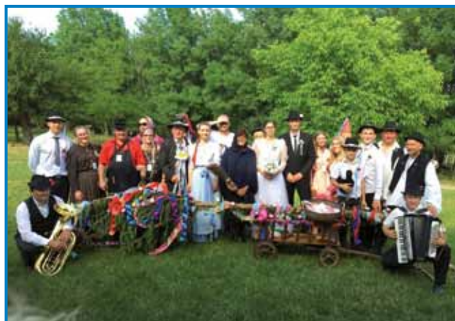
Porabski gostüvanjčarge v škanzeni v Szentendre

Porabsko skupino je na risausko nedelo čakalo vekše delo, ka so mogli nutpokazati nej samo šego borovoga gostüvanja, liki krajino tö, odkec so prišli. Zato