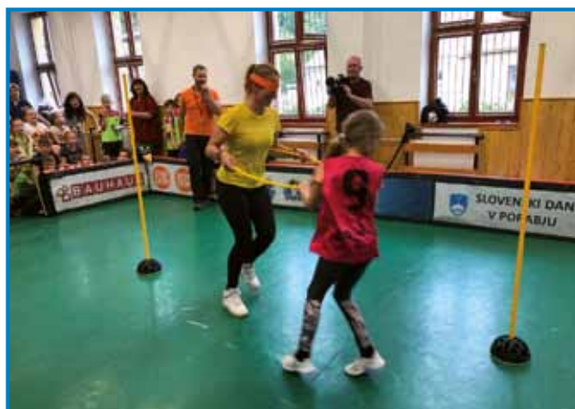
»Tudi vi, profesor!« – tokrat so tudi učitelji dopustili, da jih učenci vodijo z zaprtimi očmi

Namen sodelavcev Žogarije je tudi posredovanje občnih vrednot. »Za nas je fair play