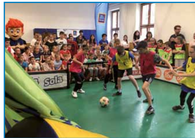
Glavna panoga Žogarije je nogomet tri na tri – v ekipah morajo biti tako deklice kakor dečki

»Vse, kar zastopa Žogarija, je zelo pomembno tudi za nas: pošteno obnašanje,