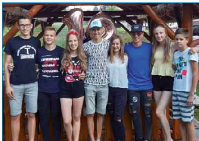
Želi, da bi kot Porabska Slovenka nekaj naredila za razvoj Porabja stran 4