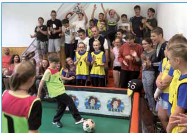
Ko v duhu fair playa navijamo tudi nasprotniku stran 3