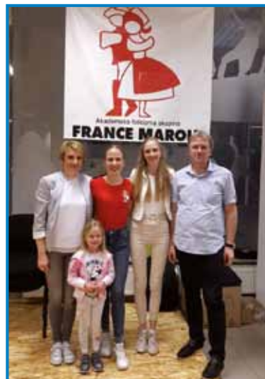
Mama, sestra, oče in sestrična so jo obiskali v Ljubljani, kjer so si ogledali tudi njen nastop z Maroltovci

smo Porabci živeli skupaj s študenti iz balkanskih držav, zato nismo imeli možnosti komuni-