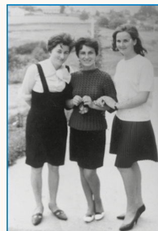
Parcetkorca stran 8