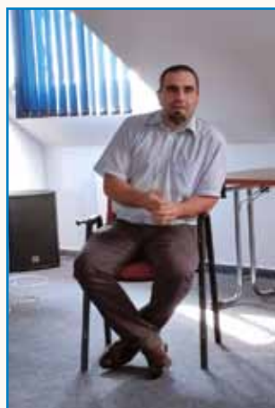
Psihiatrične motnje stran 7