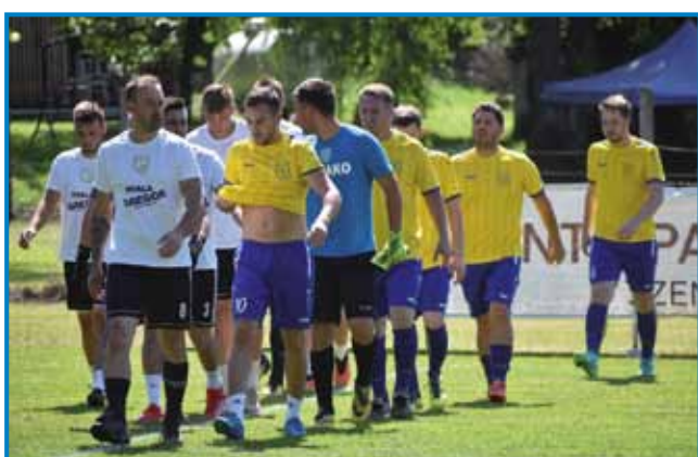
Fotbaleri iz Kruplivnika in Gornjih Slaveč dejo na igrišče. Ovači pa so na turniri ob že omenjenih špilale ške ekipe iz Večeslavce, Doliča in Krašč