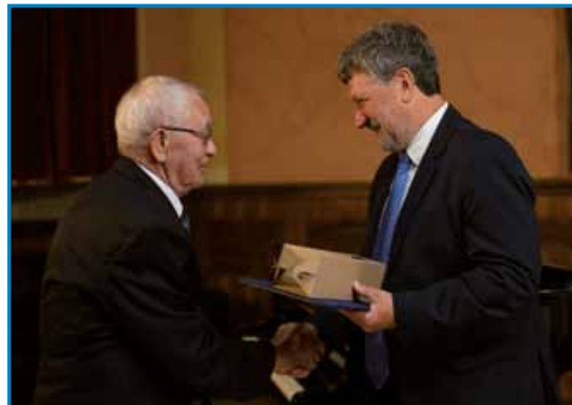
Nekdanjemu sakalovskemu učitelju diplomu izročá monoštrski župan

telj in vzor za nas. S svojim vztrajnim delom je mnogim mladim dal prihodnost. V okviru slovesnosti ob pe-