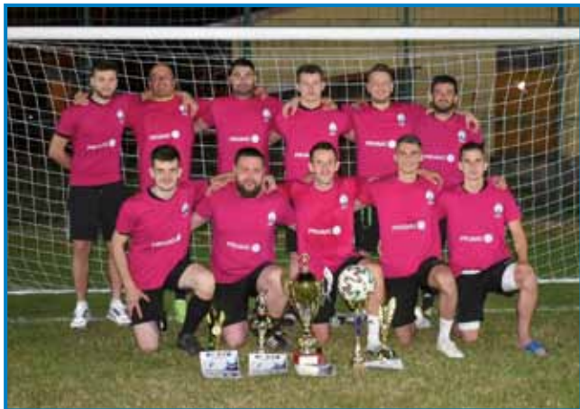
Senčarge so gviniili dva pokala, pauleg toga pa so daubili ške priznanje za fair play

baukši. Večer mo raztalali tak pokal za ligaško tekmo vanje kak tudi za gnešnji turnir. Vüepam, ka pridemo