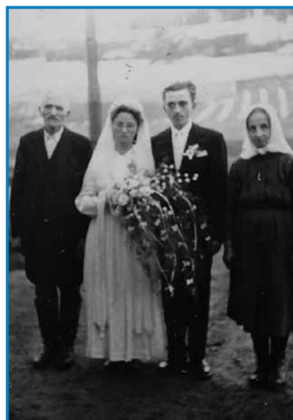
Na zdavanskom kejpi s starišami od moža

»V židano fabriko sem üšla delat, najprvin edno leto kak čistilka. Te sem edno leto tak vönjala, ka sem rodila pojba, gda sem nazaj üšla, te sem že v „cérnázó“