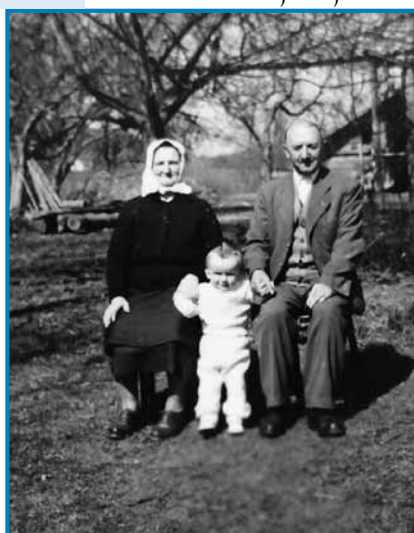
Njina mati z vnukico