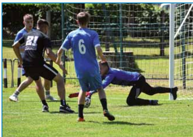
Senčarje so dvakrat zdignili pokal stran 3