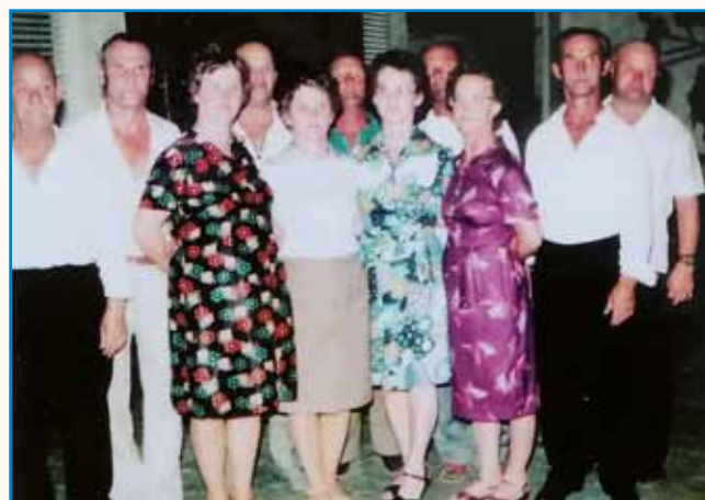
Gda rauže gledam, vse drügo pozabim stran 8