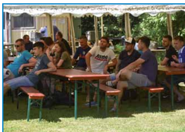
Pod šatorsko strejo je nej bilau tak vrauč kak na igrišči