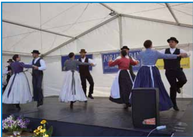
Gostje Porabskoga dneva so bili člani FS iz Cerkenjaka