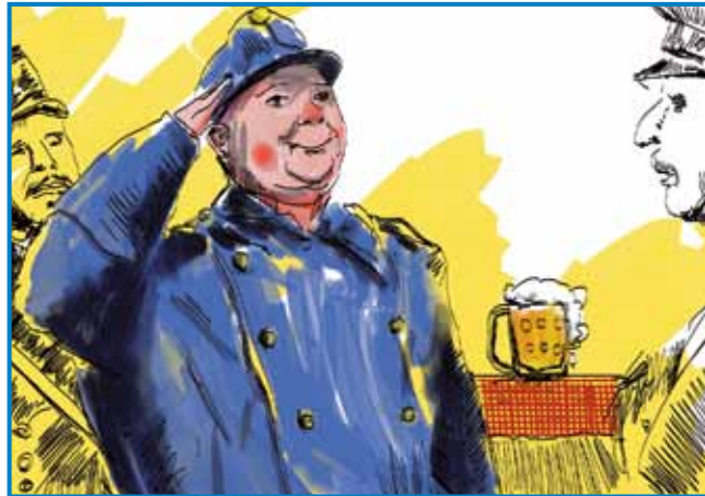
»Če je komi dano, ka ga obesijo, tisti se ne zalezé« - vrli sodak Švejk je baugo eške najbolje naure zapauvedi in tak grato najbolje eričen norc v literaturi

kivati v sodayijo avstro-ogrske monarhije, gde je med tivaršami in prejdjnimi najšo figure za svoj kisnejši roman. Za en malo je zbejšo prejk k Rusom (»veukim slavskim