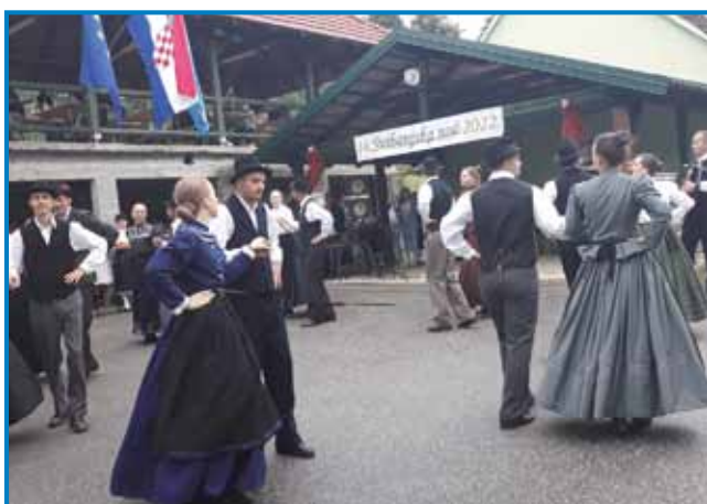
Kljub slabemu vremenu nam je nastop odlično uspel

Program je potekal v Cvetlinu, ki leži blizu slovenske meje, in se je začel s strelji lovcev. Potem so v kulturnem programu nastopile številne skupine, med njimi so bili pevci, plesalci in mažo-