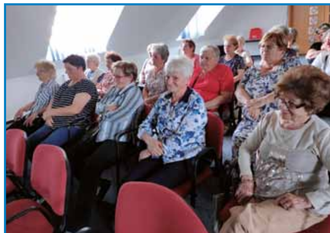
Skupina naši penzionistov

Kak leko njim pomagamo? Simptome moramo rano vpa-met vzeti pa nji k doktoru pelati. Na žalost, se s toga betega ne