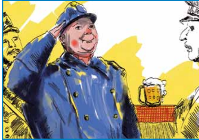
»Če je komi dano, ka ga obesijo, tisti se ne zalezé« - vrli sodak Švejk je baugo eške najbolje naure zapauvedi in tak grato najbolje eričen norc v literaturi

kivati v sodayijo avstro-ogrske monarhije, gde je med tivarišami in prejdjnimi najšo figure za svoj kisnejši roman. Za en malo je zbejšo prejk k Rusom (»veukim slavskim