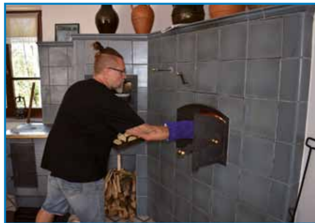
Nauva krüšna peč je bila naložena, v njej so se pekle domanje dobraute

»Dragi Slovinci, steri ste gnes domau prišli, vi dva dauma mate, eden je tö,