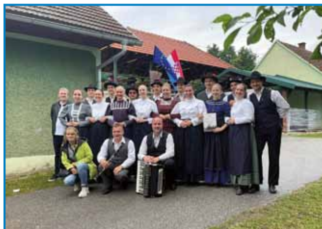
Sakalovska folklorna skupina je tokrat nastopila z osmimi pari

Zadnji vikend maja je bil za Folklorno skupino ZSM Sakalovci živahen, saj smo potovali na Hrvaško, da se udeležimo prireditve 14. mednarodne Svibanjske noči, ki jo je organiziralo Kulturno umjetniško društvo »Cvetlini zvon«.