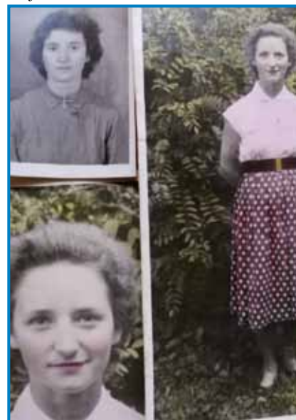
Njini portreti iz mladi lejt

»V židano fabriko sem üšla delat, najprvin edno leto kak čistilka. Te sem edno leto tak vönjala, ka sem rodila pojba, gda sem nazaj üšla, te sem že v „cérnázó“