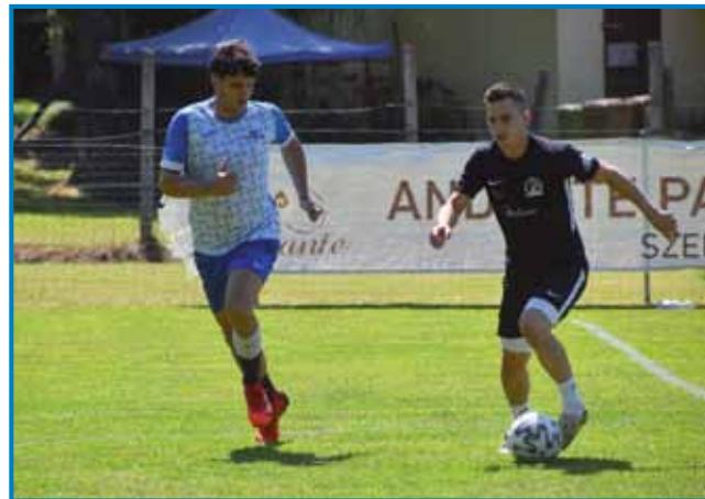
Domanja ekipa je špilala v čarni gvantaj (Kej: Silva Eöry)

na srečo domačinov so oni dali tri gole, mi pa samo dva. Na prvom mestu je tau, ka se družimo, rezultat pa