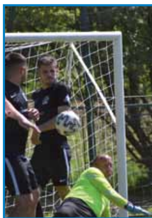
Gé je labda?