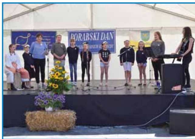
V kulturnom programi je spejvala mlašeča skupina Seničke sinice

lili tistim našim Slovincem, steri so od daleč »domau« prišli. Prišli so iz Pešta, Mosonmagyaróvára, Zalaegerszega, Kermadina pa bi eške leko naštevali varaše pa ve-