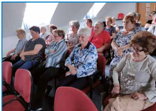
Skupina naši penzionistov

Kak leko njim pomagamo? Simptome moramo rano vpa-met vzeti pa nji k doktoru pelati. Na žalost, se s toga betega ne