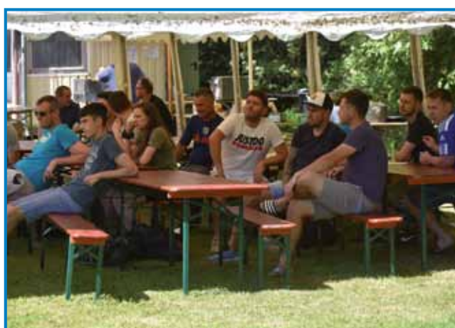
Pod šatorsko strejo je nej bilau tak vrauč kak na igrišči