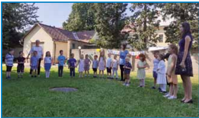
Slovo od vzgojiteljice Jutke

vse tvoje sodelavke in starši še enkrat iskreno zahvalujemo za prav vse. V življenja naših