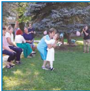
Teto Jutko so imeli vsi malčki radi

Draga Jutka, ob tej priložnosti se ti tako otroci, kakor tudi