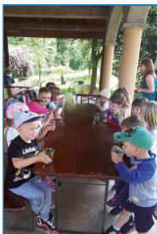
Z GORNJESENIŠKIMI MALČKI... stran 5