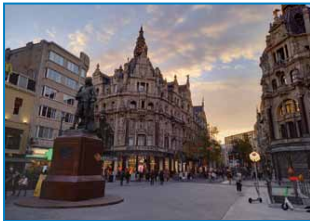
Antwerpen, kamor so hodili na izlete