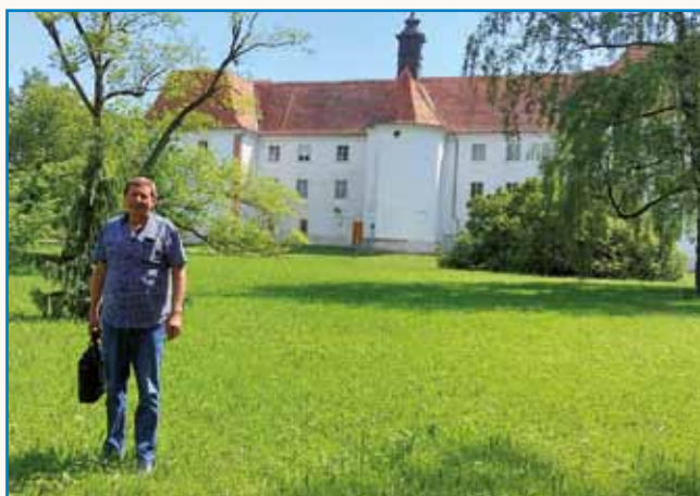
Zbiratelj, ribič, poznavalec zgodovine ... stran 4