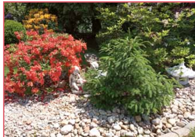
Raužam se vidi, ka njim senco delajo boričke pa djelensčki

»Najprvi rododendron je moja mati prištölala po interneti, tau moram prajti. Tistoga smo dugo meli nüt v ladi, ka smo se ga bojali vöposaditi, ka nam na nikoj pride. Te sam začnila šteti o tejm na interneti, tak sam zvejdl,