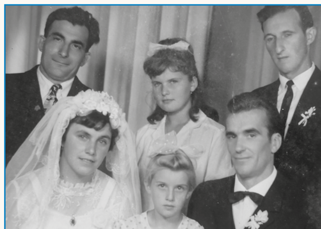
Vnoči smo gnoj trausili stran 8