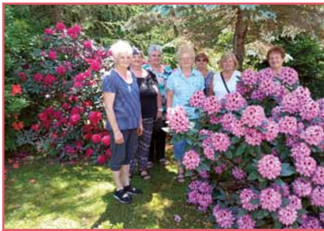
Ništrni varaški pa senički penzionisti med cvetečimi rododendroni pri Fickini na Gorenjom Seniki

»Nej, nej! Ge niše reklame ne delam, što gnauk pride, tisti tak šké kleti nazaj pridti. Ge tau ne delam zat', ka bi ge tau drugoma rada kazala, mi tau delamo, za nas pa za svojo düšo. Pa ge mislim, če se mi radüjemo, te aj se drugi tö