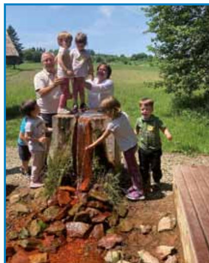
Otroci pri izviru mineralne vode v bližini Serdice

živali, in sicer kokoši, ptiče, ovco ter prašiča pasme mangalica z imenom Filip. Božali in hranili smo tudi zajčke. Pri tem smo se o vseh teh zanimivih živalih hkrati še veliko naučili. Sledila je ustvarjalna delavnica, na kateri so si otroci lahko naredili lep spominček za domov. Vsak otrok je izdelal svečko iz čebeljega voska in jo po želji okrasil. Ogledali smo si tudi muzej starih predmetov družine Kisilak. Zatem smo se povzpeli po visokih stopnicah na senik. Tam so otroci lahko videli še nekoliko drugačen čebelnjak, seno in