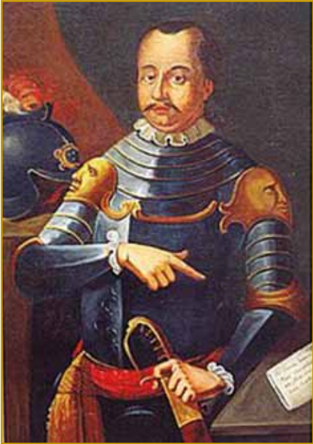
Slejdjen celjski grof Ulrik drugi je nej sreče emo. Nej sreče v lübezni pa ovak tō nej. Gnes si samo leko brodim, kak bi bilau, če bi ga nej tak lagrov bujli. Leko bi Celje tau bilau, ka je skauzi čas Beč grato. Ja, vse je tak vōgledalo

Keleja ali Killia tō so Kelti ménje dali svojimi varaši, iz steroga je skauzi čas Celje gratalo. Depa kakši 800 lejt po tejm je kak Celeia eške bole poznani biu. Tau ménje je svojimi varaši rimski imperij dau. Depa vse tau nam pripovejda, ka na tom mesti skrak reke Savinje že od inda so lidge živeli. Od toga nam arheologi leko povejo, ka vse so vō iz zemle skopali. V stari časaj pa je za Rimljanov Celeia dun najbolje cvetejla. Tau se je kaulak leta 50 začnilo goditi. Bogati varaš je tau biu. Zavolo svoje lepote, lejpi velki ramov so ga druga Troja tō zvali. Cele-