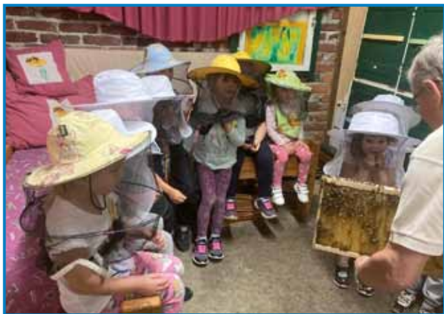
Gospod čebelar nam je odprl panj in nam pokazal čebeljo družino

tudi nekaj namiznih iger. Pred našim odhodom s kmetije so se otroci lahko še krajši čas poigrali na igralih, nato pa smo se odpravili še na ogled izvira mineralne vode, kjer smo se malce osvežili. Poslovili smo se od prijetnih domačinov in se lepih vtisov ter nekoliko utrujeni odpeljali