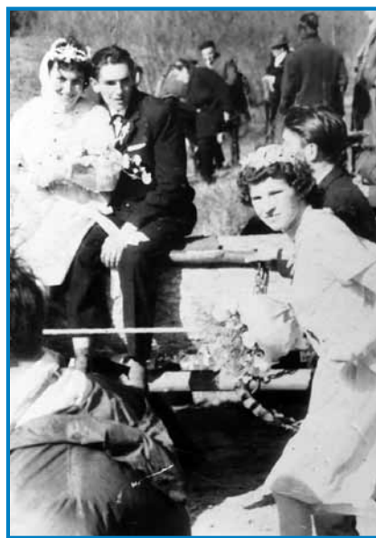
Kak sneja na borovom gostüvanji

»Z menov nikdar nej, če sem vnoči tjesnau domau prejšla z veselice, še te me je nikdarnej bašejktivno. Pa bilau tašo, ka smo že ranč nej vnoči, litji zaranka prišli domau. Božič je bejo, lüstvo je k meši, k zorjenici šlau, pa gda smo se z njimi srečali, smo se njim tak poklaunili, ka dober večer. Oni so na nas poglednili pa so nam prajli, kakšni večer da je že zranek. Depa tau je tū istina, tašoga reda, gda smo domau prišli, te smo nej ležat šli, litji delat ranč tak, kak če bi cejlo nauč počivali. Bilau je tašo tū, ka sva s Sejrina Irinkov vnoči gnoj razmetavala na njivi.«