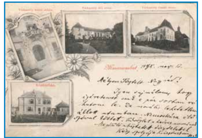
Najstarejša njegova soboška razglednica je iz leta 1898

je osto vse do tistoga mau, ka je ūšo v penzijo: »Zanimivo delo je bilau. Prva sam ške v pisarni delo, v zadnjom cajti pa sam biu cenilec premoženjskih škod in sam dosta po tereni odo. Lepšoga nega, kak po Goričkom oditi. Ne morem prehaliti té lidi. Nej so pitali, zakoj sam prišo, liki so me prvo pitali, ka mo djo pa piu. Tak je bilau. Mogau-