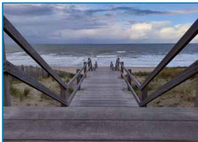
Ostende - Severno morje

- Ali razmišljaš o tem, da bi šel nazaj?