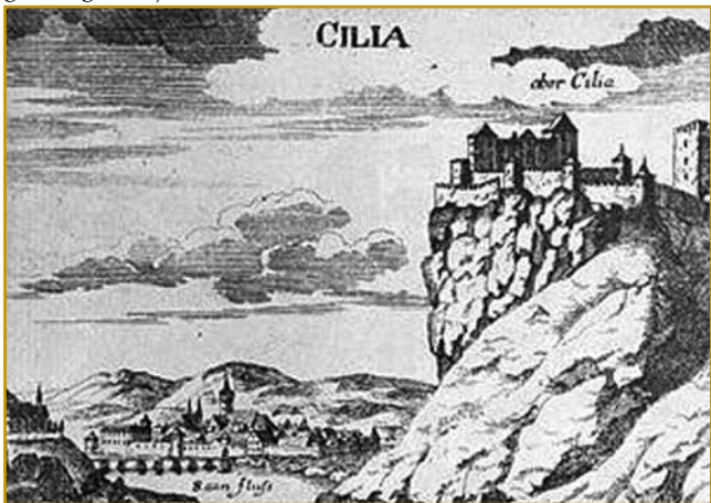
Takšen je celjski grad kaulak leta 1500 vōgledlo, gda pa njegvi grofov več nej bilau. Drugi gospaudje so ga prejkvezeli

prej skaučimo. Tam kaulak let 1100 se je varaš Cyilie zvau. V tom časi se oprvin od eni velki gospaudov, grofov začne pisati. Gvüšno, ka nej v novinaj, eške ji je nej bilau. V stari dokumentaj se oprvin leko