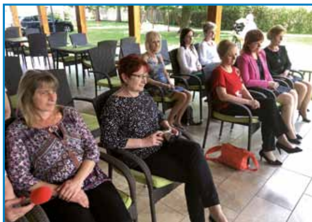
Del občinstva na »Poletnem literarnem potovanju« na terasi Slovenskega doma

»Bralna značka prav gotovo spada med dejavnosti, s katerimi želimo tudi onkraj meje doseči razvoj in širje-