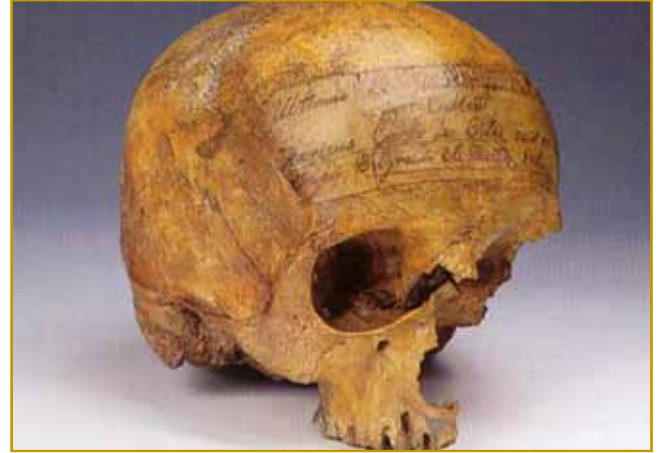
V muzeji Celje si lidge leko Ulrikovo glavo poglednejo, tau, ka je od nje ostanolo

tau, ka so nej Slovenci pa nej Nemci bili. Uni so se sami za sebe meli. Tau nam od toga tō pripovejda, kakši velikaške so tau bili.