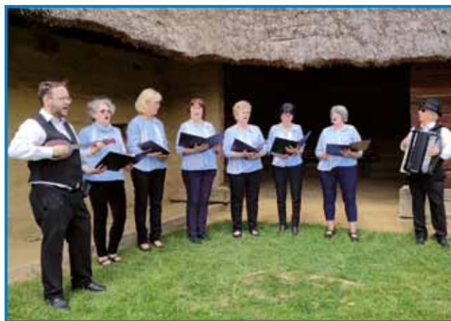
»Igrala je Mukičova banda« - Sombotelske spominčice en par mejsecov že pá odijo na probe

»Pokojna moja parcetkorca je bila oseba, štero smo vsi radi meli. Mejla je poštenjé v Števanovci in vseposedik, dej je ojdla ali pa delala. Na njau mo se vsikdar z lejrimi