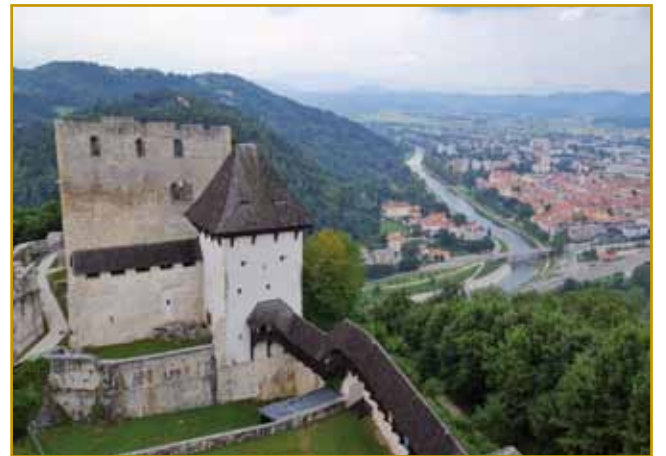
Od staroga grada više Celja pa reke Savinje eške gnes zidine stodjijo. Pripovejda jo nam od velikašov, steri so zgodovino Evrope spremenili

Gnes Celje v svojom časi živé. Depa kamakoli se po njem obrnete ali pa više njega poglednete, leko se dosta toga vidi, ka je indasvejta napravleno bilau. Lidge iz Celja pa kaulak njega