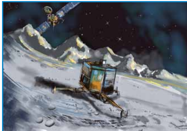
Tako nekako naj bi izgledal robot Philae, ki ga je leta 2014 na komet Čurjumov-Gerasimenko poslala vesoljska sonda Rosetta – »možgane« naprave so sprogramirali madžarski inženirji

Še bolj prepoznavna je bila madžarska udeležba pri kon-