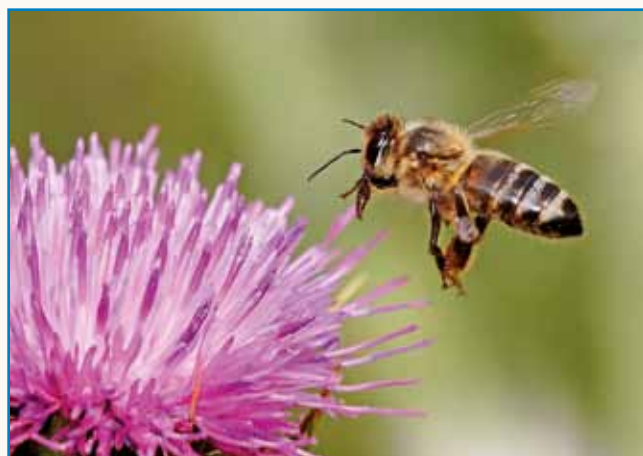
Pazi na čebele kot na zenico svojega očesa! stran 6