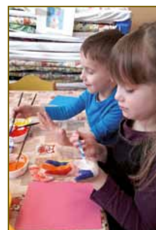
Pust na Dvojezični osnovni šoli Jožefa Košiča