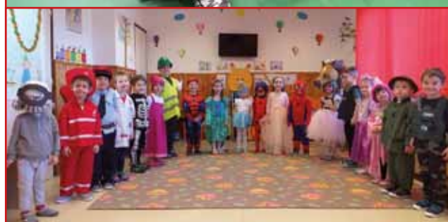
Pustne maškare na šoli in v vrtcu Števanovci