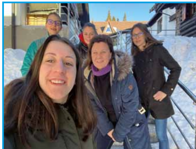
SKUPINA SNEŽINKE (Biserkine)

smo šli nazaj smučat. Že smo bili boljše kot prej. Ob 16.00 smo prišli nazaj. Že smo bili zeloooooootuženi. Potem smo se vozili na bob. Pogled je bil čudovit. Ob 18.00 smo šli na večerjo. Ko smo konča-