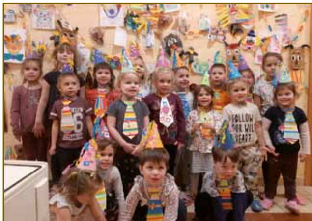
Nadeli smo si barvne črtaste kravate in pisane klobučke. Vrtec na Gornjem Seniku