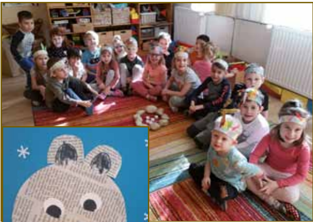
Mi smo indijanci

V vrtcih smo spoznavali gozdne živali. To so bile jelen, srna, zajček, veverica, lisica, sova, divji prašič in medved. Povedali smo, katere živali so zimo prespale in se naučili novo gibalno igro ter pesmico.